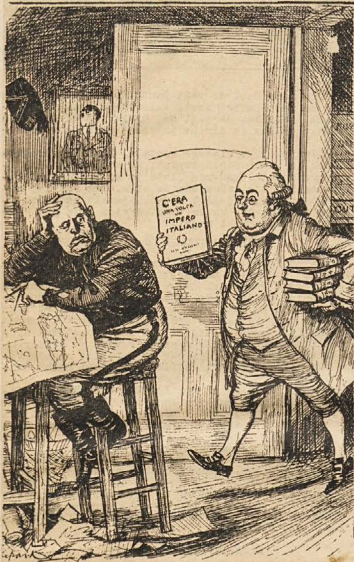
GLAVO PLEŠASTO SI PULI MUSSOLINČEK... CARSTVO AFRIKANSKO JE POBRAL HUDIČEK...