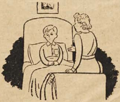
ZA MOJEGA OČKA, OČE NAŠ...

In še ena vroča želja naj kipi danes nam vsem iz polnega srca, da bi prihodnji božič praznovali skupaj, tam na Gospi Sveti, tam ob slovenski Nadiži, preko goriških Brd in preko slovenske Mure. Da bi prihodnji božič rodil svobodo vsem našim bratom, kjerkoli teče naša govorica in kjerkoli se prepeva naša pesem. To našo molitev, usliši Dete božično!