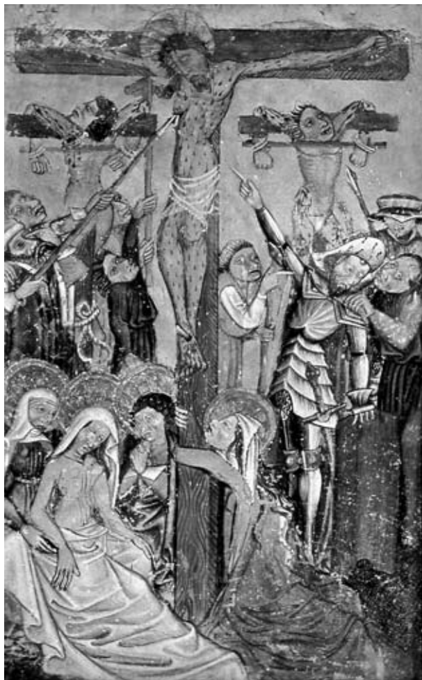
8. Križanje, špitalska c. sv. Duha, Slovenj Gradec

Morda je relativno pomanjkanje okrasja in dolgo vztrajanje pri preprostejši zunanjsčini – čeprav v skladu s splošnimi oblikovnimi smernicami nemškega sloga – vendarle odraz bližine italijanskega prostora, kjer se bogato okraševanje oklepov vse do konca 15. stoletja ni moglo prav uveljaviti. Razen žlebičene prsne plošče na Križanju v Slovenj Gradcu [118] iz petdesetih let najdemo več primerov pravega gotskega oklepa šele v zadnji četrtini stoletja (pasijonska cikla v Gerlamoosu [125] in Obermauernu [126]; Sv. Domicijan, Beljak [40]).