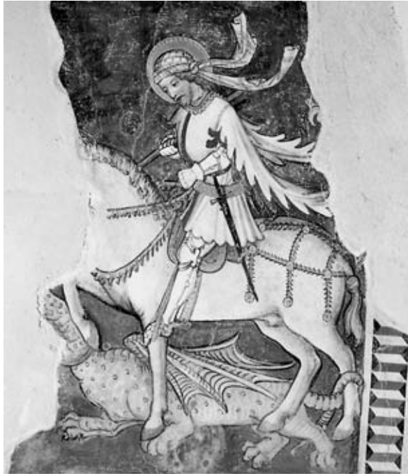
5. Sv. Jurij, p. c. sv. Kancijana, Selo nad Žirovnico

pri nas težko oboroženi vojaki preko oklepa za trup še nenavadno dolgo nosili tekstilna oblačila – in sicer v času, ko je drugod po Evropi že povsem prevladala moda nošenja »svetlega«, torej gola plosčnega oklepa brez tekstilnih pregrinjaj (npr. Miles Christi [134], Sv. Viljem Akvitanški [71] in Sv. Jurij [14], Brixen; Sv. Jurij, Mariapfarr [15]; Sv. Jurij, Selo nad Žirovnico [16]). Zdi se, da so se v nekaterih standardnih likovnih kompozicijah, denimo pri sv. Juriju, tekstilna pregrinjala obdržala celo še potem, ko so iz vsakdanje rabe večinoma že izginila.