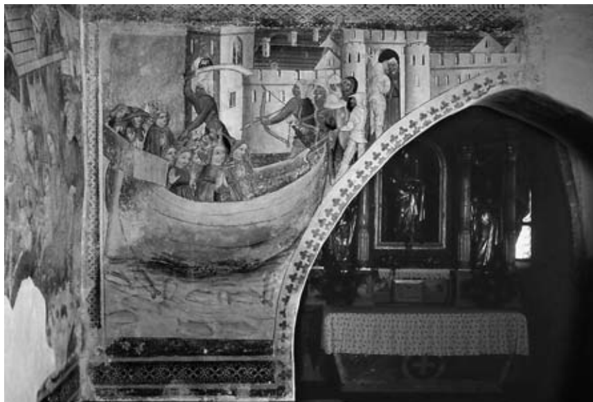
10. Mučeništvo sv. Uršule, p. c. sv. Miklavža, Mače nad Preddvorom

na ozemlju Republike Slovenije nadvse malo. Morda še najboljši predstavnik italijanskega sloga so prsne plošče na freskah sv. Ahaca [33], sv. Florijana [35] in Pohoda Sv. treh kraljev [99] na Turjaku. Dvodelne prsne plošče, pri katerih vrh trebušne lamele sega že skoraj do vratu, predstavljajo fazo razvoja, ki so jo v Italiji dosegli okrog leta 1455 in je torej na turjaških upodobitvah popolnoma aktualna.