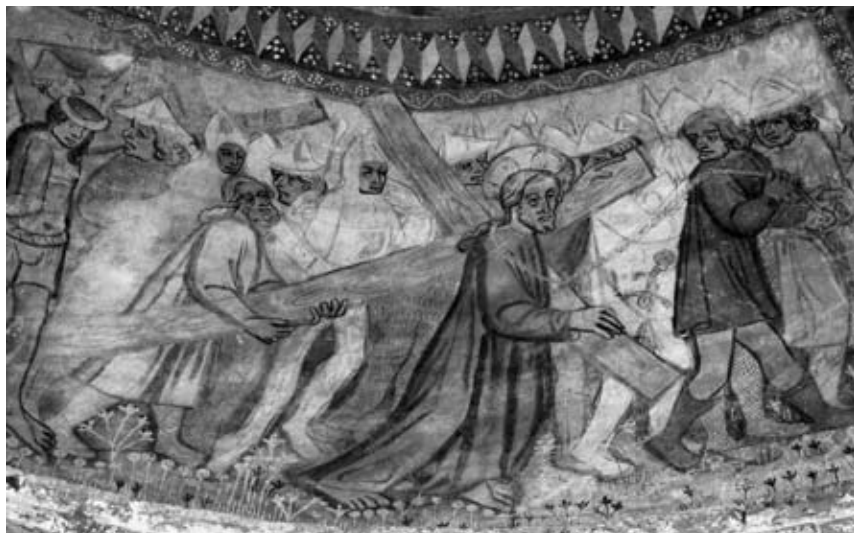
4. Kristus nosi križ, c. Device Marije in sv. Nikolaja, Selo v Prekmurju

dekorativnimi prilagoditvami. 4 V južni Nemčiji pa se je medtem razvijala druga velika evropska okleparska smer, ki je okrog leta 1460 privledla do nastanka »gotskega« sloga. 5 Okleparski mojstri iz južne Nemčije so se okrog leta 1450 že lahko enakopravno kosali s svojimi italijanskimi tekmeci, proti koncu stoletja pa so njihove izdelke po metalurški kakovosti naposled tudi prekosili, kakor dokazujejo nedavne naravoslovne študije. 6