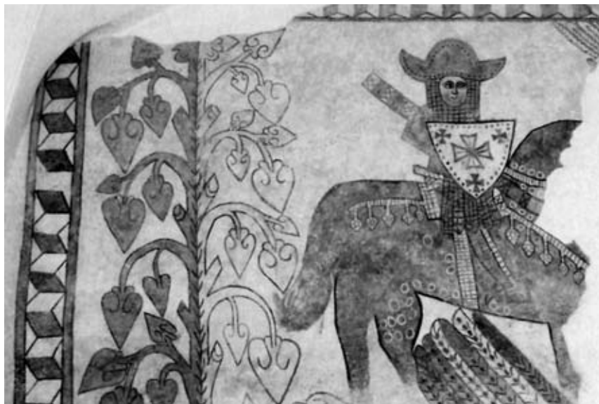
1. Sv. Jurij, c. sv. Jurija, Trnovec

veržno srajco, ki je bila tedaj očitno celo pri najbolj oboroženih vojakih še zmeraj sprejemljiva samostojna zaščita za trup. Kljub temu je jasno, da ostale vrste zaščitne opreme že izpodriva ploščni oklep.