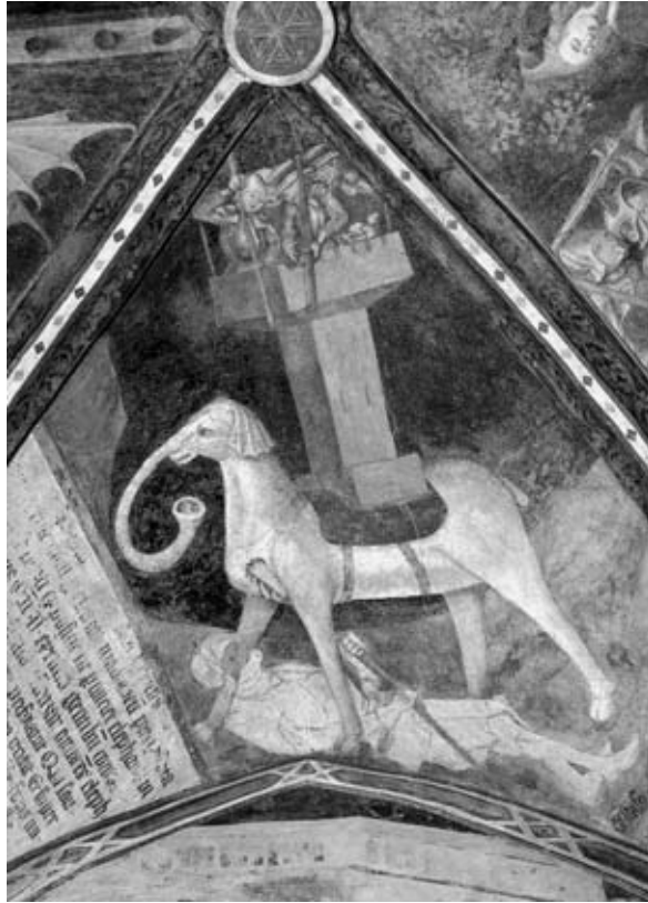
9. Eleazar ubije bojnega slona, Križni hodnik katedrale, Brixen

Ni malo primerov, ki kažejo oklepe sicer pretežno nemškega sloga v bolj tipično italijanskih konfiguracijah. Med njimi lahko omenimo nošenje verižnega ovratnika namesto ploščnega, ki se je v nemškem okolju zelo razširil po letu 1430, v Italiji pa šele v začetku 16. stoletja (Sv. Jurij, Spodnje Trušnje [19]; Sv. Jurij, Obermontani [20]; Sv. Jurij, Taisten [24]; Sv. Ahac, Bolzano [34]; Engelbert Spanheimski, Sv. Pavel v Labotski dolini [139]). Prav tako upodobljeni vojaki včasih namesto značilnih nemških laminiranih ploščnih copat nosijo le navadne čevlje ali pa jim stopala po italijanski modi pokriva kvečjemu verižnina (Vitez, Liemberg [137]; Sv. Jurij, Selo nad Žirovnico [16]; Sv. Jurij, Famlje [22]; pasijonska cikla v Strassnu [119] in v Brixnu [121, 123]). Vendar je nedvoumnih upodobitev polnokrvnega italijanskega oklepa