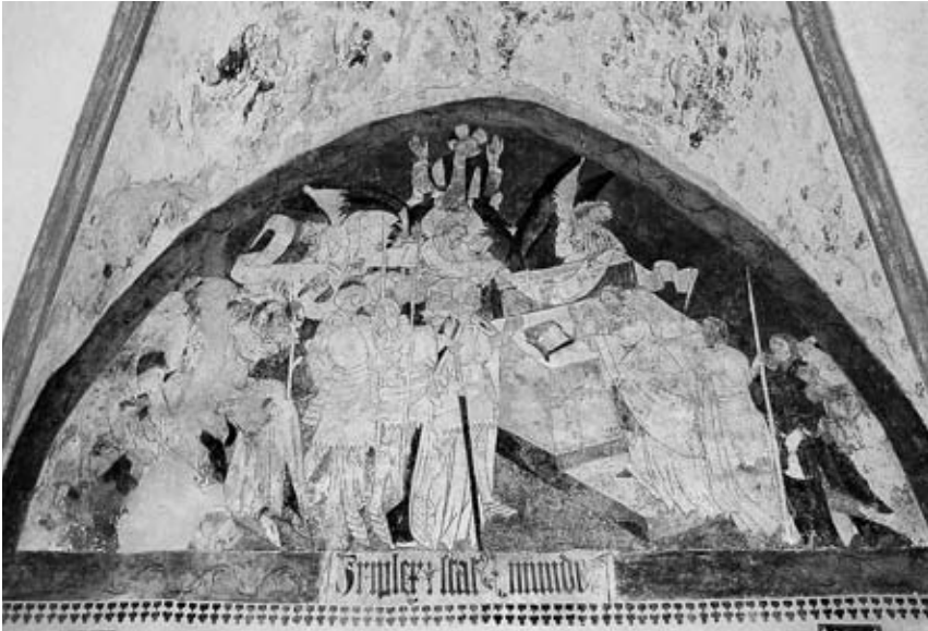
11. Trije redovi sveta, proštijška c. sv. Jurija, Ptuj