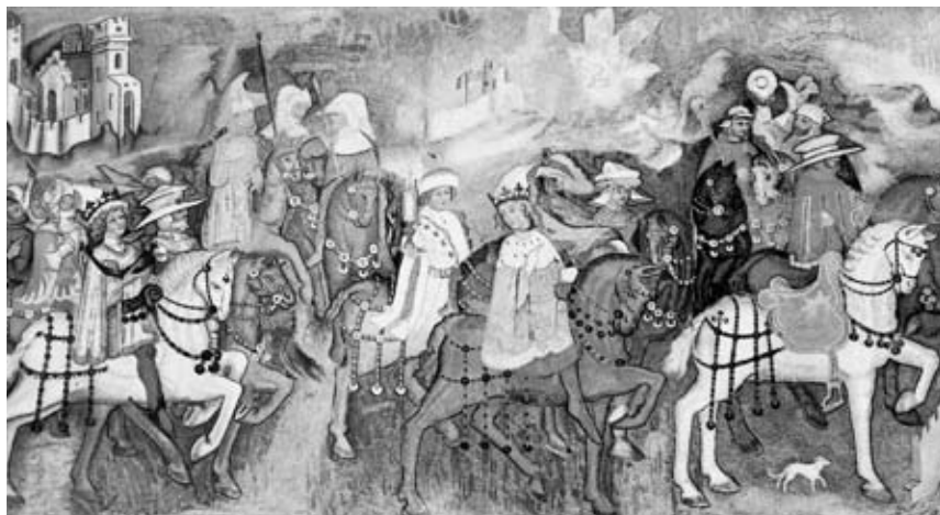
6. Poklon Sv. treh kraljev, Samostanska cerkev, Gospa Sveta