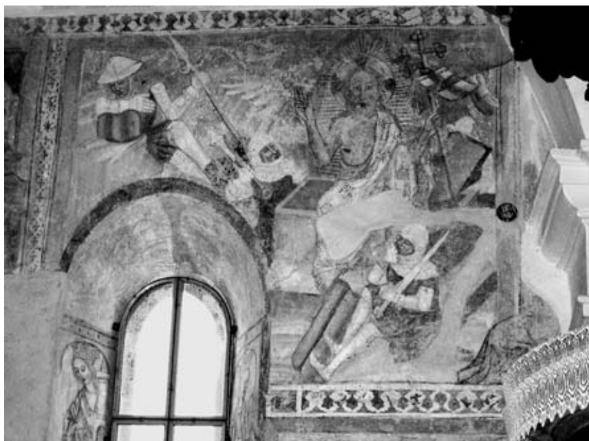
7. Vstajenje, p. c. sv. Radegunde, Srednja vas pri Šenčurju