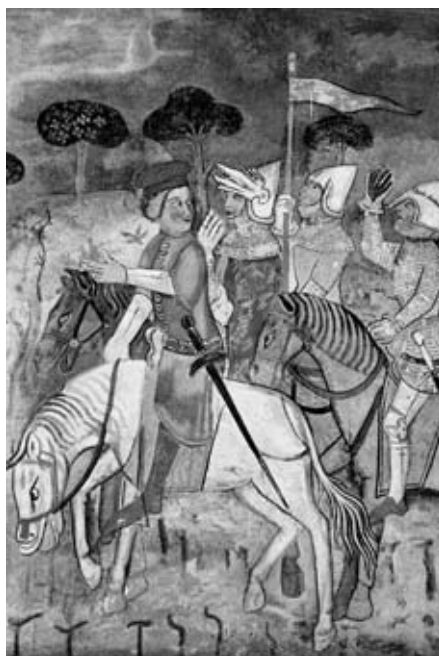
3. Savlov padeč, sam. c. Marijinega vnebovzetja, Krka na Koroškem