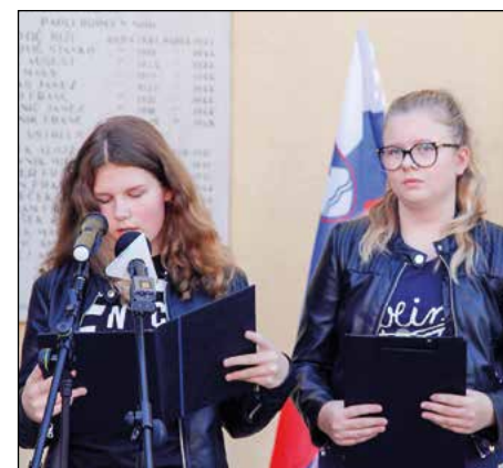
Spominski dogodek pri spominski plošči OŠ Hajdina