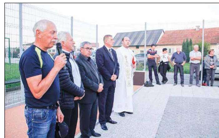
Slavnostni trenutek ob odprtju novih pridobitev pod Sitarjevo kapelo na Zg. Hajdini