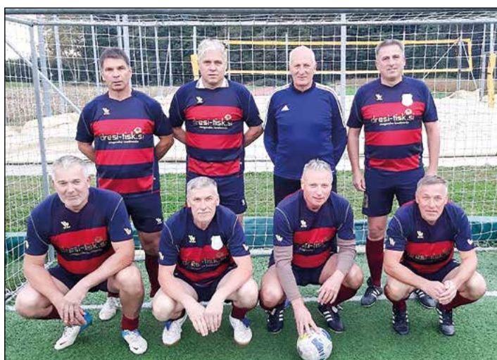
Hajdoše (veterani nad 50 let) – 3. mesto