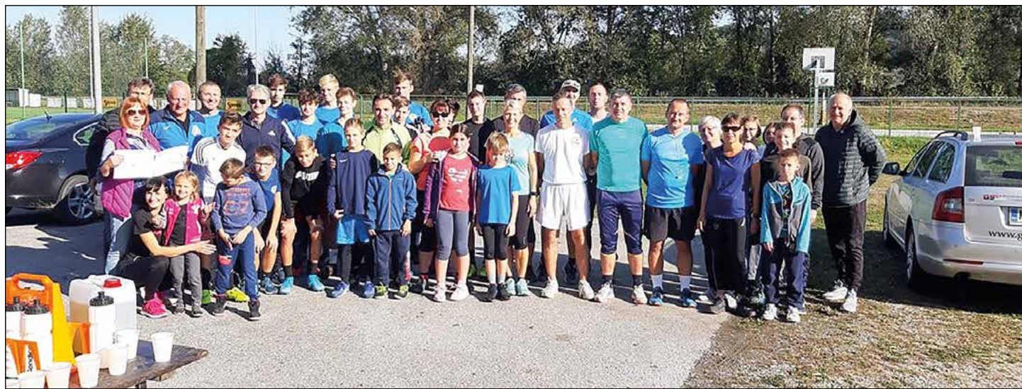
Skupinska fotografija tekačev

Športna zveza občine Hajdina je ob pomoči ŠD Hajdoše uspešno organizirala prvi uradni tek po občini Hajdina, poimenovan Hajdinska desetka. Letošnja premierna trasa je potekala na relaciji igrišče Hajdoše–obkanalska cesta–Slovenja vas in nazaj (dva kroga po dobrih 4,5 km).