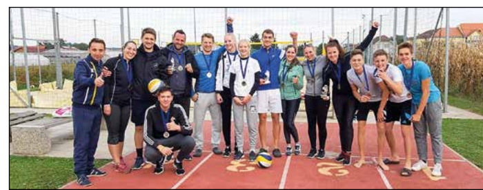
Skupinska fotografija udeležencev

Sandi Mertelj