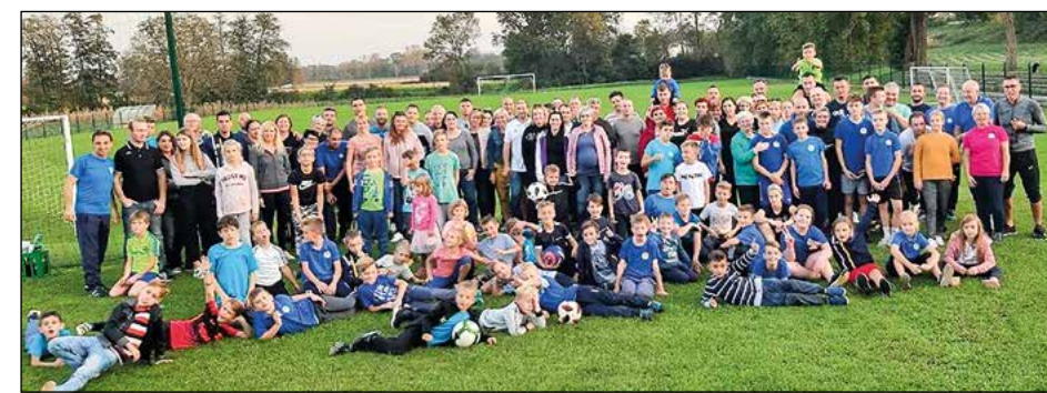
Skupinska fotografija z dneva ONŠ Golgeter Hajdina 2019