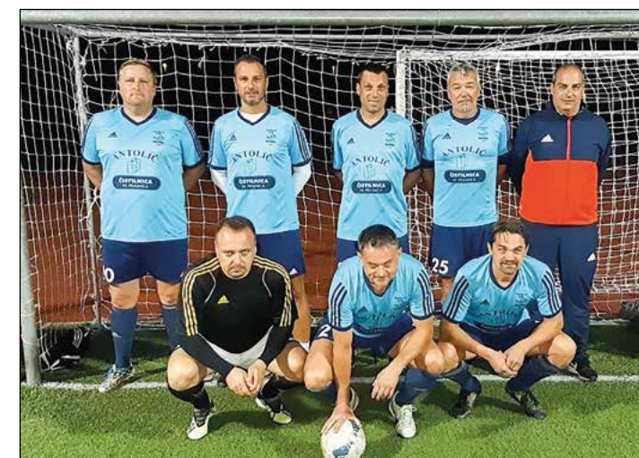
Skorba (veterani nad 35 let) – 3. mesto