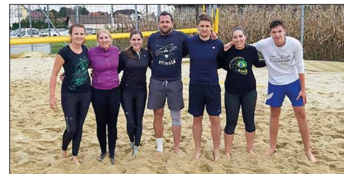
Dvoboj Gerečja vas – Hajdoše I