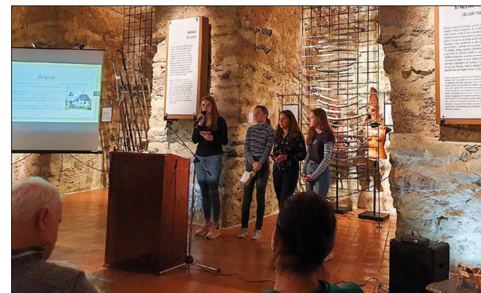
Devetošolke na javni prireditvi Mali simpozij 2019