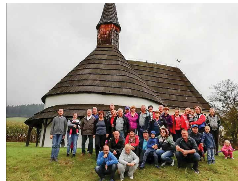
Rotunda sv. Janeza Krstnika na Muti

Leto je naokrog in gasilci iz Gerečje vasi smo se 7. septembra ponovno odpravili raziskovat slovenske kraje. Letos nas je pot vodila skozi Dravsko dolino proti Koroški. Izlet je potekal v sproščnem vzdušju, udeležilo pa se ga je mnogo Gerečanov in Gerečank različnih starostnih skupin.