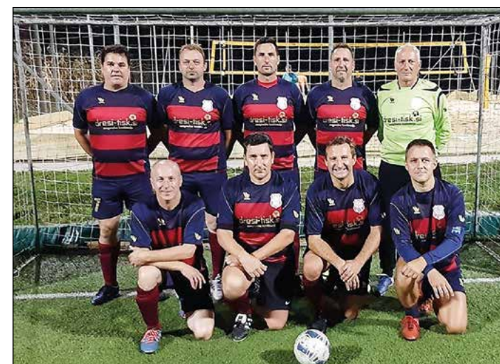
Hajdoše (veterani nad 35 let) – 2. mesto