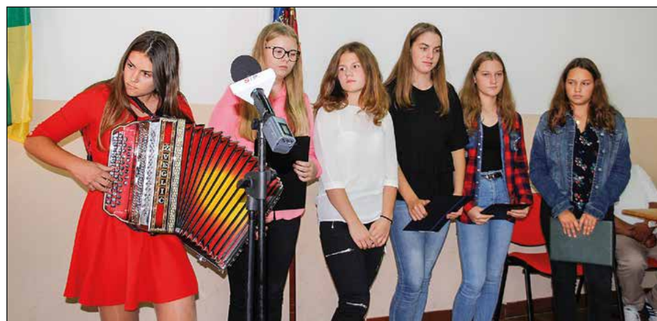
Utrinek z letošnje spominske slovesnosti v Dolni, kjer so nastopile tudi učenke OŠ Hajdina.