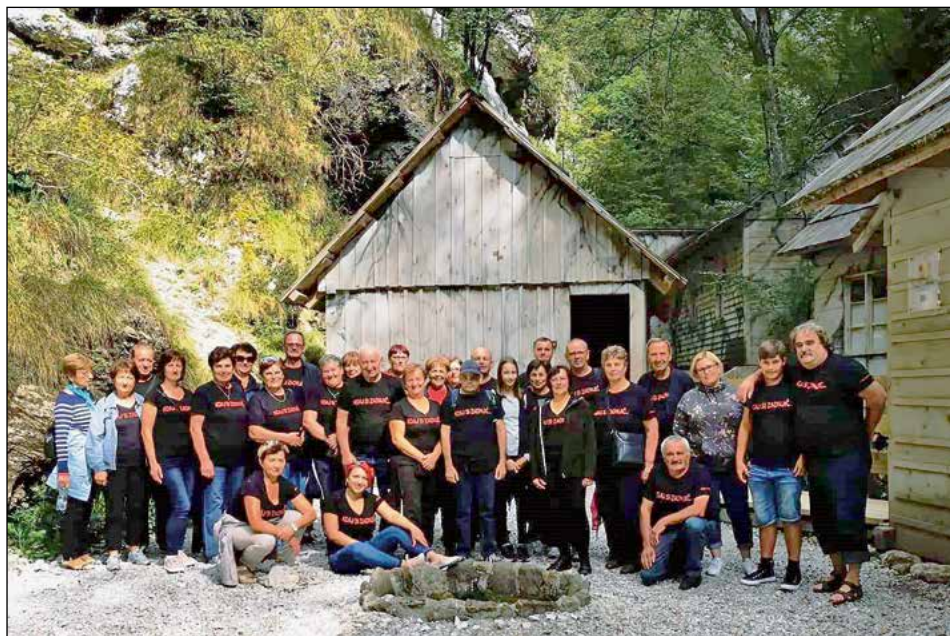
Utrinka z letošnjega izleta hajdinskih članov in podpornikov OO Rdečega križa Hajdina

V soboto, 14. septembra, smo se krvodajalci, člani in aktivisti Občinske organizacije Rdečega križa Hajdina podali na potepanje po naši prelepi Sloveniji. Po odhodu z domače Hajdine smo se podali na vožnjo mimo Celja in Ljubljane, kjer smo se ob prvem postanku na poti tudi prvič okrepčali.