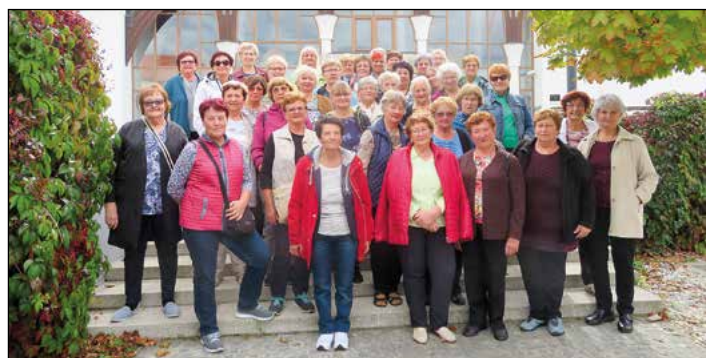
Članice DŽD občine Hajdina na izletu po Prekmurju

Letos smo se ponovno odpravile v Prekmurje. Najprej smo se ustavile v oljarni Kocbek. Nato smo se odpeljale na Malo Polano, kjer smo obiskale zadrugo Pomelaj. Zadruga skrbi za razvoj podeželja, domače obrti in kulinarike. Občudovale smo različne izdelke iz ličja in šibja. Prikazali so nam tudi izdelavo cekarjev in pripravili degustacijo njihovih kulinaričnih izdelkov. Obiskale smo tudi čokoladnico Passero v Tešanovcih in se poučile, kako se izdeluje čokolada, ki slovi po izbranih domačih okusih. Od tod smo se odpeljale na ogled Lendave in ni šlo brez vzpona na Vinarium – lendavski razgledni stolp. Pogled s stolpa je enkraten, v katero koli smer se obrneš, se pod teboj razprostirajo lepe gorice, zeleni pašniki ali obdelana polja. Za konec smo se odpravile v Šalovce, na eko socialno kmetijo Korenika. Kmetija vključuje in zaposluje ranljive družbene skupine. Trenutno je zaposlenih 40 ljudi. Prijazna socialna delavka nam je razkazala zeliščni vrt, staje z živalmi, različne pasme prašičev, v njihovi trgovini