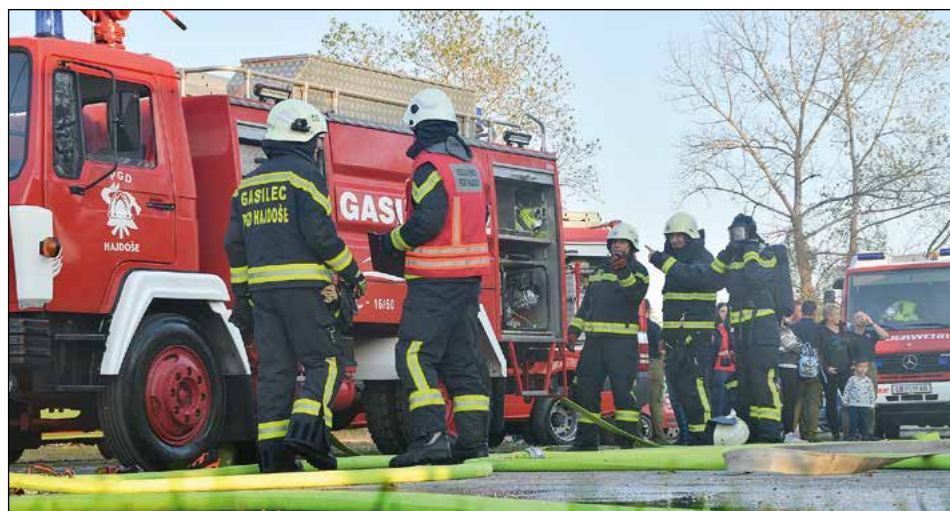
Oktobrski dan odprtih vrat v PGD Hajdoše