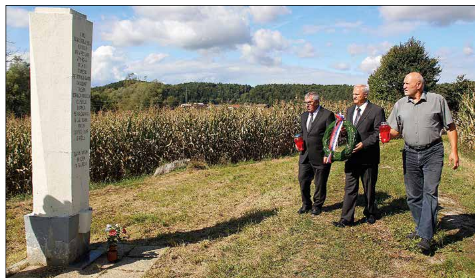
Delegacija pri spomeniku v Zg. Pristavi