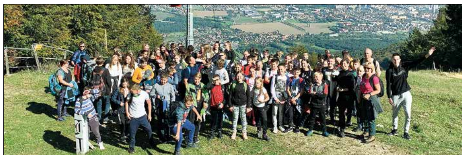
Nasmejani obrazi na cilju