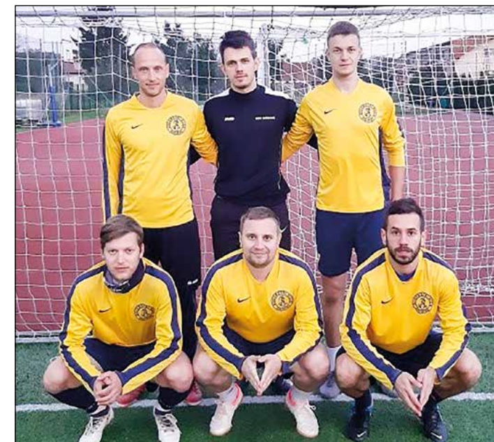
Hajdina (člani) – 2. mesto