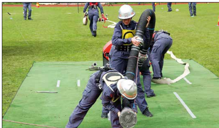
Hajdoške gasilke so na tekmovanju na Bogatajevih dnevih zaščite in reševanja znova dokazale, da nimajo pravih tekmecev v svoji kategoriji.