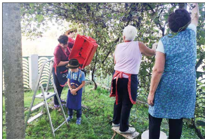
Najprej so grozdje pobrali na Zelenkovih brajdah.