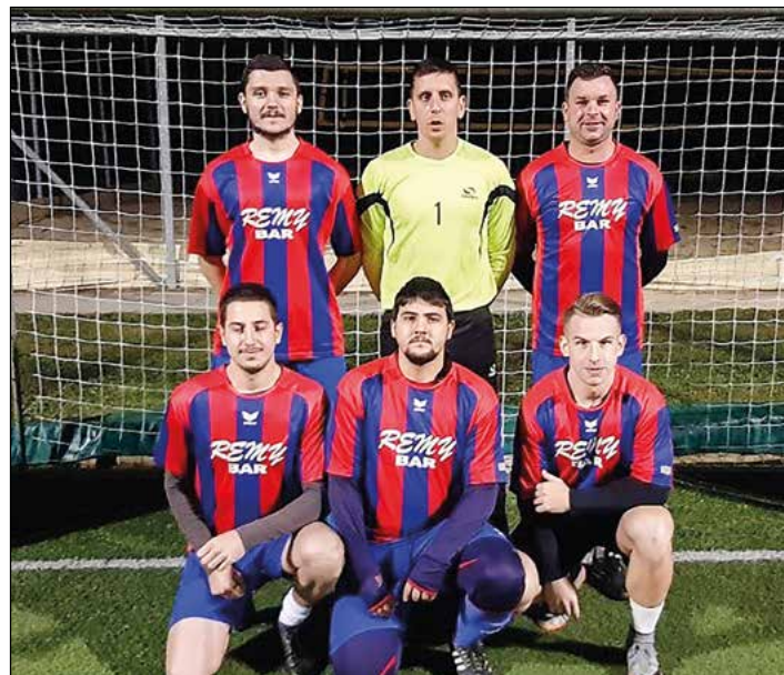
Slovenja vas (člani) – 6. mesto