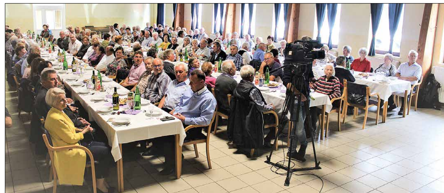
Pogled na desni del dvorane. Pogled na prisotne priča o tem, da se število udeležencev iz leta v leto veča.