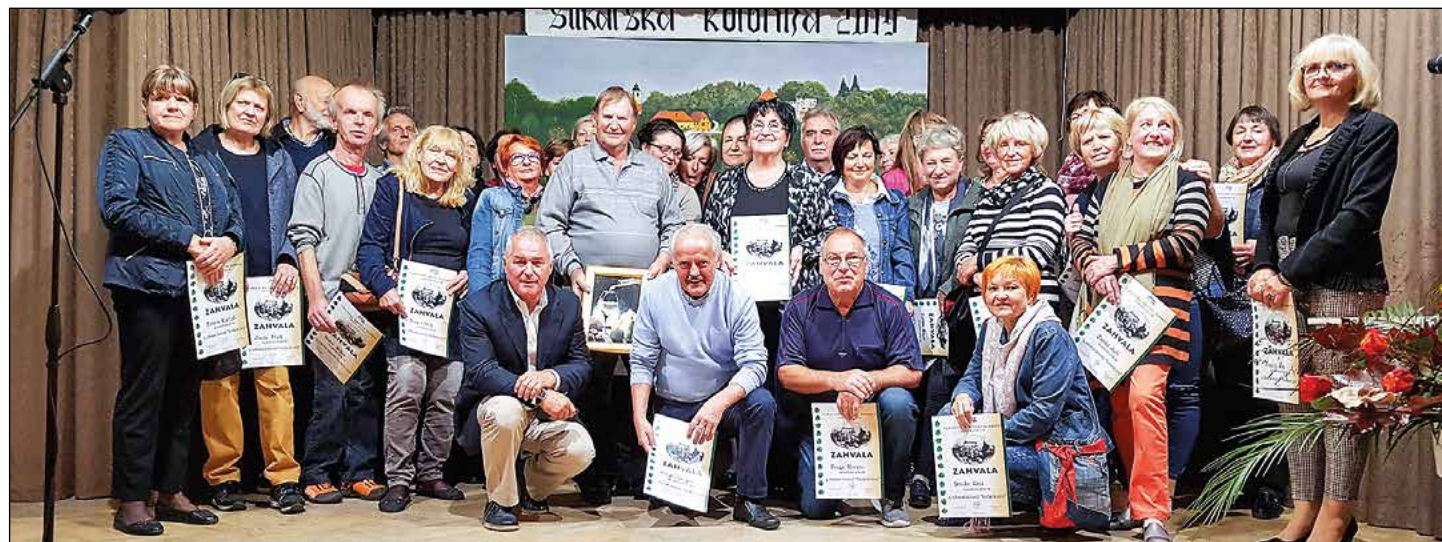
Skupinski posnetek razstavljalcev