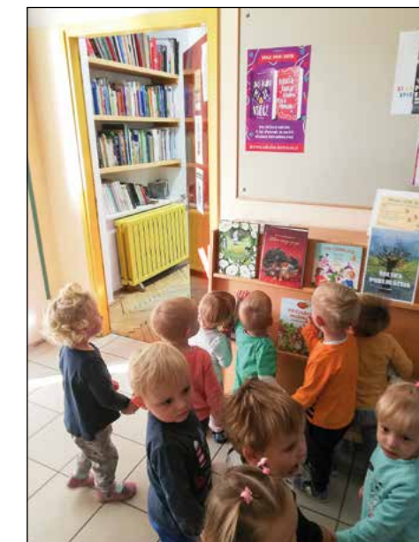
Otroci vijolične igralnice med obiskom šolske knjižnice