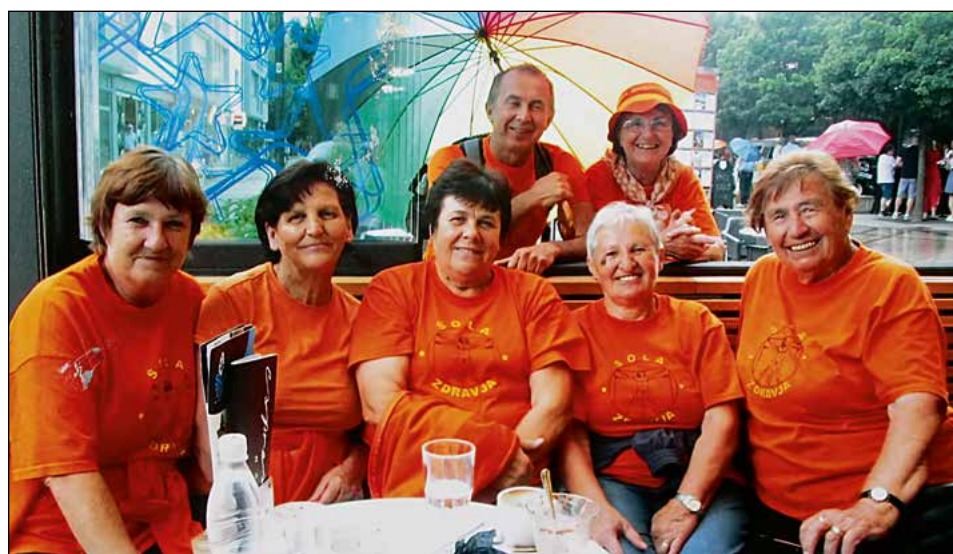
Hajdinčanke z Grishinom