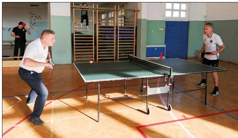
Župan občine Hajdina v akciji