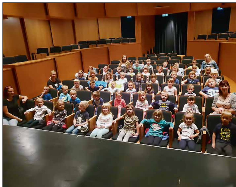
Otroci rdeče in bele igralnice na ogledu predstave v Mestnem gledališču Ptuj

V sredo, 2. oktobra, smo se z avtobusom zapeljali do pešmostu. Od tam smo pot nadaljevali peš proti Mestnemu gledališču Ptuj. Sedeminštideset veselih in nasmejanih otrok se je v spremstvu svojih vzgojiteljic odpravilo novemu doživetju naproti. Predstava Travnik čarobne lepote pripoveduje o deklici, ki je zelo rada plesala, a jo je posmehovanje otrok v vrtcu tako potrla, da je povsem izgubila zaupanje vase. Njen prijatelj medvedek jo povabi v čarobni svet, kjer se ji s pomočjo pravljčnih bitij in njenega poguma razkrije skrivnost. Otrokom je bila predstava zelo všeč. Ko smo se kasneje pogovarjali o vide-nem, so opisovali sporočilo zgodbe,