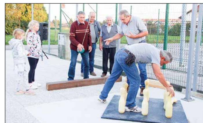
Novo kegljišče s kroglo na vrvcu pa tudi balinišče so na Zg. Hajdini že preizkusili.