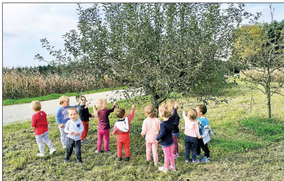
Igra v naravi in opazovanje jablane