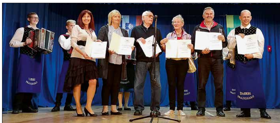
Utrinek s praznovanja 20-letnice