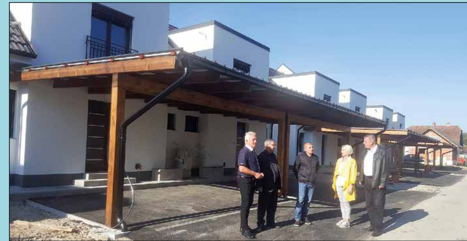
Hajdinsko občinsko vodstvo na ogledu hiš dvojčkov v Gerečji vasi

V naselju Gerečja vas, v zaselku Gajec, kjer zadnjih petnajst let nastaja nova soseska moderno zasnovanih hiš, se letos jeseni končuje gradnja novih moderno zasnovanih hiš dvojčkov. Hiše so že naprodaj in bodo vseljive konec tega leta, investitor pa je znano podjetje LKV INO, prevozi in posredništvo, d. o. o., ki je že objavilo novico o začetku prodaje dvojčkov.