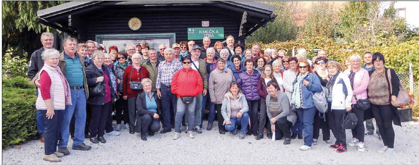
Hajdošani v Kočnem.

Članice Društva žensk Hajdoše so se v nedeljo, 20. oktobra, odpravile na popoldanski izlet v Kočno pri Polskavi. Zraven so povabile tudi svoje partnerje.