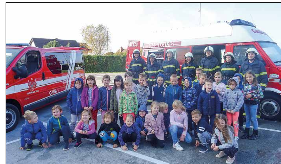
Prvošolci z gasilci PGD Slovenja vas

Po šolskem radiu je bilo šolske otroke dano obvestilo za začetek vaje, v vrtcu pa so bili obveščeni s strani vodje vrtca. Po označenih evakuacijskih poteh so vsi (učenci, zaposleni in otroci) zapustili prostore ter se zbrali pred šolo in vrtcem na zbornem mestu, ki je označeno z znakom. Med evakua-