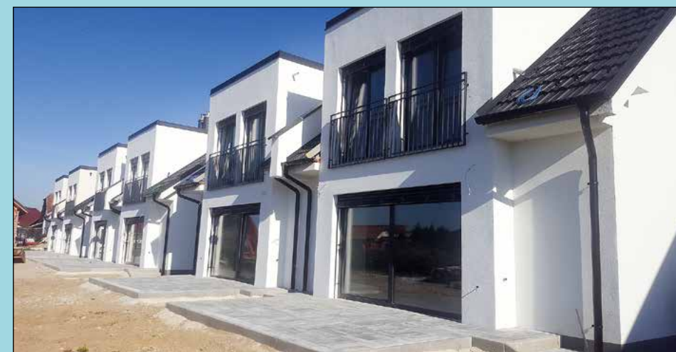
Še pogled na dvojčke od zadaj, kjer bo v teh dneh urejena tudi zelenica.

Moderna soseska treh dvojčkov v Gerečji vasi ustreza najnovejšim trendom bivanja, saj ponuja tudi idealno sožitje z naravo, je povedal Janko Malinger in dodal, da pa hkrati omogoča tudi hiter dostop v bližnji mesti Ptuj in Maribor, saj se hiše nahajajo blizu dveh priključkov na avtocesto. Vsaka enota ima 110 m 2 uporabne površine, sredinske enote imajo malenkost manjše parcele v izmeri 308 m 2 , vogalne merijo ena 405 m 2 , druga pa 424 m 2 . Zemljišče je lepo urejeno, do sredine novembra 2019 pa bodo vse hiše imele tudi že urejeno zelenico z zasaditvijo, je še dejal Malinger, ki verjame, da