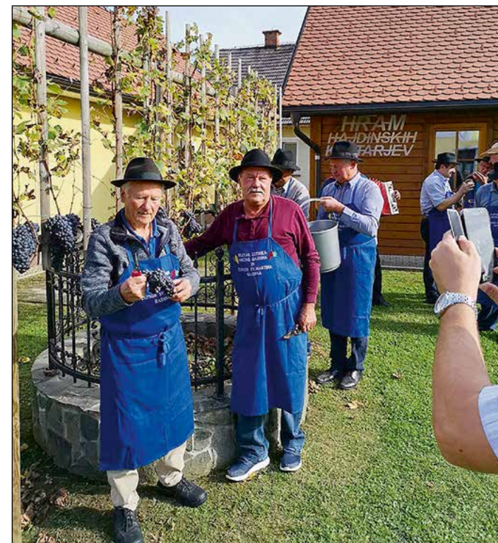
Letošnja trgatév potomke stare trte z Lenta na župnijskem dvorišču