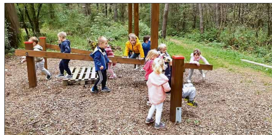
Gibalne igre v gozdičku so otrokom zelene igralnice zmeraj zanimive.