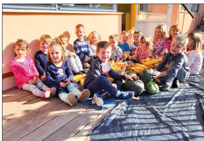
V rumeni igralnici smo se seznanjali s kmečkimi opravili.