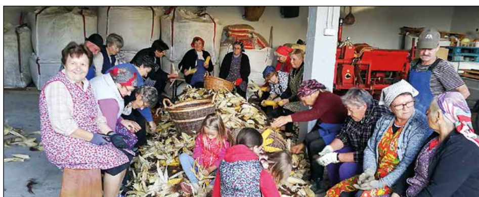
Tako je bilo na začetku ličkanja. Ko so prišli še muzikanti in se je miza šibila od dobrot, se je večer nadaljeval s klepetom, smehom, šalami in tudi s plesom.