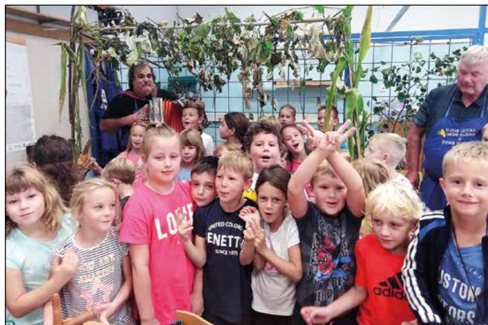
Na trgatvah je vedno veselo.