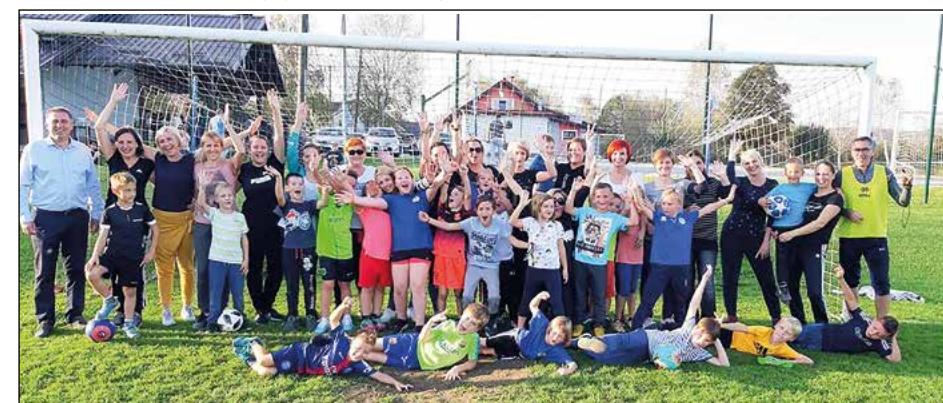
Mamiče in župan ter najmlajši otroci