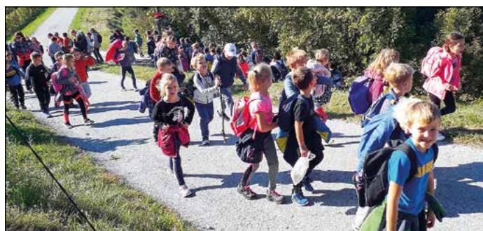
Hajdinski učenci na pohodu po Halozah