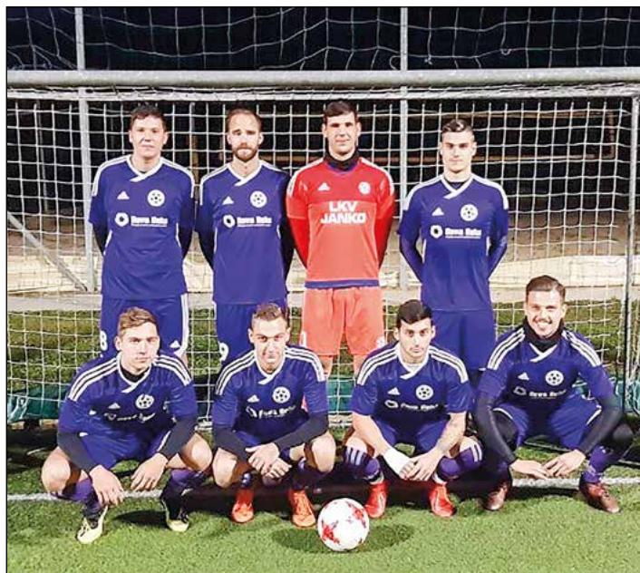
Gereča vas (člani) – 4. mesto