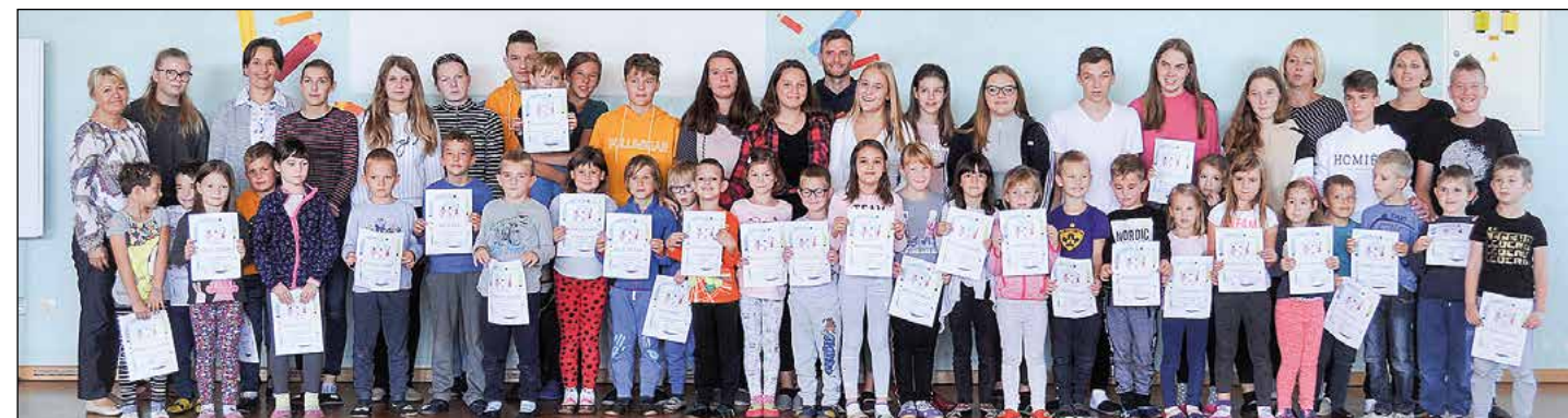
Prvošolci s prijatelji devetošolci.

V šolsko skupnost učencev (ŠSU) smo zajeti vsi učenci naše šole. Naše delo je, da učenci svoja mnenja, predloge, želje uveljavljajo prek predstavnikov razredov, ki se dvakrat mesečno udeležujemo sestankov šolske skupnosti. Tako imamo vsi učenci možnost soustvarjanja skupnega življenja na šoli.