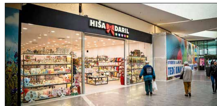
Do konca leta bodo imeli 28 trgovin po vsej Sloveniji.

stnih izdelkov. Koderman dodaja: »V ta namen smo vzpostavili tudi lasten studio z oblikovalci in piscem.« Hiša daril danes tako ni le prodajalec, ampak tudi proizvajalec. Trud vseh zaposlenih v podjetju prepoznavajo tako kupci kot strokovna javnost in temu pritrjuje razglasitev Hiše daril za malo podravsko podjetje leta 2018. »Postati želimo vaša prva misel, ko potrebujete darilo,« zaključuje Koderman.