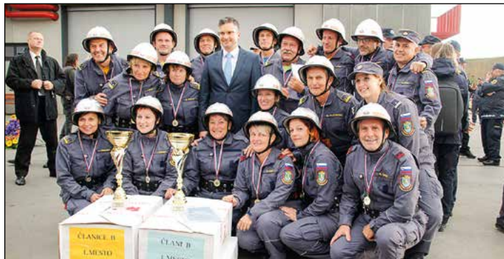
Zmaga za članice B in člani B PGD Hajdoše na gasilskem tekmovanju v Postojni. Na podelitvi se jim je pridružil tudi premier Marjan Šarec.