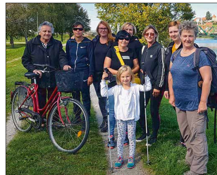
Draženska ekipa, ki je prehodila pot okrog Ptujkega jezera.

Po pohodu smo se pridružile drugim članicam našega društva pri ribniku v Dražencih, kjer smo nam člani društva