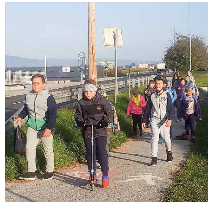
Vsako jutro so v hajdinsko šolo prihajali nasmejani obrazi iz Slovenje vasi, Hajdoš, Skorbe, Gerečje vasi, s Sp. in Zg. Hajdine.

Hoja nas sicer resda premika od točke A do B, a hkrati poskrbi tudi za vsaj minimalno raven fizične aktivnosti. Na krajših razdaljah je hoja najučinkovitejši in časovno zelo konkurenčen prometni način. Je drugi najpogostejši način premikanja v slovenskih naseljih, saj je primerna za krajše razdalje (do 2 km), kar je tudi približna dolžina pri nas opravljenih vsakokratnih poti. Zaradi vsega tega smo v septembru slavili hojo.