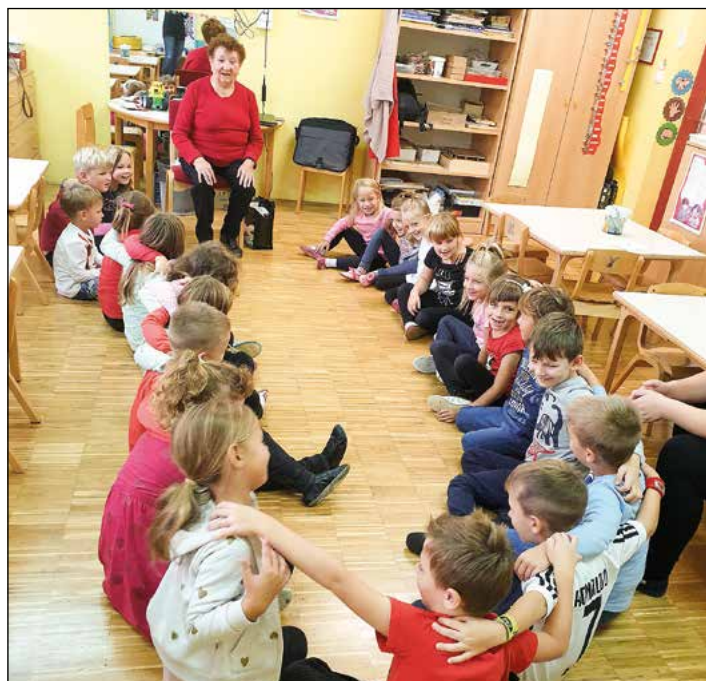
Otroci oranžne in vijolične igralnice so z zanimanjem prisluhnili obiskovalki.