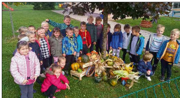
Jesensko razstavo pridelkov pred vrtcem so ustvarili otroci bele igralnice.