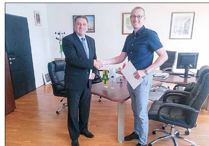
S Cestnim podjetjem Ptuj je podpisana nova pogodba za izvedbo agromelioracijskih del na komasacijskih območjih Hajdina 2 in 3.