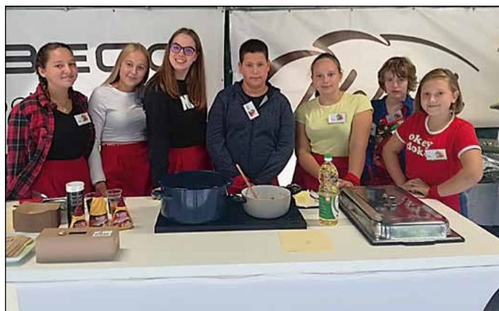
Mladi kuharji, ki so osvojili denarno nagrado.