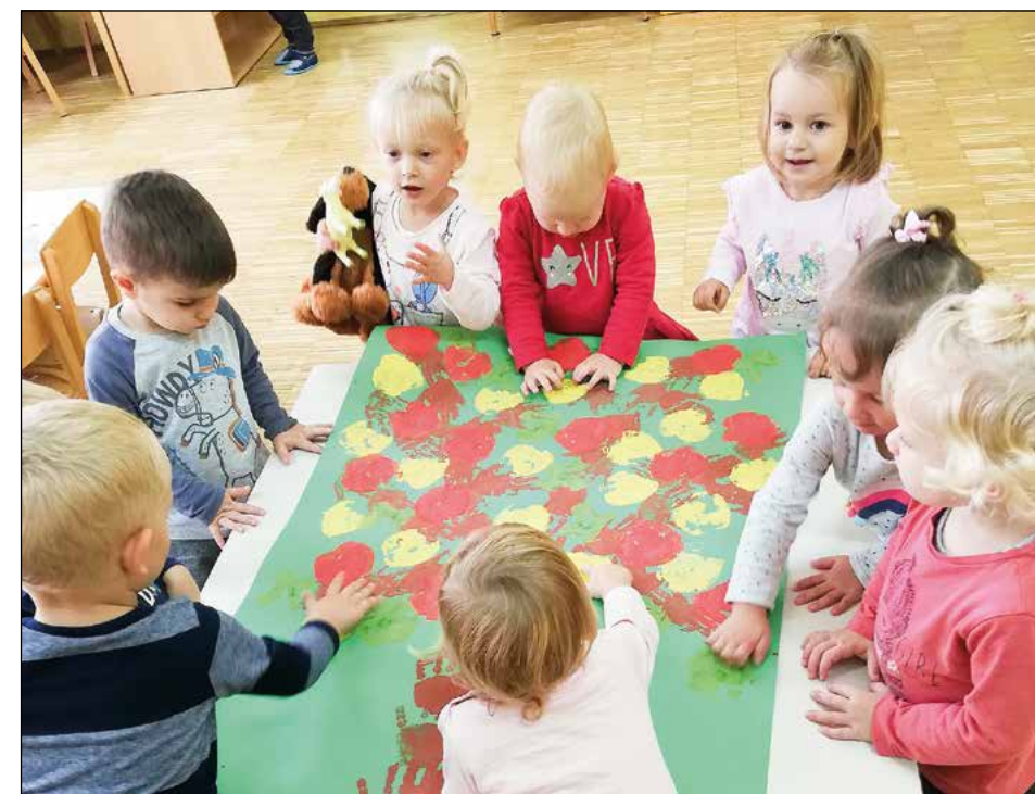
Otroci vijolične igralnice so z odtiskovanjem ustvarili pisano jablo. Tako upodobili deblo jabolane, sadeži pa so nastali z odtiskovanjem na polprerezanega jabolka. Otroci so pri likovnem ustvarjanju zelo uživali.

Tudi v vijolični igralnici smo tej dejavnosti posvetili tematiko. V svojem okolju smo na sprehodih spoznavali posebne elemente naravne krajine, ki jih je vredno izpostaviti. Tematika se je navezovala na posebna drevesa, ki smo jih opazovali na sprehodih – mogočna drevesa, drevesa zanimive rasti, posebne vrste dreves, zelo stara drevesa, drevorede smrek, območja gozdov, vrtove, nasade različnih kulturnih rastlin (ajda, oljna repica), nasade sadnih dreves. Nato smo izbrane elemente naravne krajine predstavili po navodilih organizatorja na poljubno izbrani likovni način in naš izdelek poslali na razstavo, ki jo prirejajo v Ljubljani. Otroci so z rjavo tempera barvo odtisnili svoje dlani in