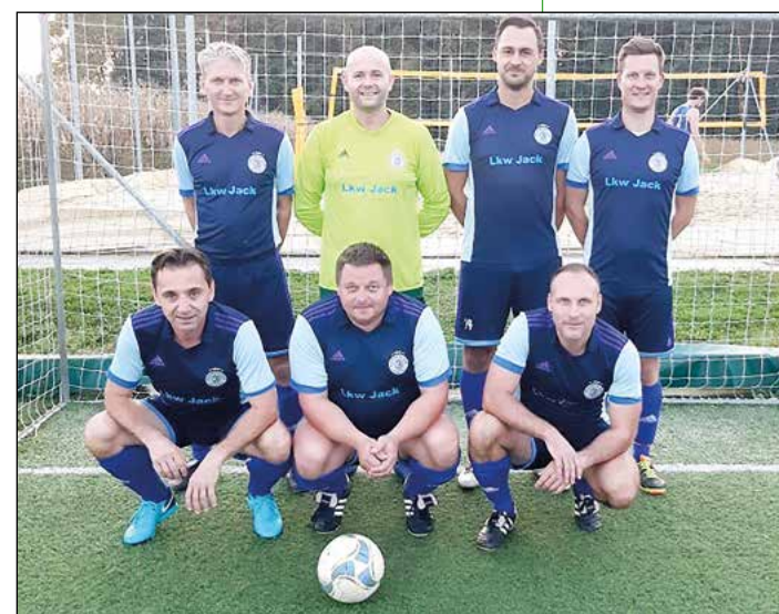
Hajdina (veterani nad 35 let) – 4. mesto