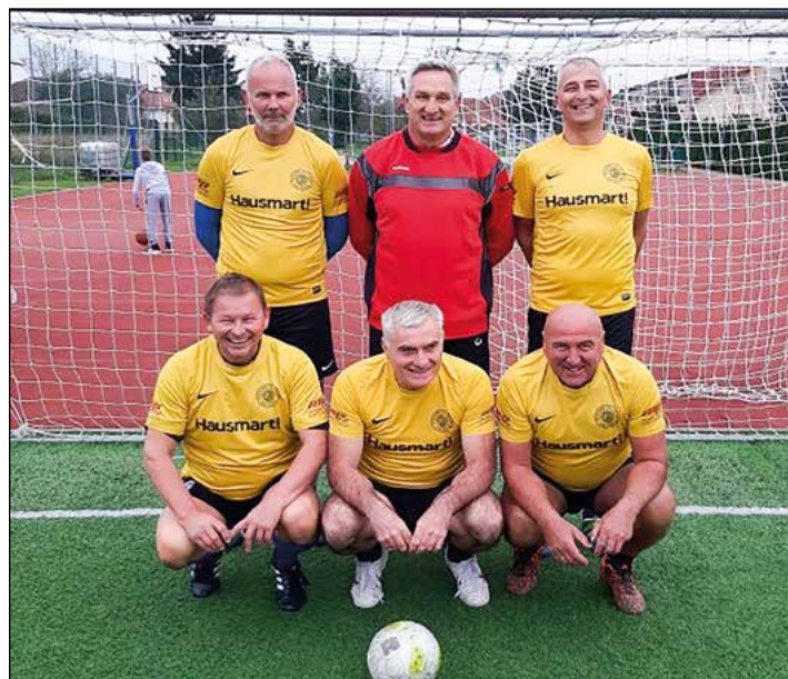
Hajdina (veterani nad 50 let) – 2. mesto