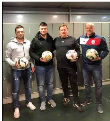
Zmagovalna ekipa Skorbe