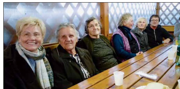
Na ribjem pikniku

V soboto, 12. oktobra, se je nekaj članic Društva gospodinj Draženci v lepem popoldnevu odpravilo na pohod okrog Ptujkega jezera. Pot nas je peljala od Semenarne do jezera v Markovcih in po drugi strani Drave nazaj čez pešmost do Semenarne. Med potjo smo se ustavile pri ptičji opazovalnici in na jezu v Markovcih, kjer smo se okrepčale z malico iz nahrbtnika.