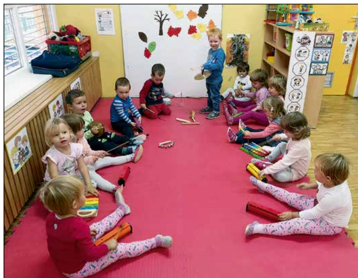
Ob igranju na glasbila so otroci modre igralnice ustvarjali pesem.