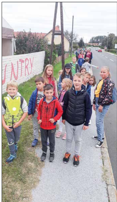
Peš na poti v šolo in domov