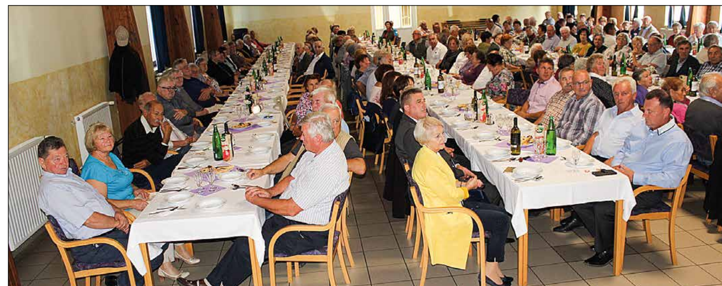
Pogled na levi del dvorane