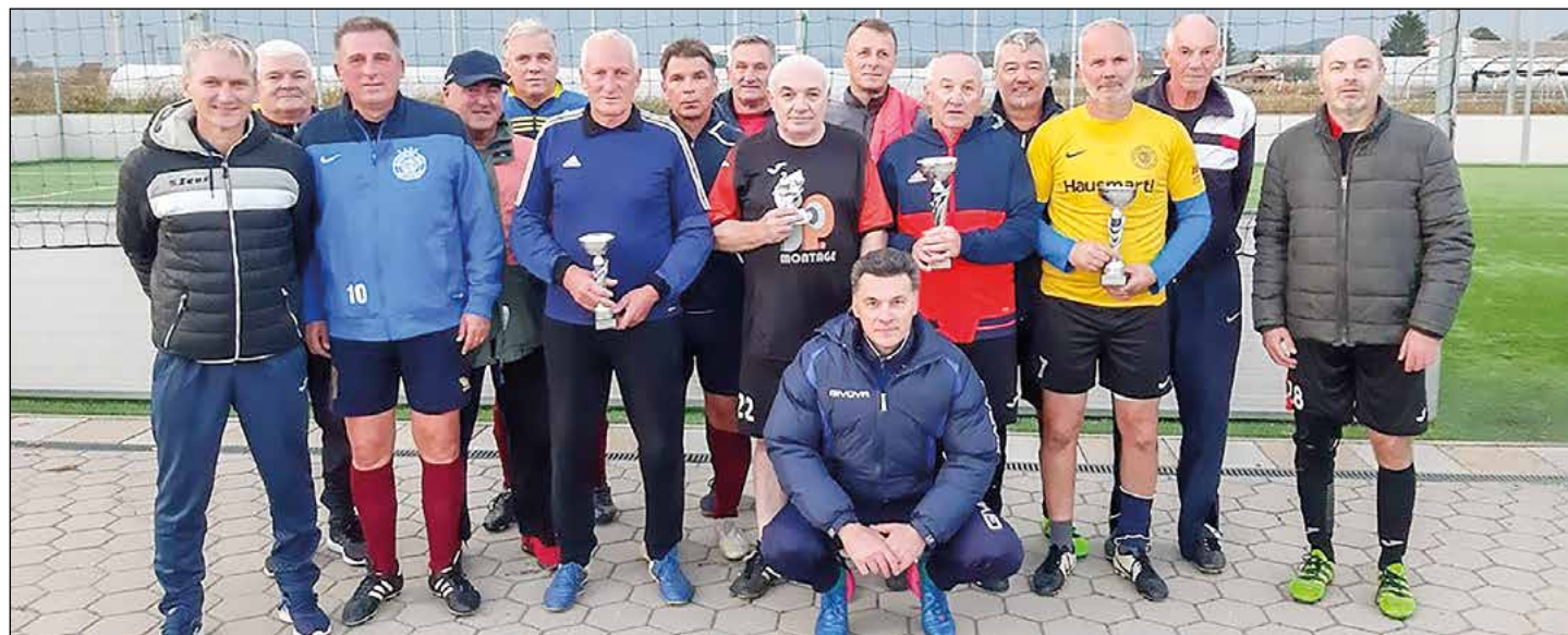
Skupinski posnetek veteranov nad 50 let