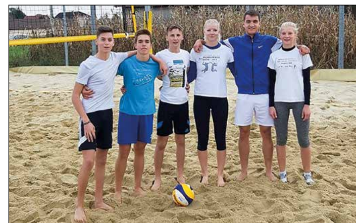
Dvoboj Draženci – Hajdoše II