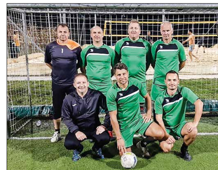
Draženci (veterani nad 35 let) – 5. mesto