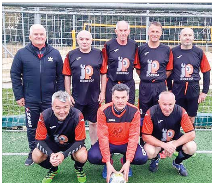
Skorba (veterani nad 50 let) – 1. mesto

Sandi Mertelj