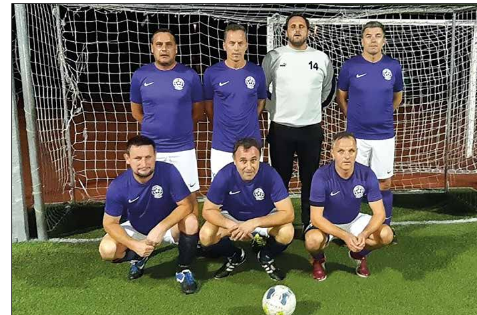
Gereča vas (veterani nad 35 let) – 1. mesto