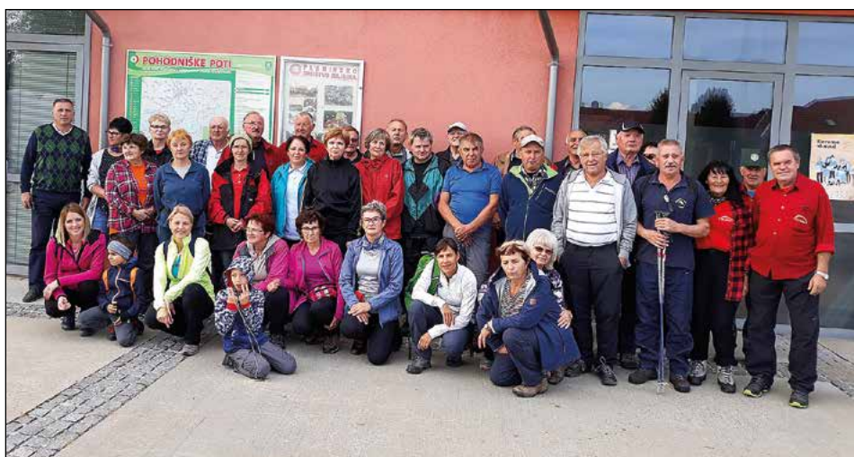
Pred odhodom z občinskega trga na Hajdini

Avtobus je nato 42 pohodnikov odpeljal na izhodišče pohoda, do Stare grabe, nekoliko naprej od kraja Sestrže. Nekaj udeležencev se je pohoda udeležilo v lastni režiji. Tam smo krenili najprej do Rudijevega doma. Ob poti smo opazovali pisane barve jesenskega listja, ki je ob rahlem vetru padalo na tla in pod nogami prijetno šelestelo. Pot do doma je ob prijetnem klepetu hitro minila in vsi udeleženci smo prispeli do doma brez velikih naporov, čeprav je nekaj pohodnikov štelo krepko čez sedem križev. Neka-