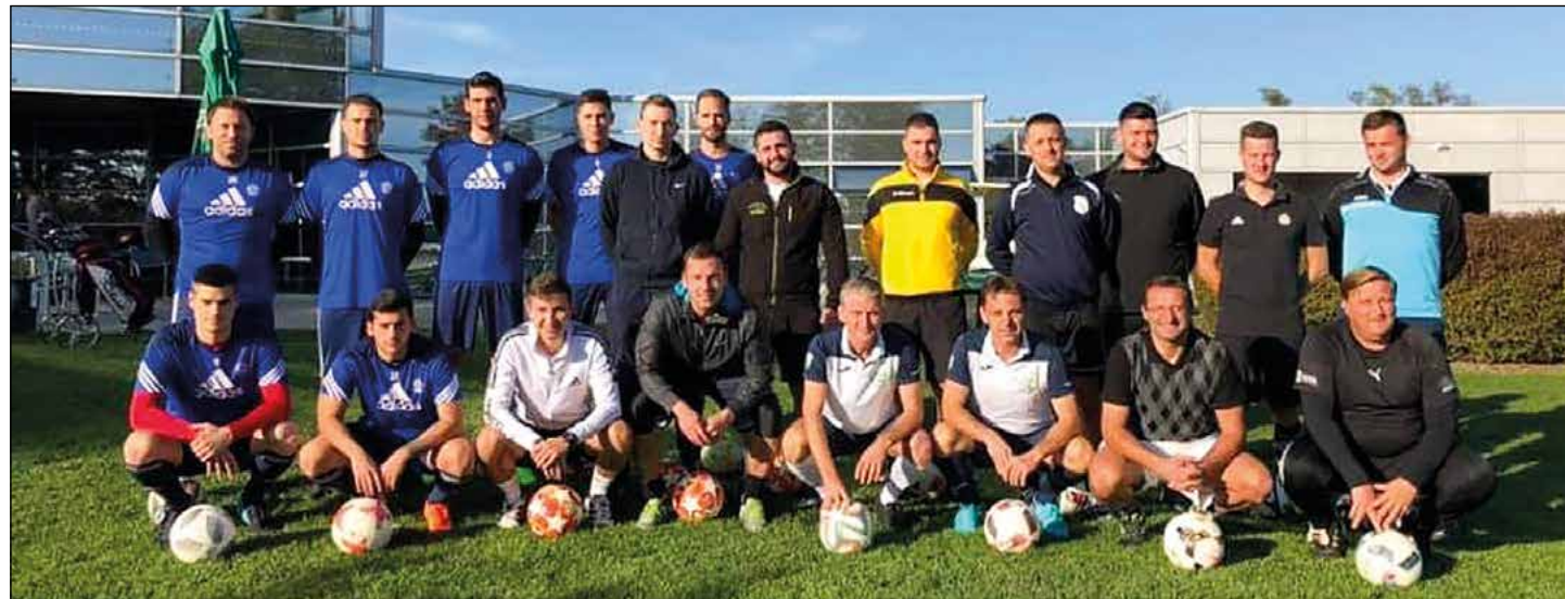
Footgolf 2019 – skupinska fotografija udeležencev

Športna zveza občine Hajdina je tudi letos na igrišču za golf na Ptuj organizirala občinsko tekmovanje v footgolfu, ki je letos privabilo kar 23 igralcev iz občine Hajdina. Spet so bili najboljši Skorbčani in tako upravičili vlogo glavnih favoritov.