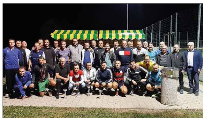
Skupinski posnetek veteranov nad 35 let