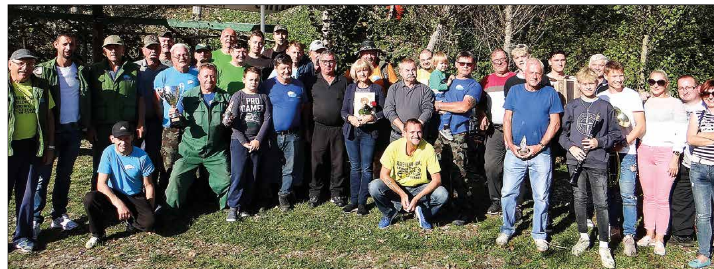
Ekipa, zbrana na memorialni tekmi