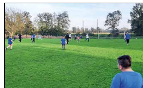
Utrinek s tekme ... Le kje je žoga?

čljiva zmagala 3 – 2 kljub navidezni posesti žoge v prid otrok. Očitno očetje in trenerji niso imeli milosti. Revanš baje sledi, a drugo leto. Na koncu je sledila še skupinska fotografija vseh vključenih in zaključek dneva v stilu: »To še pojemo in gremo!«