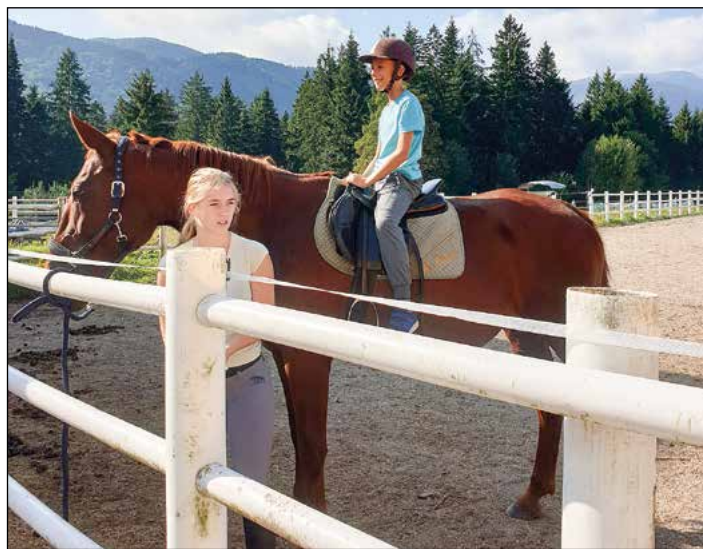
Mladi so lahko jahali konje.