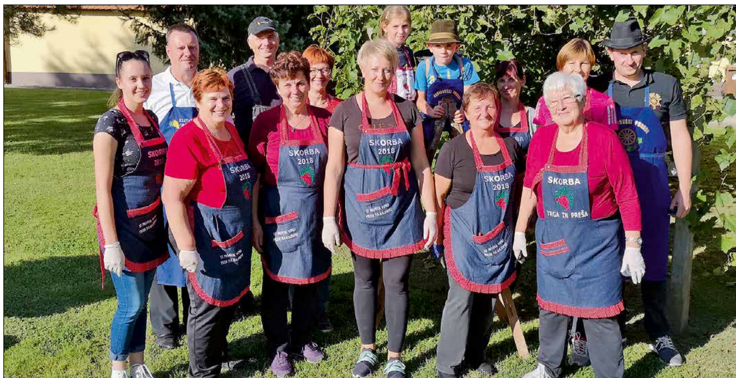
Vesela trgatév je bila tudi na župnijskem dvorišču.