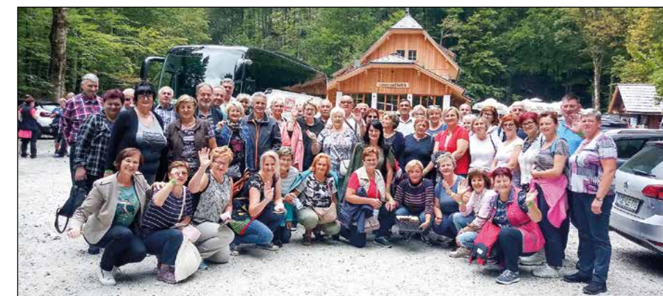
Skupinski posnetek pred planinskim domom Savica v Bohinju