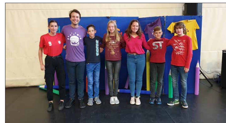
Hajdinski ekipe malih sivih celic