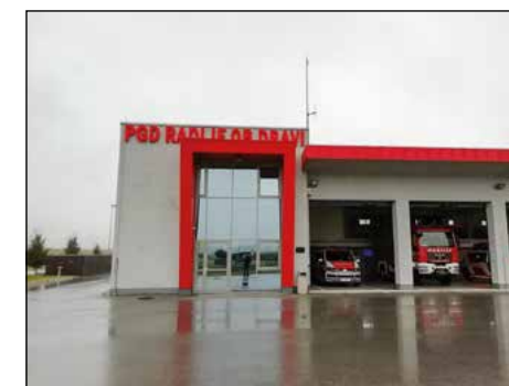
PGD Radlje ob Dravi