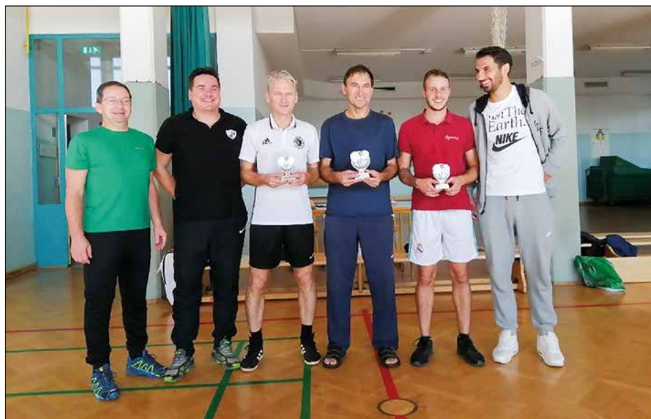
Najboljši na turnirju