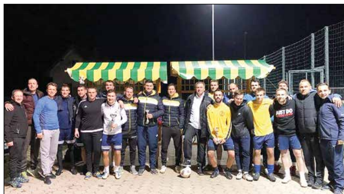
Skupinski posnetek vseh udeležencev članskega turnirja