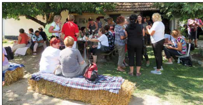
Štiri Hajdinčanke so se z Zvezo kmetič Slovenije potepale po Makedoniji.

Po kratkem ogledu mesta in pravoslavne cerkve sv. Dimitrija smo pot nadaljevale v Resen, kjer smo se srečale z ženskami s podeželja – Ruralna žena. Najprej smo si ogledale sadjarsko kmetijo, nato pa smo veselo poklepetale z ženskami, ki so nam pripravile sprejem in nas pogostile z