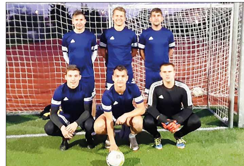
Draženci (člani) – 1. mesto