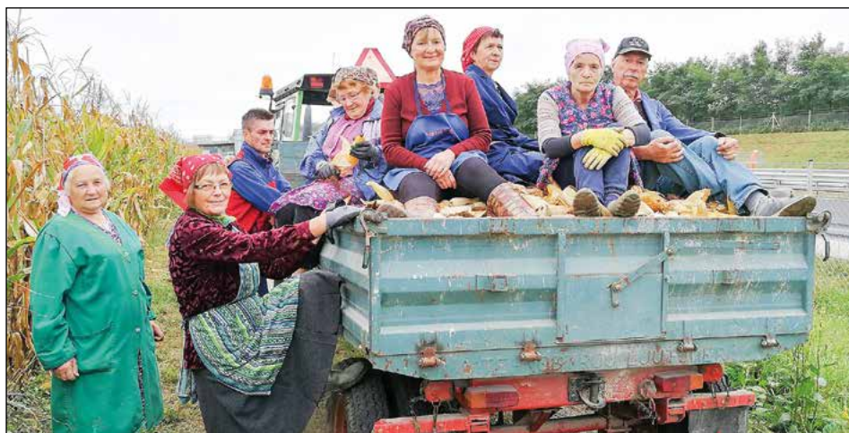
Koruza je potrgana. Razlika je le v prevozu. Nekoč je bila pred vozom konjska ali kravja vprega, danes je to le še atrakcija.