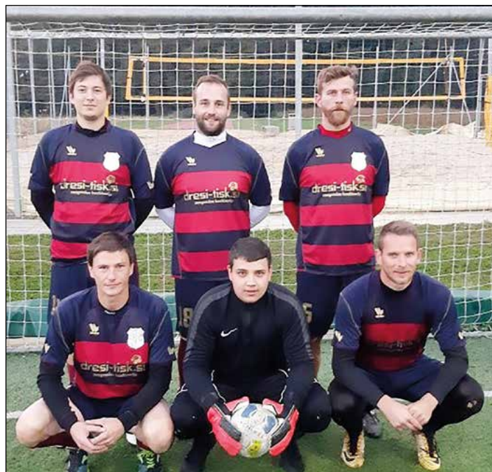
Hajdoše (člani) – 5. mesto