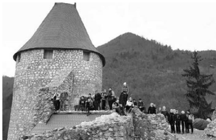
Naši pohodniki na gradu Žovnek

Letos smo znova obiskali tradicionalno Goro Oljko. V februarju smo se podali na zanimiv pohod iz Braslovč do Črete in zaključili na Vranskem. Pridružili so se nam naši člani in prijatelji iz Savinjskega in nas popeljali po njihovih hribih. Ogledali smo si grad Žovnek, ki stoji na vzpetini 409 m nad Žovneškim jezerom. Nekoč eden največjih gradov na Slovenskem je dobil ime po gospodih Žovneških, poznejših Celjskih gro-