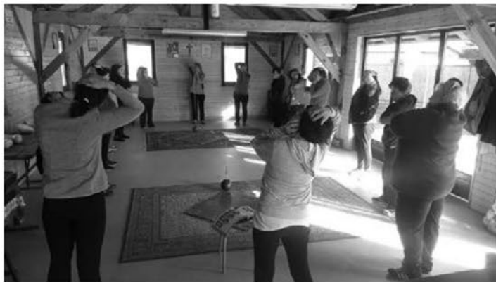
Skupino žensk na Selih smo zmotili pri razgibavanju.

Hajdinčankami, ki so Selankam dala prva znanja in nasvete, so jutra na Selih zdaj povsem drugačna. Za skupino žensk, ki se dobiva od ponedeljka do petka ob 8. uri, se jutro začne z nasmehom, dobro voljo in zdravjem. Tako bo ostalo tudi v prihodnje, v občini Videm pa jim bo prav gotovo sledila še kakšna skupina, saj dobri vzgledi vlečejo.