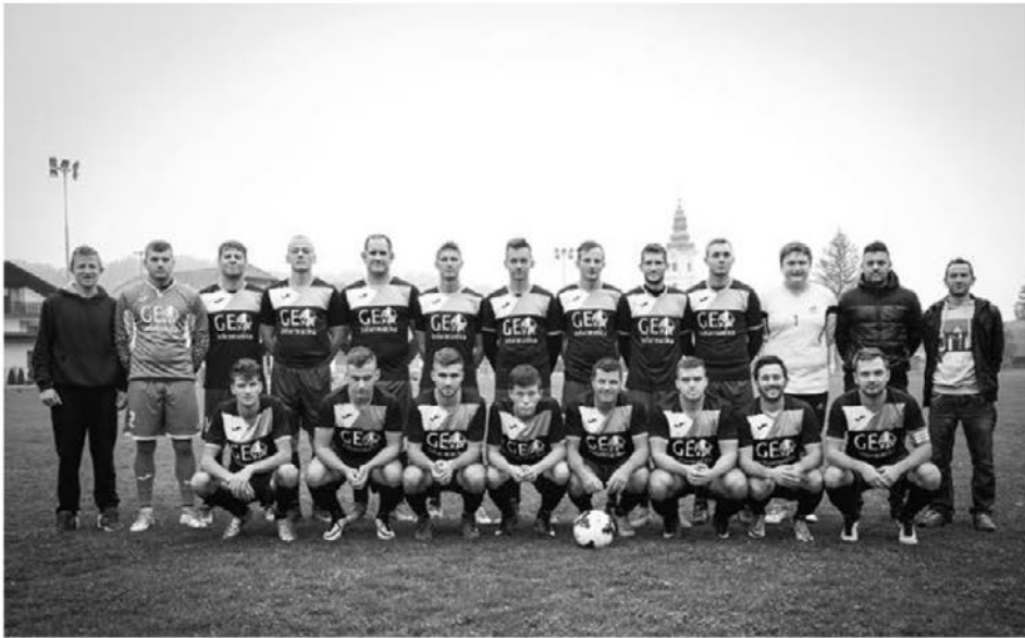
Članska ekipa Leskovca velja za zelo mlado.