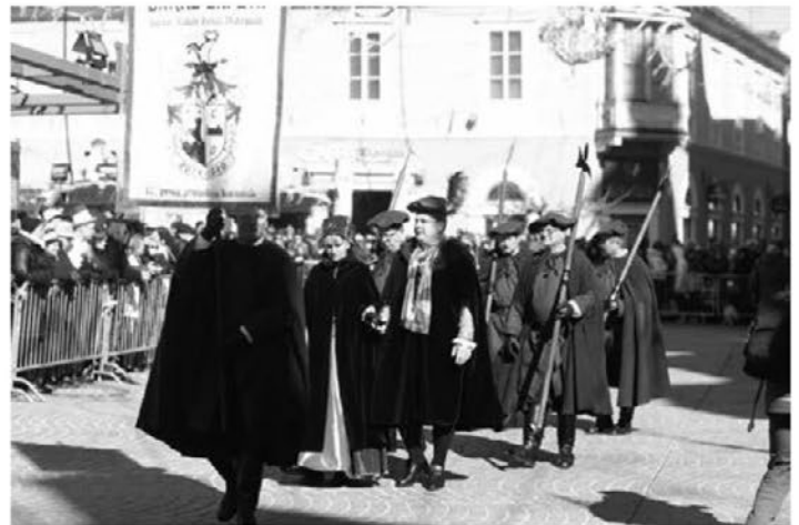
Princ karnevala na 59. Kurentovanju na Ptujju.