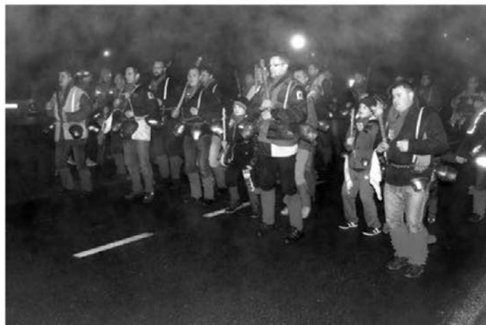
Korantov skok v Leskovcu in leskovski orači v letošnjem pustnem času.