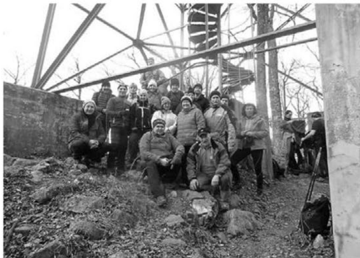
Planinci na Boču.

Kot že 11 let zapored smo se tudi letos podali na tradicionalni novoletni pohod na Boč. Kljub vetrovnemu dnevu se nas je zbrala lepa skupina pohodnikov, ki smo se s parkirišča v Poljčanah podali proti vrhu. Prehodili smo pot prek Balunjače in se z vrha spustili do koč, kjer smo imeli zaslužen postanek.