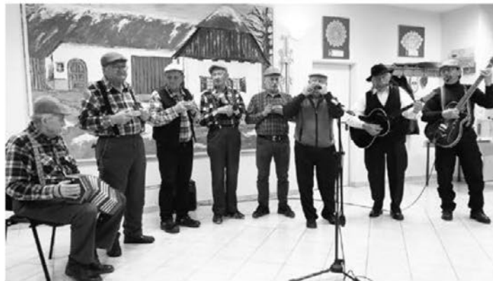
Halonga Potepuhi iz Cirkulan so zaigrali na ljudska glasbila, tudi orglice.