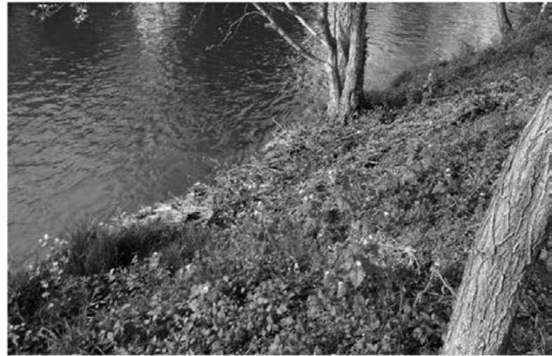
Rečna zarast, ki preprečuje onesnaževanje vodotoka.