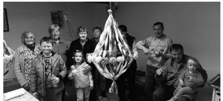
V Šturmovcih se vaščani družijo tudi v veselih pustnih dneh.

Vaščani smo se nekaj februarjskih popoldnevov zbirali na Petrovi domačiji, izdelovali rože iz krep papirja in duhe. Med izdelovanjem okrasja smo se tudi posladkali in okrepcali s sladicami, sveže pečeno ajdovo pogačo in s pijačo iz vaške kleti. Kot je videti, se ta običaj prenaša iz roda v rod, saj so otroci z velikim zanimanjem opazovali pisan papir in sodelovali pri izdelovanju. Duhe smo v času pustnega rajanja izobesili po vasi, da so prinesli še bolj tople dni, srečo in dobro letino. Pomlad je v vas prišla zgodaj in naj le tako ostane.