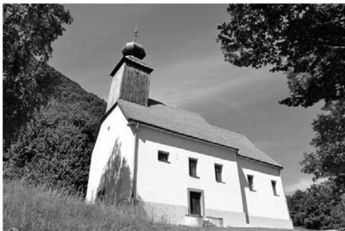
Cerkev sv. Donata na vrhu Donačke gore.

zelo lepo opremile sarkofag, v katerem so relikvije. To je tisto, kar želimo letos obnoviti in izpostaviti v javno čiščenje. Umetniki pravijo, da je to največja umetnina v naši cerkvi. To bo