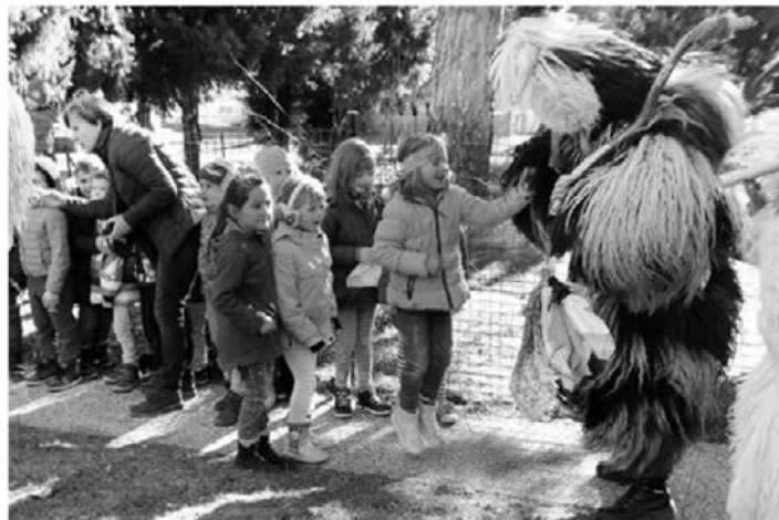
Tradicionalni obisk vrta v Slovenskih Konjicah.