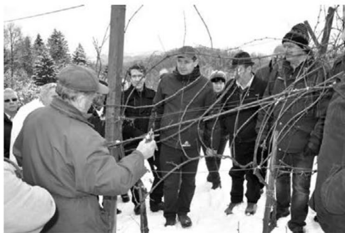
Druga vincekova rez v Halozah