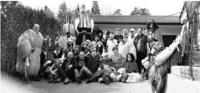
Leskovški orači in koranti na nastopu v Litiji.

Na pustno soboto smo orači iz ED Leskovec že trinajsto leto gostovali na karnevalu v Litiji. Tam smo vedno lepo sprejeti,