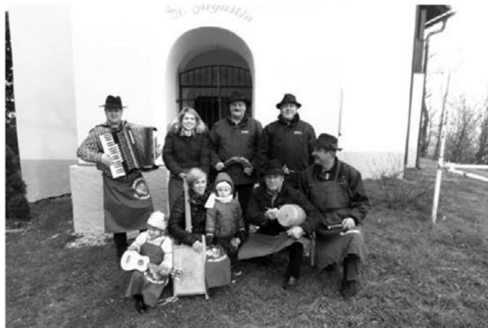
Leskovška skupina Šurc bo spet naredila presmece in poskrbela za pritrkovanje.