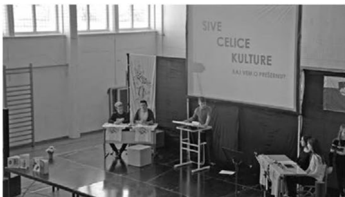
Ob dnevu kulture so na OŠ Videm pripravili prav posebno oddajo Sive celice kulture.