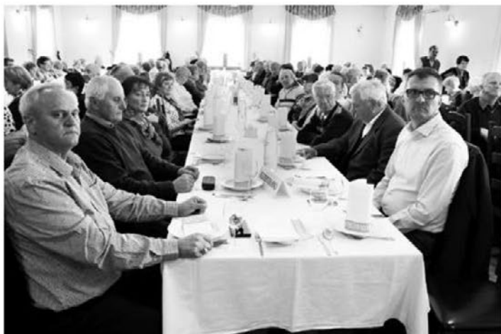
Udeleženci zбора z gosti

plačali članarino, se je pridružilo devet novih. Žal smo se lani poslovili od 25 članov. Pogrešali jih bomo.