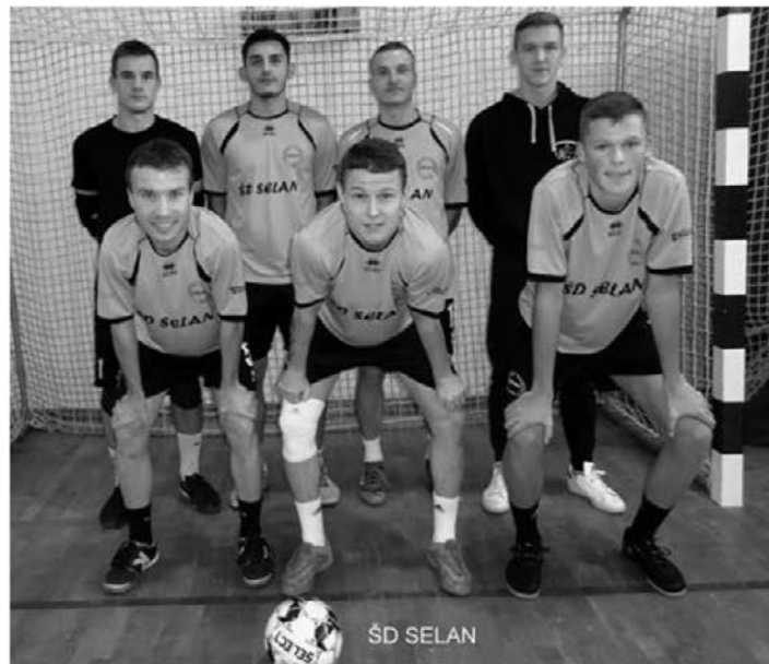
Novi uspehi za ekipo ŠD Selan.