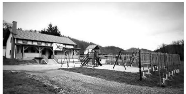
V KS Dolena nadaljujejo obnovo doma krajanov. Lani so dobili nove pridobitve v okolici doma.

Letošnje aktivnosti v KS so bile: 1. januarja novoletno srečanje krajanov, 26. januarja vaške kolone v izvedbi ŠD Zg. Pristava in aktivna žena, 2. februarja smučarski izlet v Avstrijo v izvedbi