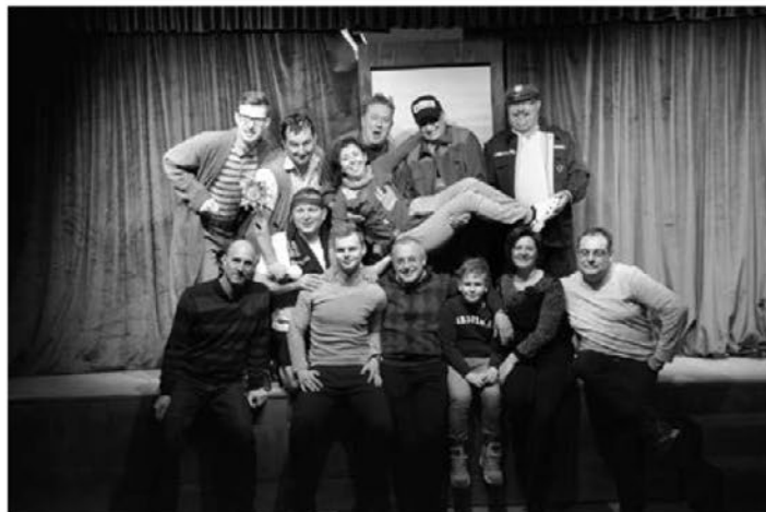
Gledališka ekipa KD Videm je za jubilejno uprizoritev izbrala komedijo Ne šlataj – 220 V.