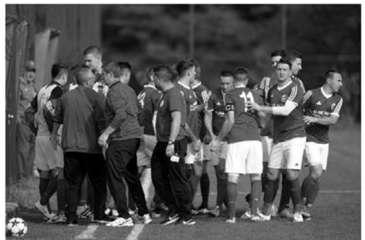
V Tržcu upajo, da bo tovrstnih prizorov veliko tudi spomladi.