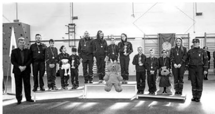
Mladi gasilci iz PGD Sela znova na stopničkih.