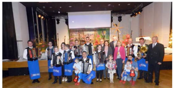
Veselo na jožefovo 2019 v fototrunkih