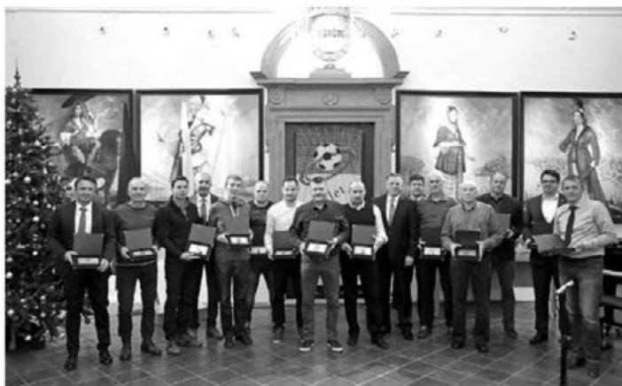
Nagrajenci ob jubileju MNZ Ptuj.