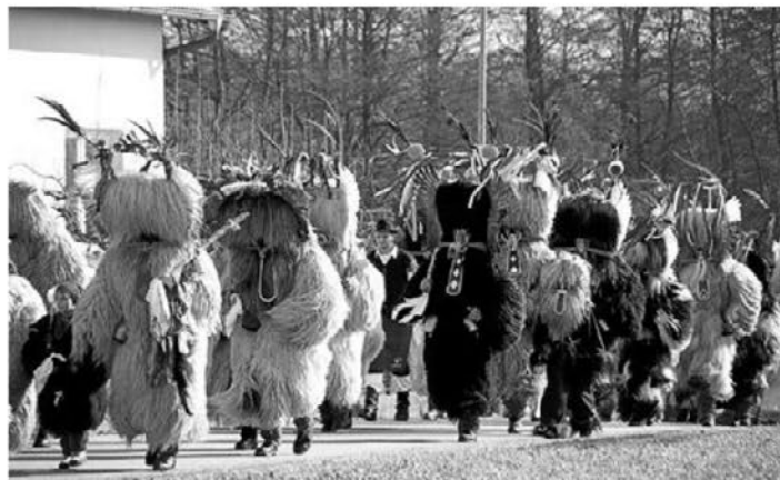
Korantov tek 2019

Posebno čast je korantom in pokačem izkazal tudi letošnji 17.