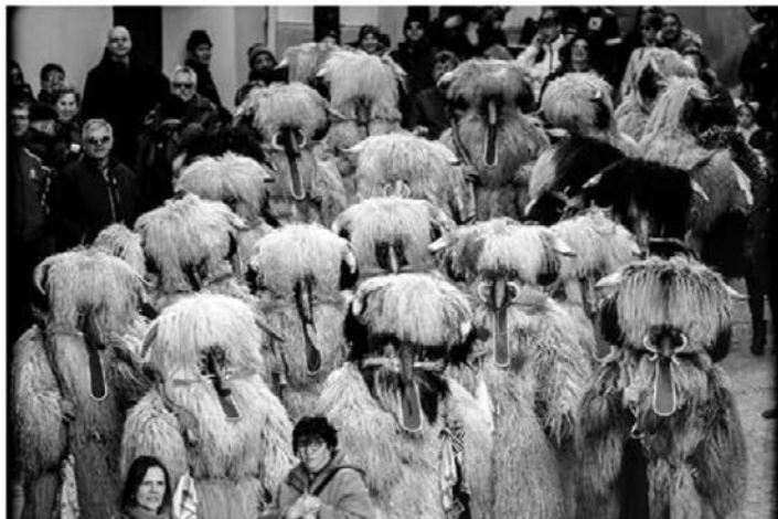
Rocca Grimalda.