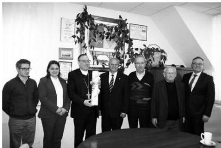
Dobrodošlica za nadškofa Alojzija Cvikla v prostorih občine Videm