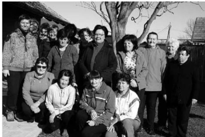
Še skupinski posnetek vseh sodelujočih na jutranji telovadbi ob Polskavi

Društvo Šola zdravja je ustanovljeno z namenom širjenja