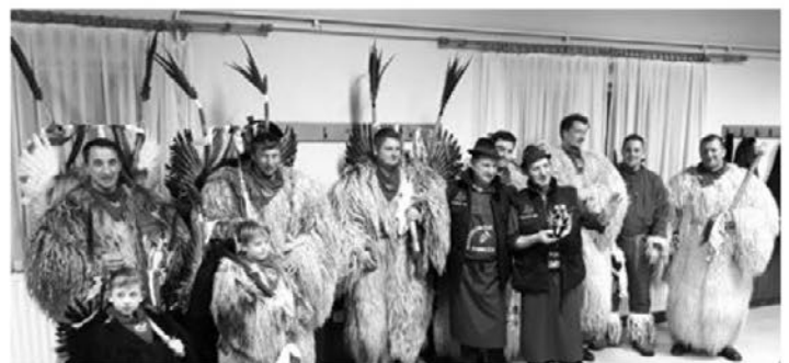
Na pobreškem pretoku vina so se oglasili tudi pobreški koranti.

Krajanji, ki se udeležijo tega dogodka, v zameno kletarjema podarijo kakšno domačo klobaso. Kasneje kletarja ob obisku krajanov v kleti k dobri kapljici tudi kaj narežeta. Ker je dogajanje potekalo po svečnici, so vse prisotne obiskali tudi