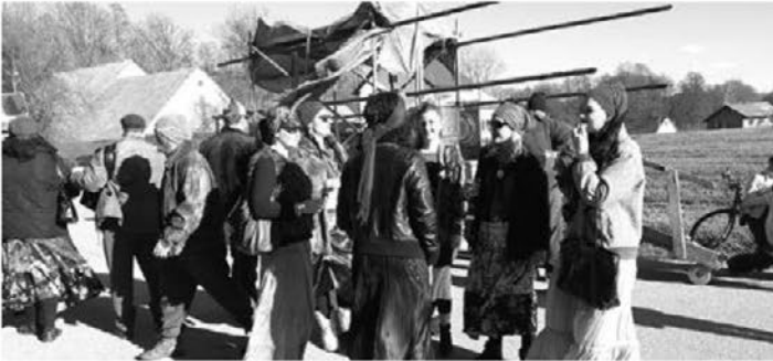
Letošnja fašenska utrinka iz Pobrežja

Zadnji dan pustovanja in fašenskih vragolij si nekateri Pobrežani, ki jim ni vseeno za tradicijo, privoščijo sprehod skozi vas. Tudi letos je bilo tako, saj so se pobreški cigani, pokači, koranti in kletarji podali v lepem, sončnem vremenu na pot od podjetja Sveča do vaškega doma. Že na začetku poti so pri