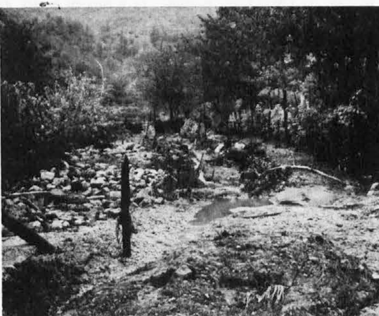
Pobesnele vode so prestopile bregove in poplavile več področij furlanske ravnine. Tudi tu je škoda ogromna, ker je voda odnesla na tisoče glav goveje živine in perutnine