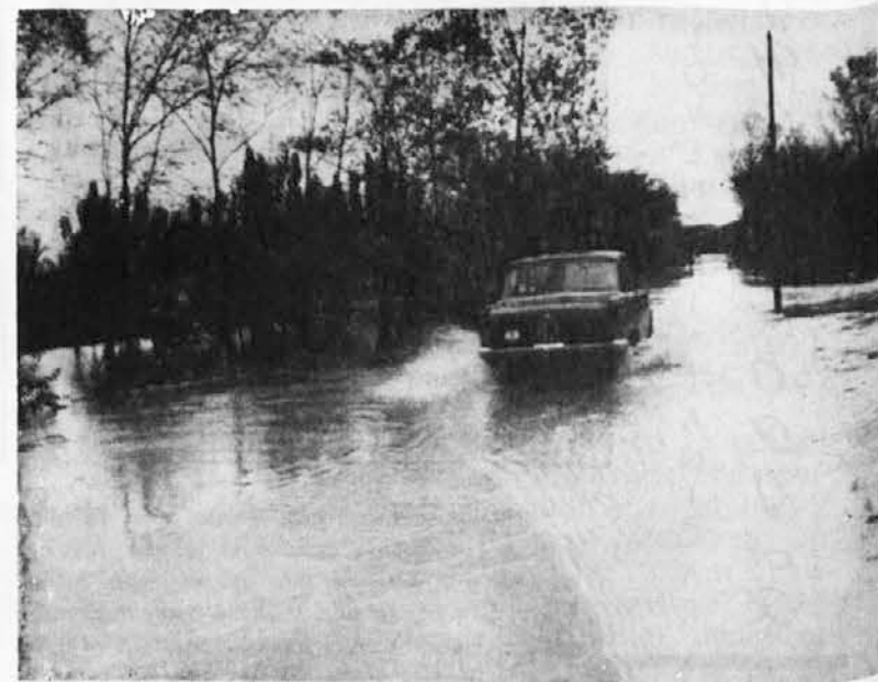
Una delle tantissime macchine sorprese dall'alluvione e trascinate dall'impetuosa corrente.

E non bisogna dimenticare le strade poderali, anche queste più che necessarie allo sviluppo economico locale e generale, che si trovano pur esse, quasi dappertutto, in u-