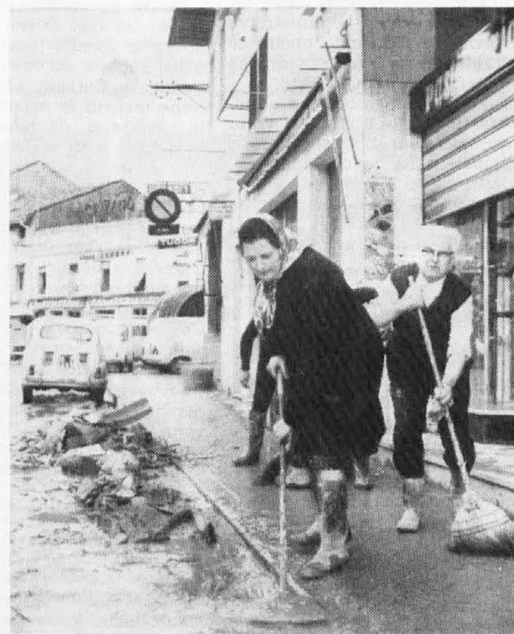
Latisano je poplavila reka Tilment kar dvakrat v enem letu. Na sliki vidimo kako čistijo ceste, ki so na debelo pokrite z blatom in drugo nesnago.