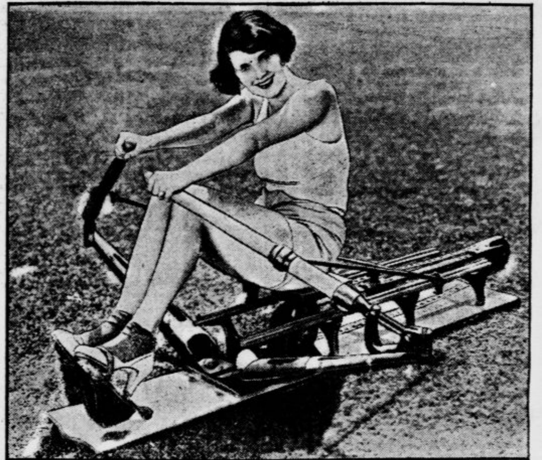
Zdravje na solncu in svežem zraku. Najnovejši telovadni aparat je stroj za veslanje na kopnem.