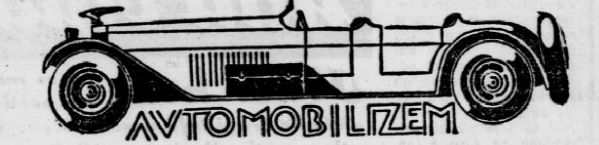
Tečajni deli rubrike urejajo avtomobilski oddelček Vasum Oil Company. d. d.