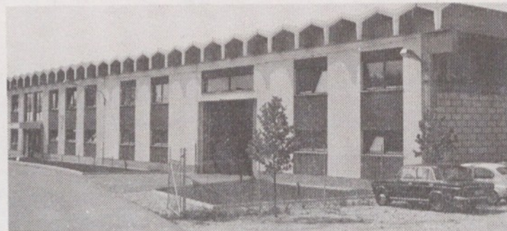
TOZD Sinoles, Ivančna gorica.