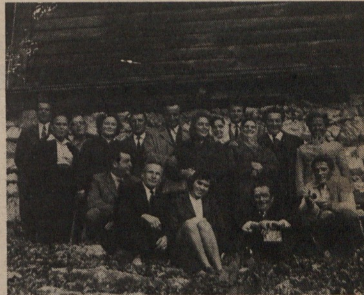
Predsedniki in tajniki krajevnih organizacij SZDL ter nekateri člani izvršnega odbora obč. komiteja SZDL naše občine pred partizansko tiskarno Slovenija na Vojskem