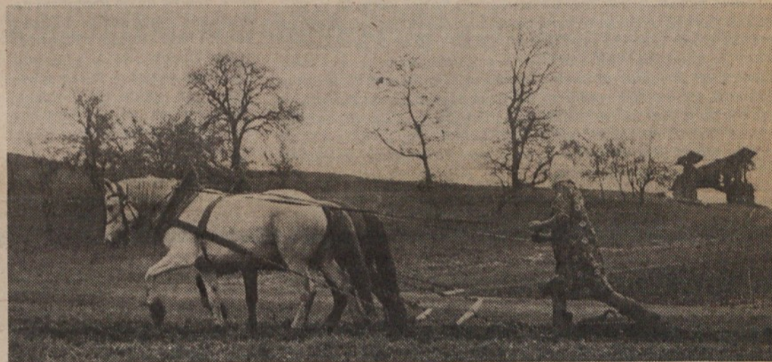
Zdravstveno in socialno zavarovanje kmetov je pereč problem naše družbe, zlasti še, ker se iz leta v leto vse bolj zaostrojuje. O tej problematiki je uredništvo Naše komune pripravilo razgovor za okroglo mizo. Objavljamo ga na zadnji strani