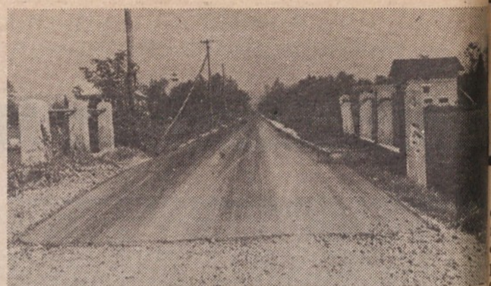
ČRNA JEZA V ČRNI VASI – SAMO 800 M ČRNEGA ASFA TA

Po kosilu v znamenitih »Nebesih« (na mizi so bili še bolj sloviti idrijski žlikrofi) je posebej za težko pot na Vojsko prirejeni avtobus odpeljal dobro razpoloženo skupino do rudarskega doma. Od tu so najbolj vneti nadaljevali pot proti tiskarni »Slovenija«. Tega imenitnega partizanskega spomenika ni mogoče do- seči brez precejšnjega navora, toda doživetje spomenika napor bogato poplača. Tako so doživeli najbolj