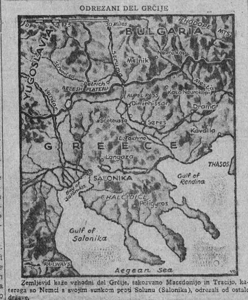
Zemljevid kaže vzhodni del Grčije, takoravno Makedonijo in Tracijo, katero so Nemci s svojim sunkom proti Solunu (Salonika), odrezali od ostale države.