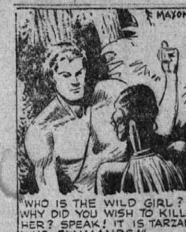
"WHO IS THE WILD GIRL? WHY DID YOU WISH TO KILL HER? SPEAK! IT IS TARZAN WHO COMMANDS!"