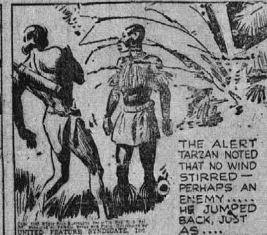
"THE ALERT TARZAN NOTED THAT NO WIND STIRRED — PERHAPS AN ENEMY... HE JUMPED BACK JUST AS..."