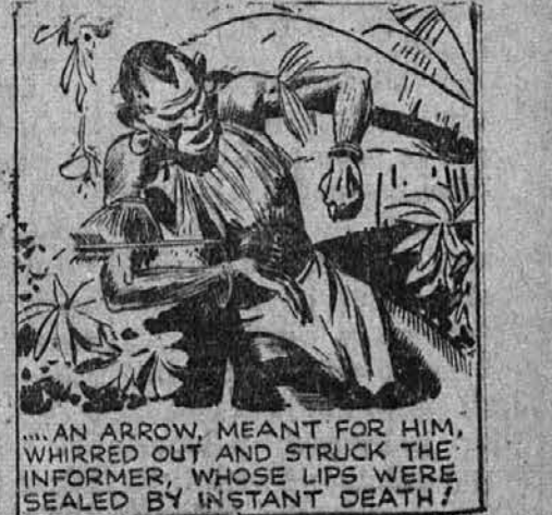
"...AN ARROW, MEANT FOR HIM, WHIRLED OUT AND STRUCK THE INFORMER, WHOSE LIPS WERE SEALED BY INSTANT DEATH!"

"Kdo je divja deklica? Zakaj si jo hotel ubiti? Govori! Tarzan ukazuje."