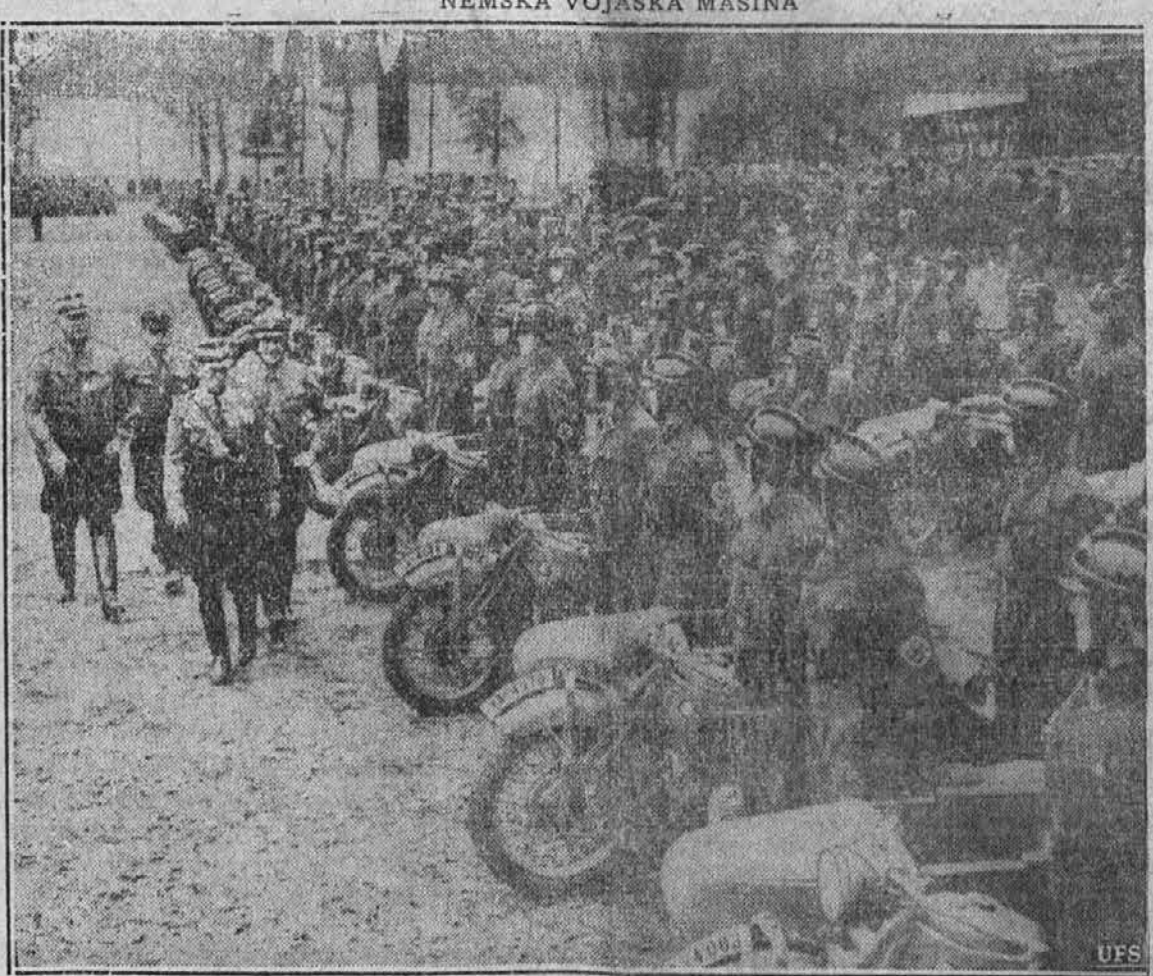
Oddelček nemških motoriziranih čet, ko jih inšpicira neki general. Take in podobne čete izvajajo prodiranje preko Balkana.

bo v obeh državah še kaj svobodne zemlje, tako dolgo bodo delali nova letala. Vprašanje pa je, če bodo imeli ves čas in v istem obsegu tudi dovolj pilotov. Veliko vprašanje je, ali bo mogoče imeti vedno dovolj človeškega materiala, dovolj smelih mož letalcev, teh pravih in največjih junakov moderne vojske, katerih življenje visoko gori v zraku je odvisno od majhnega ventilčka na letalu... Dovolj je tovarn, ki vsak dan izdelajo vsaj po eno letalo. Ni pa nobene šole za pilote, iz katere bi prišel vsak dan en pilot, izvidnik, mehanik, strelec. Ne moremo reči, da je angleški pilot boljši od nemškega ali obratno. Morda pa lahko rečemo, da so izgube te ali one strani večje, kar zavisi od tega, kje je več bojev. Če so zračni boji nad angleškim ozemljem, imajo zelo verjetno večje izgube nemški letalci, ker se angleški sestreljeni letalci, če se rešijo s padalom, spet lahko bore na novih le-