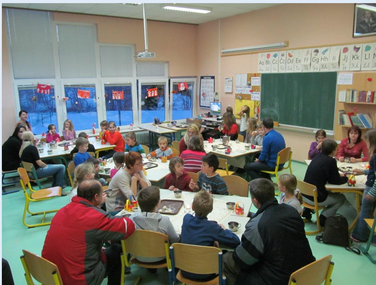
Delavnice s starši