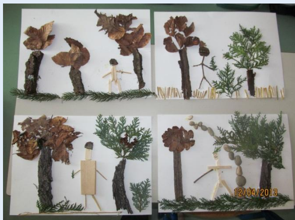
Sodelovali smo na natečajih