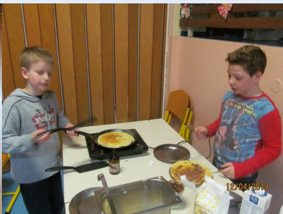
Pekli smo palačinke