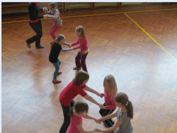
Se učimo plesati