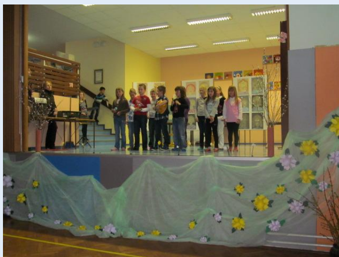
Proslava ob materinskem dnevu