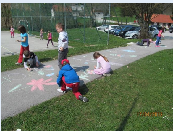
Pred šolo v času podaljšanega bivanja