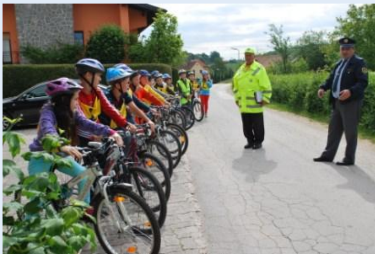
Kolesarski izpit 5. Razred