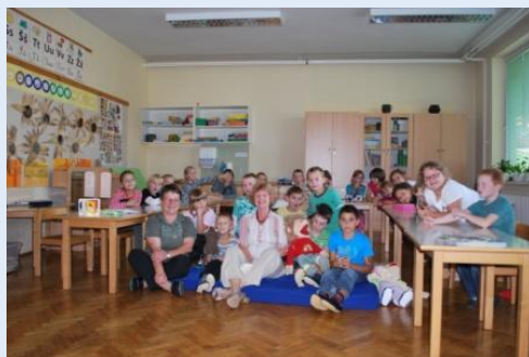
Potujem s pravljico