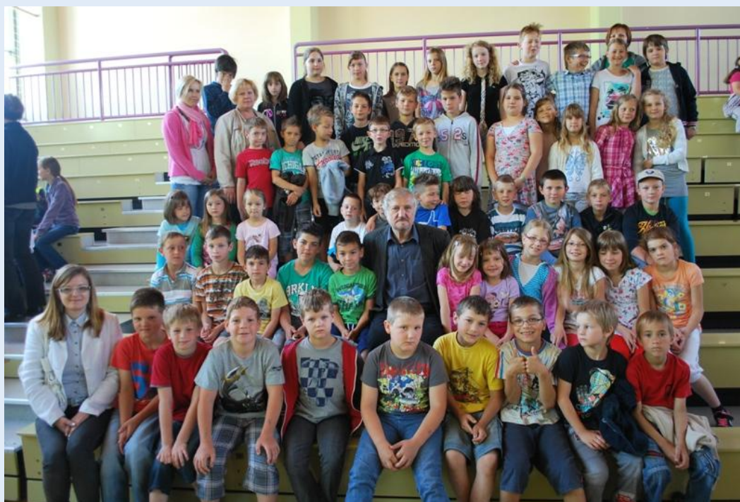
Zaključek bralne značke