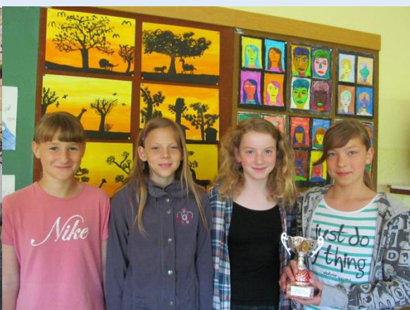
Petošolke s pokalom