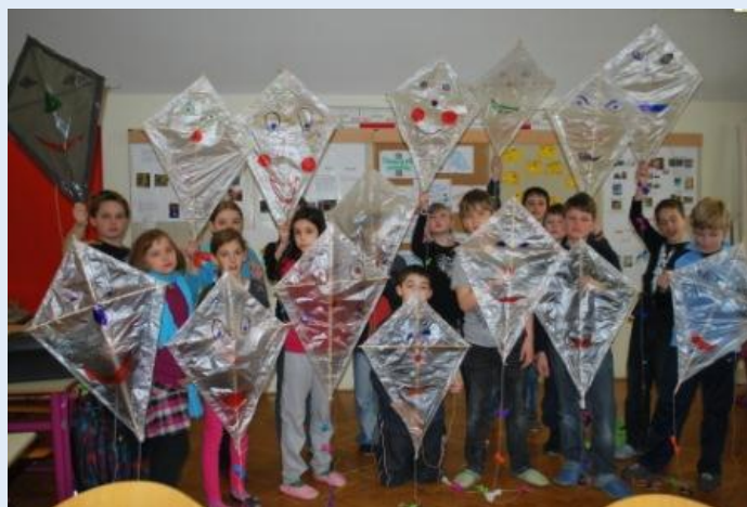
Tehniški dan 5. razred