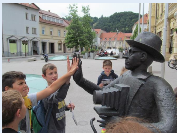
Z vlakom do Celja