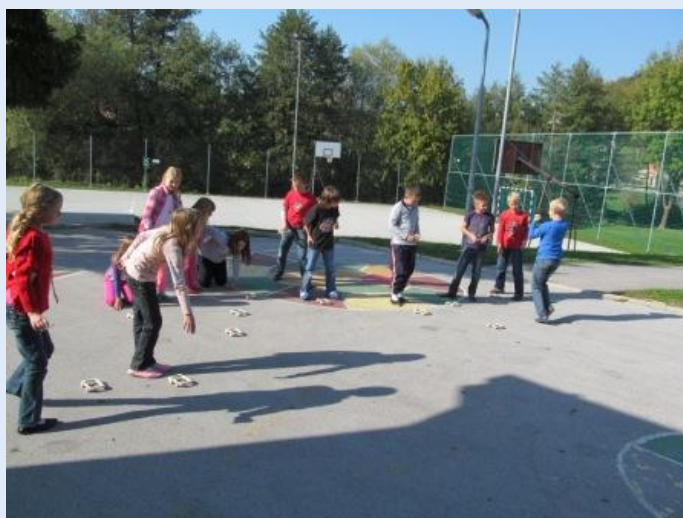
Tehniški dan – vozilo