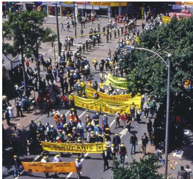
Slika 3: Demonstracije na ulicah južnoameriških mest so del vsakdana. Ljudje si želijo ohranitev socialne varnosti in zmanjšanje naraščajočih socialnih razlik, pogosto pa protestirajo tudi proti korupciji, vmešavanju Združenih držav Amerike in večnacionalnih družb v notranje politike svojih držav.

Gverilski poveljniki se branijo, da ne želijo potisniti kmetov v lakoto z uničenjem nasadov koke. Prav tako se branijo etičnih zadržkov, saj naj bi ravno kokainska mafija financirala paravojaške organizacije, gverilske skupine pa se vsaj borijo za gospodarski in zlasti socialni napredek revnejših slojev (5). Kmetje se čutijo kriminalizirani, saj jih država vidi kot proizvajalce koke in privrčence gverilcev. Letalsko škropljenje in pomanjkanje družbeno-gospodarskih investicij netijo protivladna čustva, zlasti na območjih pod nadzorom gverilcev.