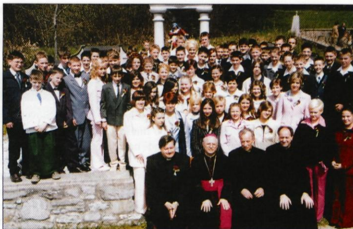
Letošnji birmanci na Brdu

S čim pa slovenski kristjan lahko prispeva k tej evropski ureditvi? Poudaril je troje: številčnost, saj brez biološke vitalnosti, volje do življenja, ni prihodnosti; skrbeti je potrebno za kulturo, saj je nihče noče in je ne bo hotel spreminjati ter kot tretje vero v Boga, zavedanje, da smo Cerkev vsi, ker Cerkev podpira življenje. Drugi del je bil namenjen pogovoru, ki ga je vodil gospod Bartolj, moderator na Radiu Ognjišče. Dotaknila sta se aktualnih tem: mediji, upadanje opredeljevanja za kristjane, družinske politike, šolstva. Z vprašanji in lastnimi opažanji so aktivno sodelovali tudi poslušalci v dvorani. ↳ Marta Keržan