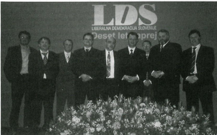
V Festivalni dvorani na Bledu je ob 10-letnici LDS-a v Sloveniji nastala ta fotografija.