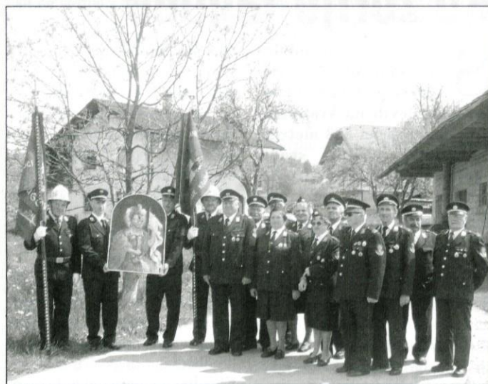
Člani PGD Lukovica s svojim zavetnikom

4. maja goduje zavetnik gasilcev sveti Florjan. V počastitev zavetnika so po vsej Sloveniji organizirani številni zbori gasilcev. Eden takšnih se je v organizaciji PGD Lukovica že enajstič odvijal v nedeljo, 2. maja, v podružnični cerkvi sv. Luka v Spodnjih Praprečah. Daritve svete maše v čast gasilcev se je udeležilo veliko število gasilcev iz prostovoljnih gasilskih društev Lukovica, Prevoje, Krašnja in Blagovica. Namen je bil zahvaliti in priporočiti se Bogu za varno opravljanje težkega dela. Letošnja slovesnost je bila od prejšnjih nekoliko slovesnejša, saj smo gasilci PGD Lukovica v dar dobili oljno sliko sv. Florjana. Sliko nam je podaril brdski župnik, za kar se mu še enkrat zahvaljujemo. Po končani sveti maši se je druženje pod kozolcem v prijetnem vzdušju nadaljevalo še dolgo po poldnevu.