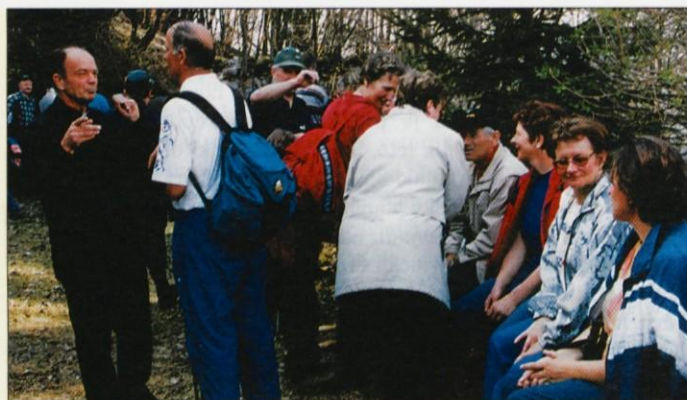
Na velikonočni ponedeljek je bilo na Golčaju veliko planincev.