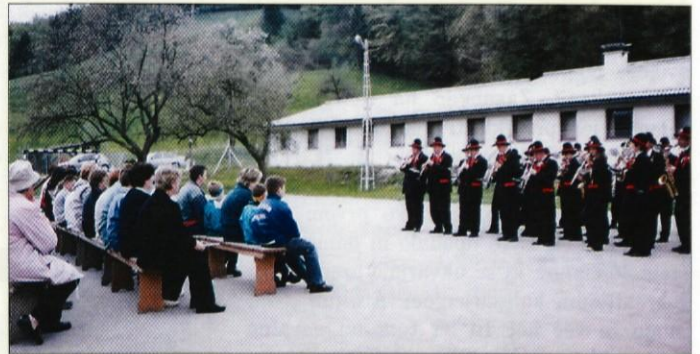
Nastop lukoviških godbenikov na igrišču v Blagovici