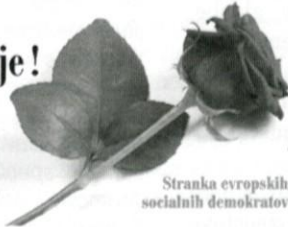
Stranka evropskih socialnih demokratov