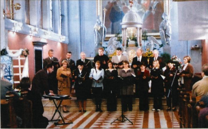
Cerkveni mešani pevski zbor župnije Brdo

V zadnjem aprilskem popoldnevu je potekala Revija cerkvenih pevskih zborov v Domžalah. Zbrala se je večina cerkvenih zborov in skupin, ki delujejo v domžalski dekaniji.