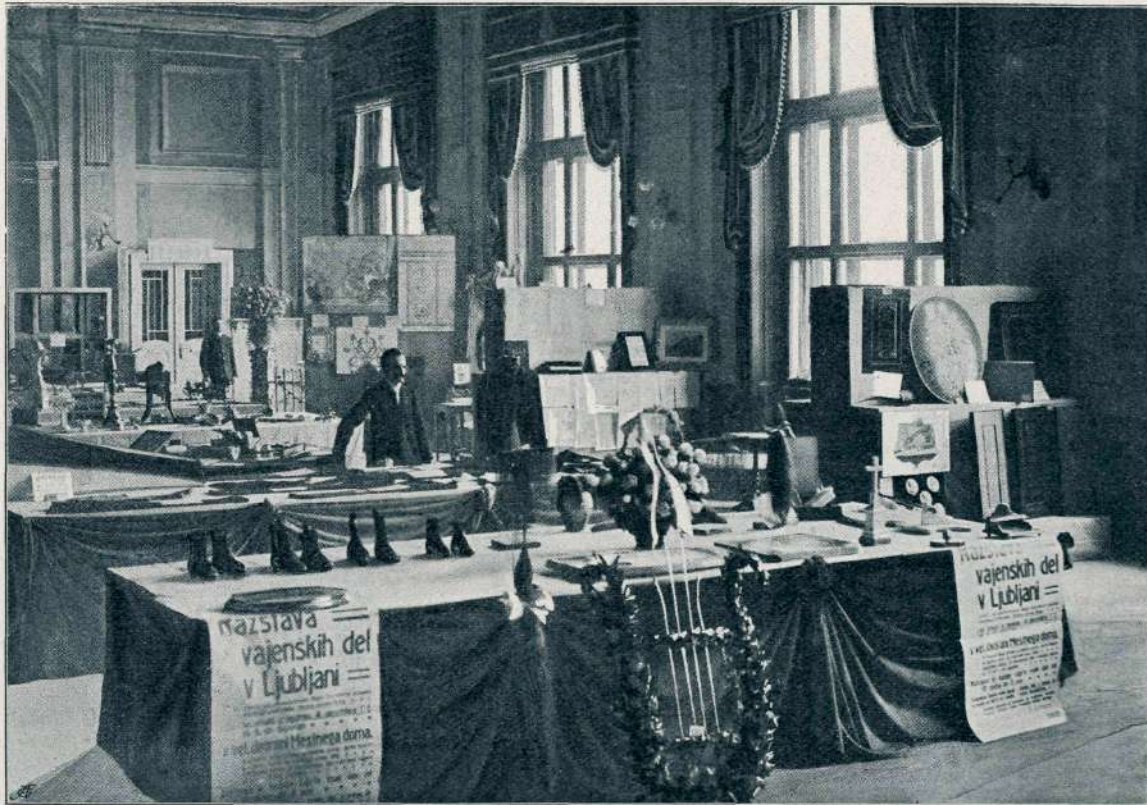
RAZSTAVA VAJENŠKIH DEL V LJUBLJANI.