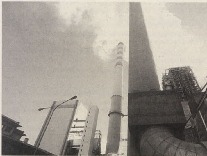
Čistilna naprava na bloku 4 termoelektrarne Šoštanj – manjši dimni stolp v sredini

Slovenski minister za gospodarske dejavnosti dr. Maks Tajnikar je poudaril pomen TE Šoštanj pri Velenju, ki je ena izmed ključnih slovenskih elektroenergetskih objektov, saj proizvajajo skoraj tretjino celotne slovenske električne energije. TE Šoštanj pa je pomembna tudi zato, ker električno energijo proizvaja iz domačega energetskega vira, iz rudnika lignita Velenje. Ob izrednem