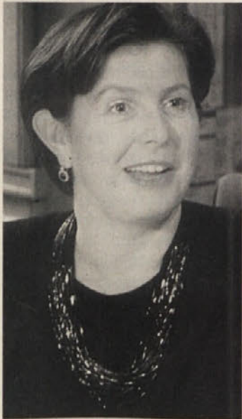
»Ta gospod je nasploh nekako čuden«

Ostaniva še pri gospodu Smolleju, ki je napovedal, da bo njegova manjšinska politika politika pozitivne diskriminacije. Kaj rečete k temu?