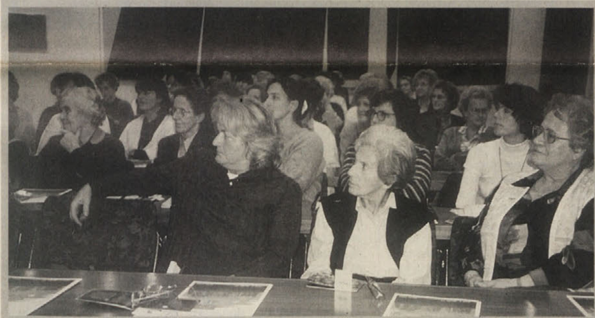
Zveza slovenskih žena je tudi letos priredila seminar na aktualno temo. V letu strpnosti ali tolerance so se ženske ukvarjale z vsemi mogočimi oblikami nestrpnosti začevši v družini in v širši družbi. Okoli 60 jih je bilo na seminarju, zanimanje raste iz leta v leto. Več na strani 4.

V torek so predstavniki krajevnih trinajstih iniciativ, ki so se povezale v deželno platformo za krajevno čiščenje odpadkov seznanili javnost o svojih načrtih. Zastopniki so odločno odklonili odredbo deželne vlade o ponikanju (Versickerungserlass). V primeru, da te odredbe ne bodo razveljavili so napovedali demonstracije in pritožbo na vrhovno sodišče. Ugotovili so, da velekanalizacije podpirajo predvsem velike stranke in gradbeni lobiji ter načrtovalci. Na osnovi raznih študij in izkušenj v drugih avstrijskih deželah o krajevnih rastlinskih čistilnih napravah so predstavniki iniciativ izračunali, da so stroški za take naprave znatno nižji, vrhu tega pa je čiščenje okolju primernejše, ker očiščena ostane voda v kraju samem. Poleg tega so male naprave povsod tam, kjer so možne (ne nasprotujejo pa velikim kanalom v mestih), bolj prilagodljive in ekonomične kot pa centralni podeželski kanali. Več prihodnjč. m. š.