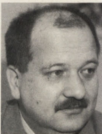
Piše dr. Marjan Sturm

manjšine podprl tudi ljudsko stranko ali Liberalni forum, kak glas pa bo zašel tudi k svobodnjakom. Prav v tem namreč pride do izraza pluralizem političnih mnenj znotraj manjšine.