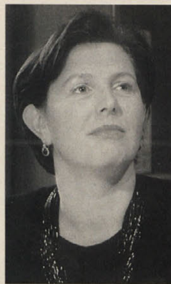
»Ker imam v politiki še dovolj ciljev, bom v njej ostala«

Zeleni smo v državnem zboru predlagali model, kako bi diskusijo o kvoti žensk končali. In sicer naj bi bila javna podpo-