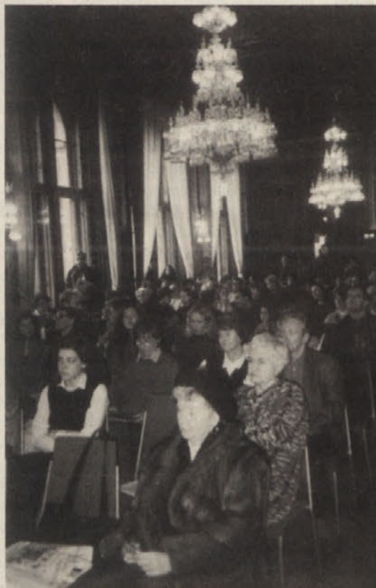
Množica obiskovalcev na Dravini predstavitvi

Založba Drava je ob literarni matineji na Dunaju pokazala široko ponudbo kvalitetnih knjig v slovenščini in nemščini. Potrdilo za zanimivo predstavitev knjig so dali poslušalci sami (okrog 300), ko so ob koncu predstavitev kupovali knjige, ker se jim je očitno zahotelo branja.