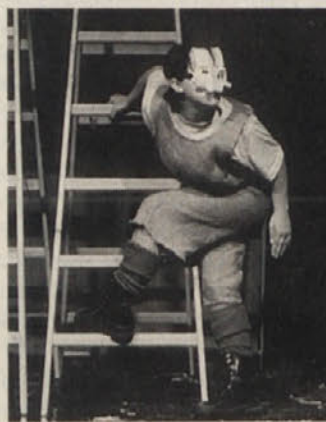
Gledališka skupina HAK Celovec