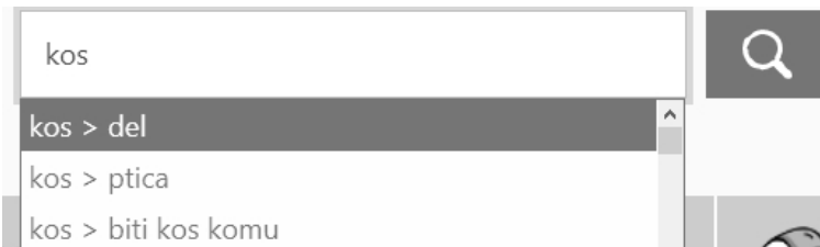
Slika 2: Prikaz indikatorjev na spustnem seznamu za razlikovanje med tremi homografi kos v beta različici portala Franček

Na portalu Franček so torej indikatorji uporabljeni za razločevanje med homografi, ne pa za razlikovanje med pomeni večpomenskih iztočnic. Glede na vsebino lahko indikatorje na portalu Franček razvrstimo v tri skupine, ki so po prioriteti razvrščeni takole: