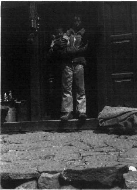
Moškega iz vzhodne tibetanske pokrajine Kham je mogoče prepoznati po značilnih rdečih spleth v laseh; moški na fotografiji je begunec iz Tibeta in zdaj živi v nepalskem kraju Namče bazar