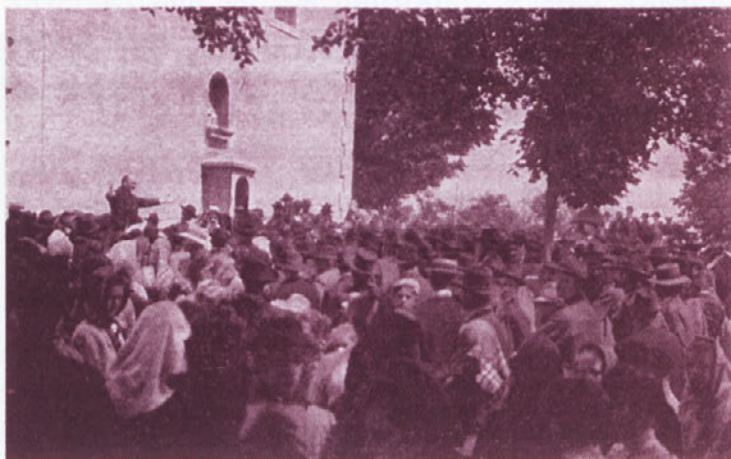
Fotografija je bila objavljena v Mladiki leta 1924.