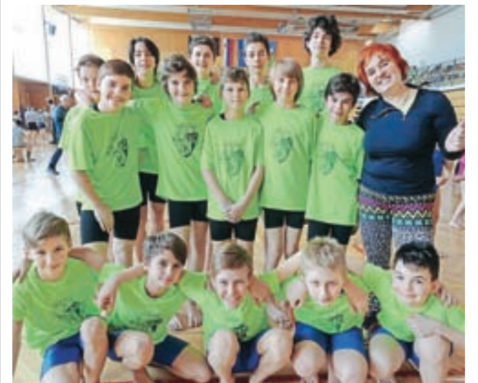
Učenci OŠ Frana Albrehta, udeleženci polfinalnega šolskega državnega tekmovanja v skokih na mali prožni ponjavi, skupaj z mentorico

Finalno državno tekmovanje bo 29. marca v Brežicah. Držimo pesti za naše.