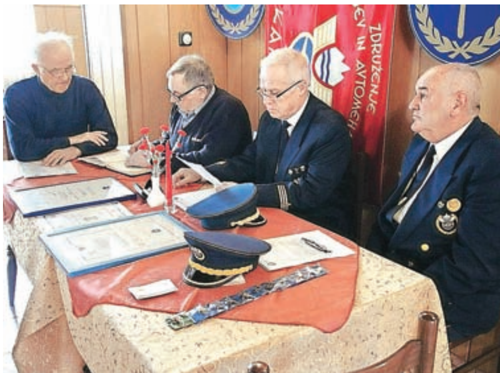
Člani Združenja šoferjev in avtomehanicov Kamnik so z občnim zborom vstopili v enainšestdeseto leto delovanja.

Članom združenja se je za dolgoletno delo in vse aktivnosti, ki so usmerjene v večjo varnost v cestnem prometu, zahvalil župan Marjan Šarec in izrazil željo, da bi tudi v prihodnje lepo sodelovali. Pred neformalnim druženjem je župan podelil tudi enajst jubilejnih značk.