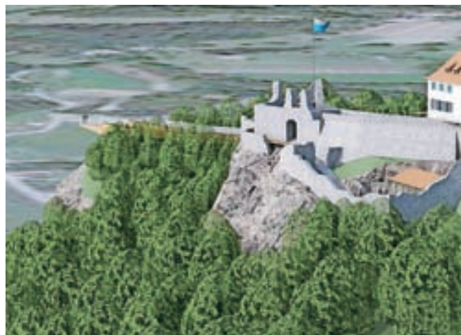
Lesena ploščad bo dolga približno petdeset metrov.

Razgledna ploščad bo postavljena na Mali Špici v neposredni bližini razvalin Starega gradu, usmerjena bo proti Triglavu, dolga pa bo toliko, da bo z nje moč videti tudi staro mestno jedro Kamnika.