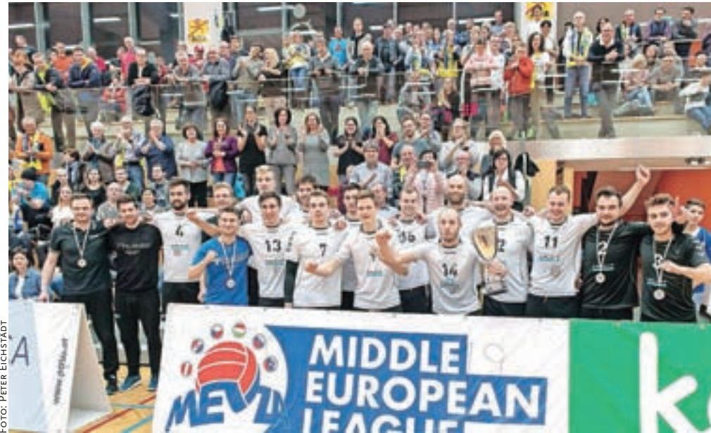
Odbojkarji si zaslužijo čestitke za največji uspeh kluba v srednjeevropski ligi.

»Po treh zaporednih porazih smo proti Ljubljancem bolj samozavestno vstopili v tekmo. Ob dobrem servisu smo dobro igrali tudi v drugih elementih igre. V finalu smo se sicer borili po svojih najboljših močeh, je pa res, da je bila na drugi strani izredno razpoložena domača ekipa. Poskušali smo vse, da bi prišli