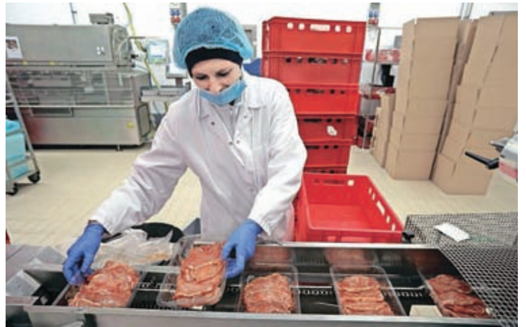
Nedavno so proizvodnjo posodobili z novo pakirno linijo.

projekt z objektom v središču mesta, staro klavnico na Usnjarski ulici, ki naj bi jo občina enkrat odkupila. V načrtu je sprostitev prostora, ozelečenje površin in parkirna hiša, ki bi pripomogla k reševanju problema pomanjkanja parkirnih mest. Kdaj bi do odkupa lahko prišlo, župan ni vedel povedati, saj občino prej čaka gradnja osnovne šole in več drugih projektov.