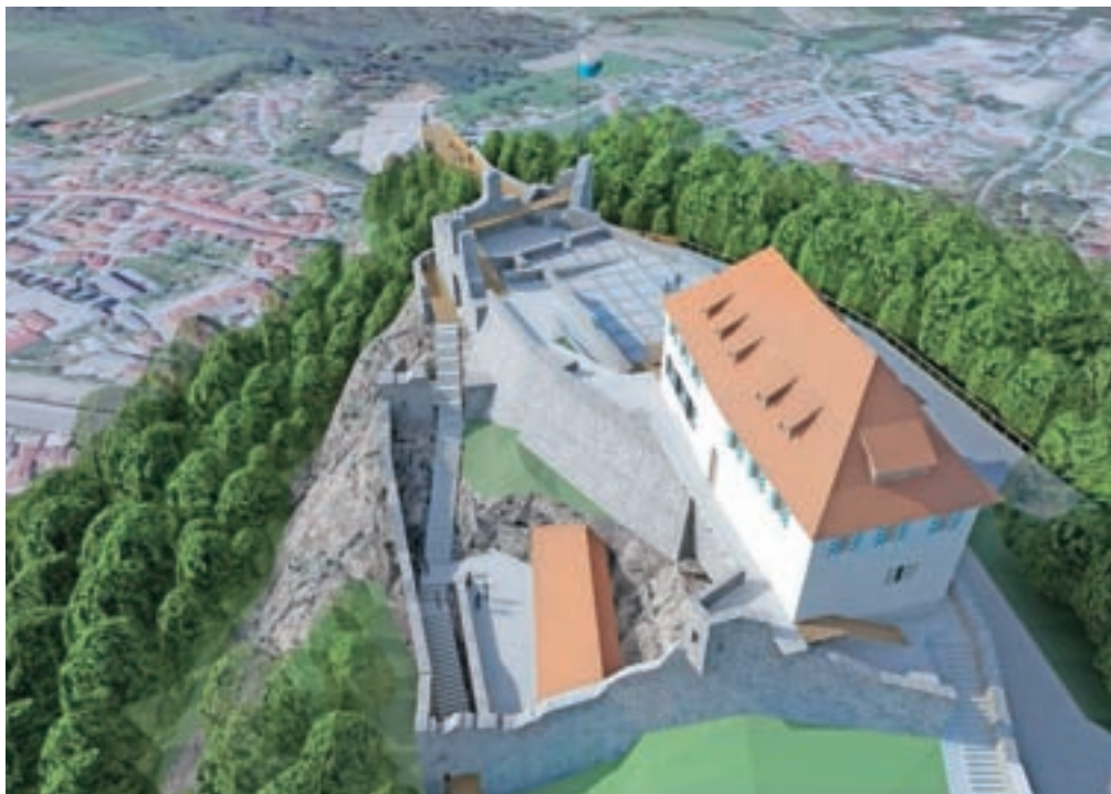
S Starega gradu je razgled že zdaj edinstven, z razgledne ploščadi pa bo še lepši.

Zamisel o atraktivni razgledni ploščadi sicer ni nova, saj se Kamničani lahko še spomnijo projekta prenove