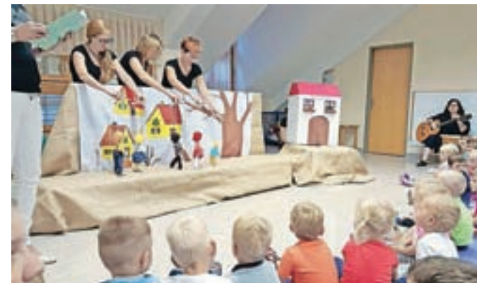
Strokovne delavke so otrokom in njihovim staršem zaigrale lutkovno predstavo.

Ob zaključku pettedenskega projekta so otroci uprizorili dramsko igro Muca Copatarica v naravnem okolju, na igrišču vrtca. Z veseljem so vadili dramsko igro in se življali v pravljicihne like. Ves trud, veselje in srečo smo želeli deliti s starši in ostalimi prijatelji v okviru enote ter jih povabili na predstavo. Vreme nam je bilo naklonjeno, za ozvočenje je poskrbela sodelavka Ines Keren in