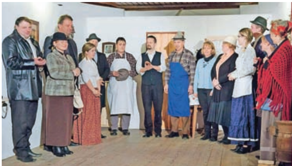
Veseloigra Trije vaški svetniki je nasmejala Selane.

Prikazana igra je vsebovala obilo humorja, komičnih zapletov in razpletov. Njen glavni namen je po besedah ustvarjalcev iz Športnega in kulturnega društva Sela zagotovo bil nasmejati in razvedriti zbrano občinstvo, kar jim je v enourni sproščeni predstavi zagotovo tudi uspelo.