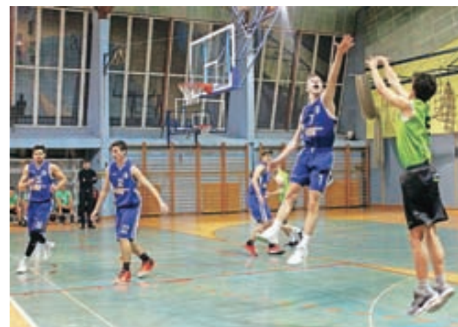
V zadnjih tekmah kamniški igralci kažejo veliko borbenost in podrejenost ekipi.