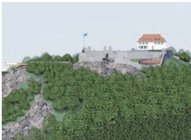
Razgledna ploščad že ima vsa potrebna dovoljenja.