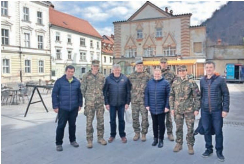
Predstavniki Calcita Bike Teama, Zavoda za turizem, šport in kulturo Kamnik in Slovenske vojske so s pripravami na dve veliki mednarodni tekmi, ki bosta sredi maja v Kamniku, za zdaj zadovoljni.