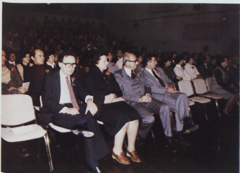
Naši gostje na svečani seji

Še posebej se želim zahvaliti in čestitati vsem tistim delavkam (nadaljevanje na 4. str.)