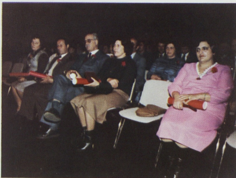
Dobitniki „Plaket DO KTL“

KTL do včeraj ni bila izvoznik in je bila orientirana izključno na domače tržišče. Preusmeritev na tuje tržišče je bila izredno zahtevna, ne samo zaradi sprememb programov in zahtevane kvalitete proizvodov, temveč tudi vsled nujnega spreminjanja miselnosti in organiziranosti znotraj kolektiva.