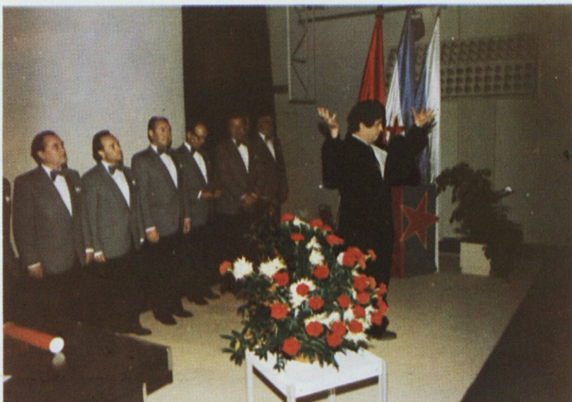
Kulturni program je bil prijeten

nih dohodkov od ustvarjenega dohodka ter oblikovati ustrežna merila in kriterije.