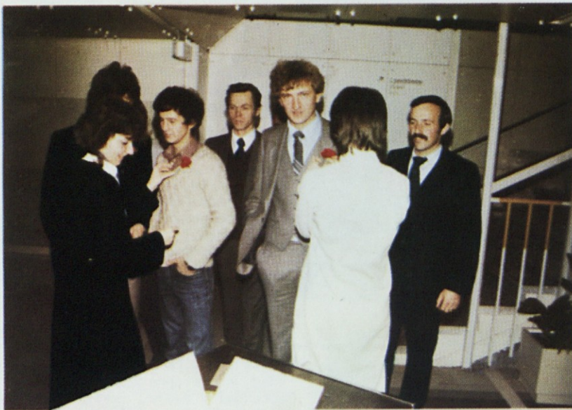
Rdeč nagelj in značko na prsa

izkoriščenost proizvodnih zmogljivosti in kadrov. V obdobju 1981 - 1985 bomo razširili sedanje ter osvojili nove proizvodne programe, temelječe na domačih surovinah. Zato bomo precejšnja sredstva namenili skozi sovlaganja na dohodkovni osnovi v razvoj surovinske osnove (papir, odpadni papir, celuloza, les itd.). In kot bistveno sestavino našega razvoja moramo omeniti nadaljna prizadevanja vseh delavcev KTL za razvijanje in poglobljanje samoupravnih in delegatskih odnosov ter vsestransko uveljavitev pravic in dolžnosti delavcev, da vplivajo in razpolagajo z rezul-