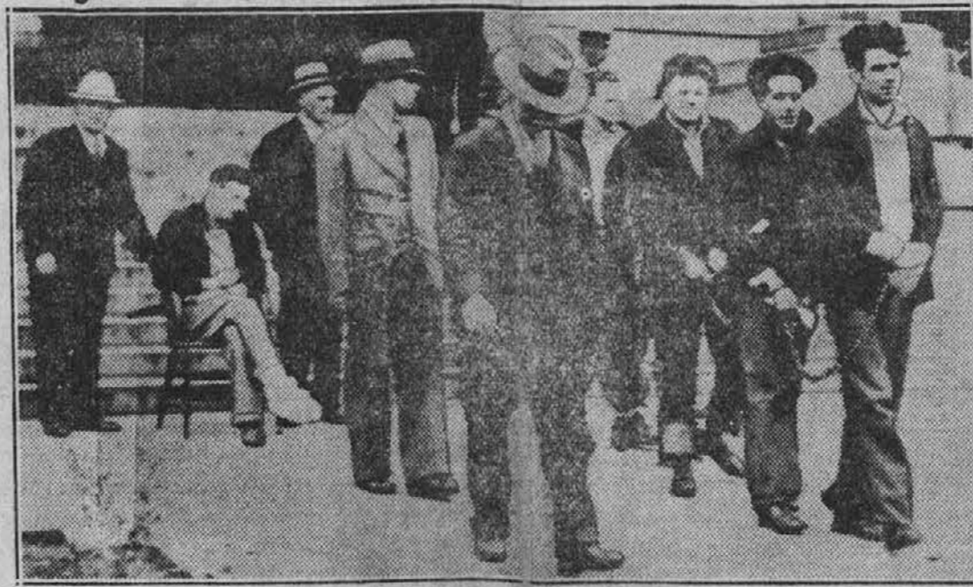
Šest kaznjencev iz državne jetnišnice Walla Walla, Wash., obtoženih umora prvega reda, ki so nedavno napravili poizkusen pobeg iz ječe. Pri izgredih je bil ubit eden čuvaj in sedem kaznjencev.