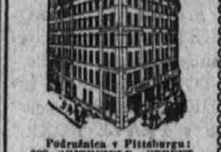
Podružnica v Pittsburghu: 600 SMITHFIELD STREET, PITTSBURGH, PA.