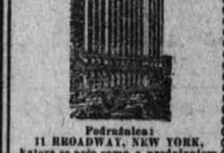
Podružnica: 11 BROADWAY, NEW YORK, katera se peče samo s prodajanjem denarja vseh svetovnih držav.