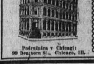
Podružnica v Chicagu: 99 DEARBORN ST., CHICAGO, ILL.