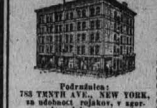
Podružnica: 783 TENTH AVE., NEW YORK, za udobnost rojakov, v agenciji delu mesta.