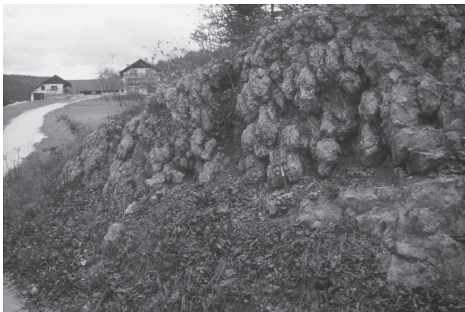
Sl. 4. Temnosiv dolomit s kroglasto krojivitvijo

17. Dolomit s kroglasto krojivitvijo : Tuvalske plasti na ozemlju Slovenije najpogosteje postopno prehajajo v glavni dolomit. Pri Oslici pa se med obema členoma v debelini 5 m pojavljata še dolomit s kroglasto krojivitvijo in temnosivi plastnati bituminozni dolomit, ki sta dogovorno uvrščena v bolj pisano julsko-tuvalsko formacijo. Dolomit, obravnavan v tej enoti, je temnosiv do siv-