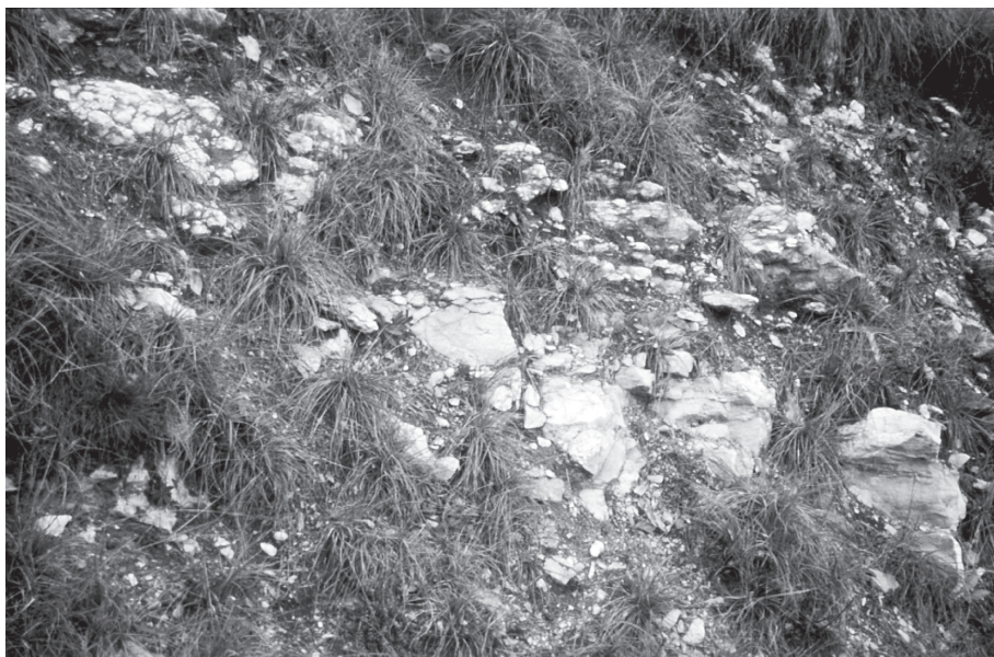
Sl. 3. Apnenčeva breča z vložki pisanih laporovcev

11. Menjavanje pisanih dolomitov in laporovcev : Ta litološka enota pričenja z 2,5 metra debelim intervalom ploščastega (5-15 cm)