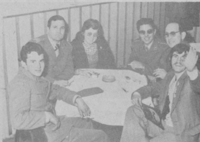
Delegacija ptujske mladine in garnizije tik pred sprejemom v restavraciji hotela Korotan