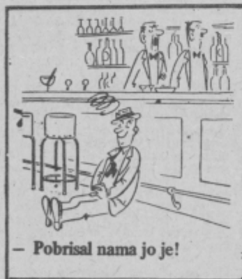
— Pobrisal nama jo je!

Podlehnik je vejki no še posebno zaj gdo ma novo šolo no cesto — zlo lepi kraj. Ti se samo obrni na krajevne no občinske funkcionore pa boš v toten kraj lahko čista zagvisno dobila parcelo za fvojo hišo no šiviljsko delavnico. Če boš mela pri ten kokšne težove, se obrni na mene, da mo ti še jas pomoga. Sivaja no flikaja boš mela zadosti, saj je v Halozah no Prlekiji še tejkjo lukenj, ki mo jih mogli začeti „flikati“. Veseli me, da se misliš že drugo leto vrnoli v rojstne Haloze. Gdo boš začela graditi hišico, me povobi, da ti priden pomogat udarniško delat. Lepo te pozdrovla Lujs.