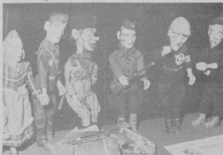
Na razstavi NOB so bile prav gotovo najzanimivejše originalne lutke — marjonete, s katerimi je nastopilo I. partizansko lutkovno gledališče.

Kako si uredimo hlev za govedo in prašiče po sodobnih načelih; predavanje bo ob 18. uri v osnovni šoli Sela.