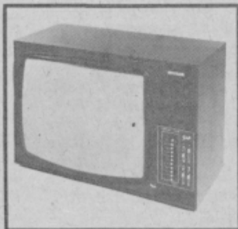
Barvni televizor Iskra PANORAMA 73: v sodobni polvodniški tehniki s tranzistorji in integriranimi vezji na tiskani enoti, VHF in UHF kanalnik, ekran 67 cm