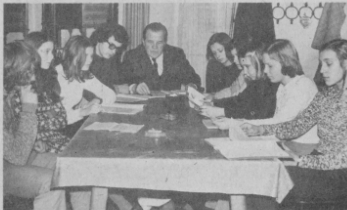
Vaja za Čitro

Ardzuna spregovori o domu. Čitra, ki tudi hrepeni po njem, saj bi utrdil in za zmeraj zvezal njuno razmerje, se žalostna zave lažnivosti svoje