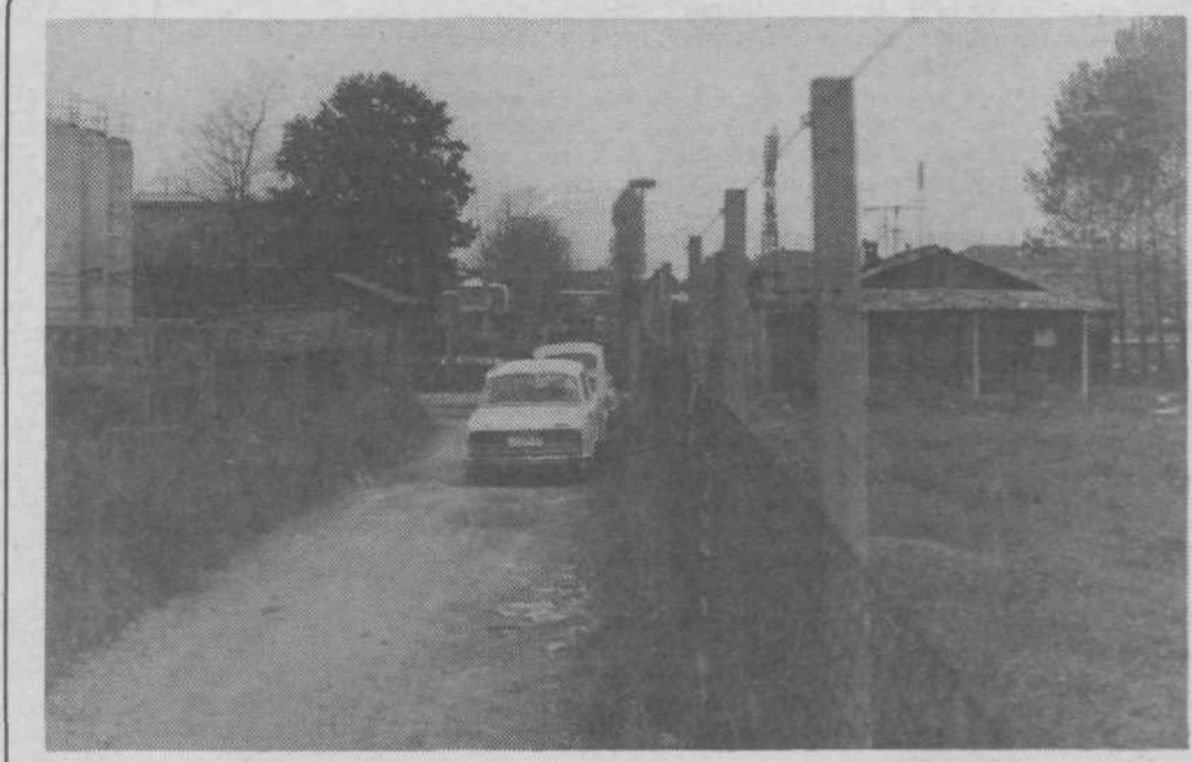
Obkrožena s tremi delovnimi organizacijami in stisnjena med njihove že načete ograje stoji še vedno naseljena baraka. Tod ne bi bilo prehoda, če nje ne bi bilo, ne bi bilo morda toliko prehodov čez ograje kot jih je zdaj. Družbena lastnina bi bila manj ogrožena. Potrebno pa bi bilo le malo sodelovanja

S takim ravnanjem pa hromimo tudi razvoj tistih vrednot,