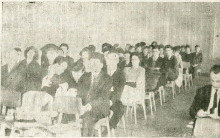
Letna konferenca kamniške mladine

mlade generacije, saj se je učni uspeh povsod izboljšal. Dne 16. oktobra je Okrajni komite Zveze mladine Slovenije v prostorih Doma družbenih organizacij v Ljubljani na svečani seji podelil nagrade in priznanja najboljšim šolam. Med 38 srednjimi šolami je kamniška gimnazija dosegla drugo mesto — prva je bila Škofja Loka —, kar je za najvišji prosvetni zavod v naši občini pač veliko priznanje. Gimnazija Kamnik je dobila dragoceno knjižno nagrado. Tudi prvo leto tekmovanja so kamniški dijaki dosegli drugo mesto.