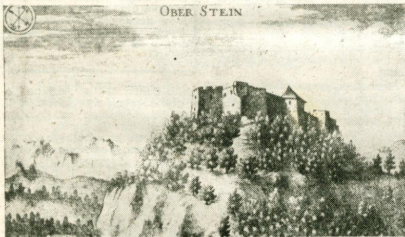
Valvasorjeva slika Starega gradu

Zvečer je bila v zavodu prisrčna domača proslava.