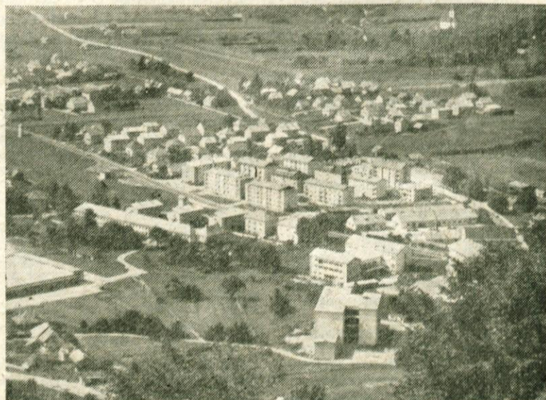
REKORDNA STANOVANJSKA GRADNJA