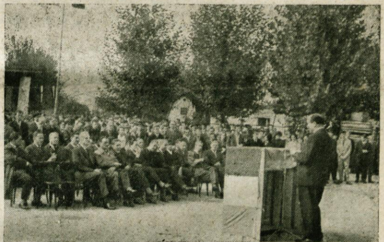
Gostje in člani kolektiva ob proslavi 60-letnice tovarne Stol