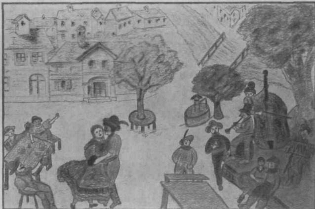
Helena Poženelova: Povodni mož.