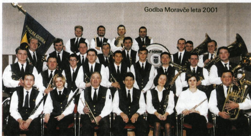
Godba Moravče leta 2001