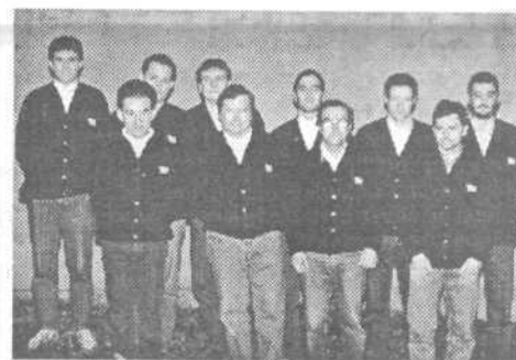
Sodniki NTK Preserje v oblačilih sponzorja WOLTOP-a.

Članska ekipa NTK PRESERJE nastopa v II. DRŽAVNI ČLANSKI LIGI. Po jesenskem delu tekmovalja smo na prvem mestu brez izgubljene igre in smo si že skoraj zagotovili nastopanje v I. DRŽAVNI ČLANSKI LIGI v prihodnji sezoni. to pa pomeni priključitev klubom kot so: OLIMPIJA, MARIBOR, M. SOBOTA, NOVO MESTO ter drugi. Ti uspehi pomenijo tudi vključitev naše ekipe v EVROPSKA TEKMOVANJA, kar pomeni še dodaten motiv in izziv za naš klub.