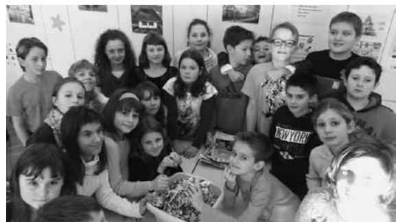
Slika 1, 2, 3: Trganje papirja.

V električni mešalnik damo papir. Dodamo škrobno lepilo in vodo, v kateri je bil namočen papir, da se lažje zmeša.