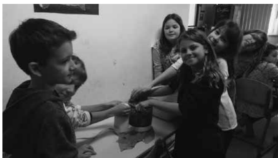
Slika 4, 5: Mešanje papirja.

Ko zmešamo, damo maso v delovno kad (banjico). Če je pregosto, zalijemo z vodo, da se papirna vlakenca razpustijo. Izločimo večje kose papirja, ki se niso zmešali.