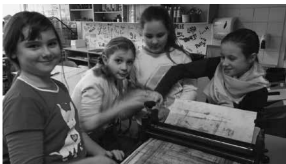
Slika 7, 8, 9, 10: Dajanje papirja na sito in odcejanje vode.