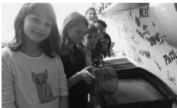
Slika 6: Premešan papir damo v kad.

Ko zmešamo, damo maso v delovno kad (banjico). Če je pregosto, zalijemo z vodo, da se papirna vlakenca razpustijo. Izločimo večje kose papirja, ki se niso zmešali.