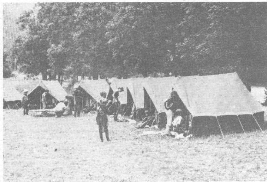
Taboreči pri pospravljanju šotorov

Verjetno vas zanima, kakšen je delovni dan na taborjenju?! Taborjenje je v bistvu aktivni oddih. Taborno vodstvo se je trudilo, da je čimbolj pestro zapolnilo čas na taboru, s programom in aktivnostmi. Medvedki in čebelic so bili zaposleni ves dan. Delovni dan na taboru se prične z dvigom zastave. Taborni prostor mora biti čist in urejen, zato zjutraj taborniki najprej pospravljamo šotor in okolico šotorov. Potem se prične gozdna šola, tako taborniki imenujemo