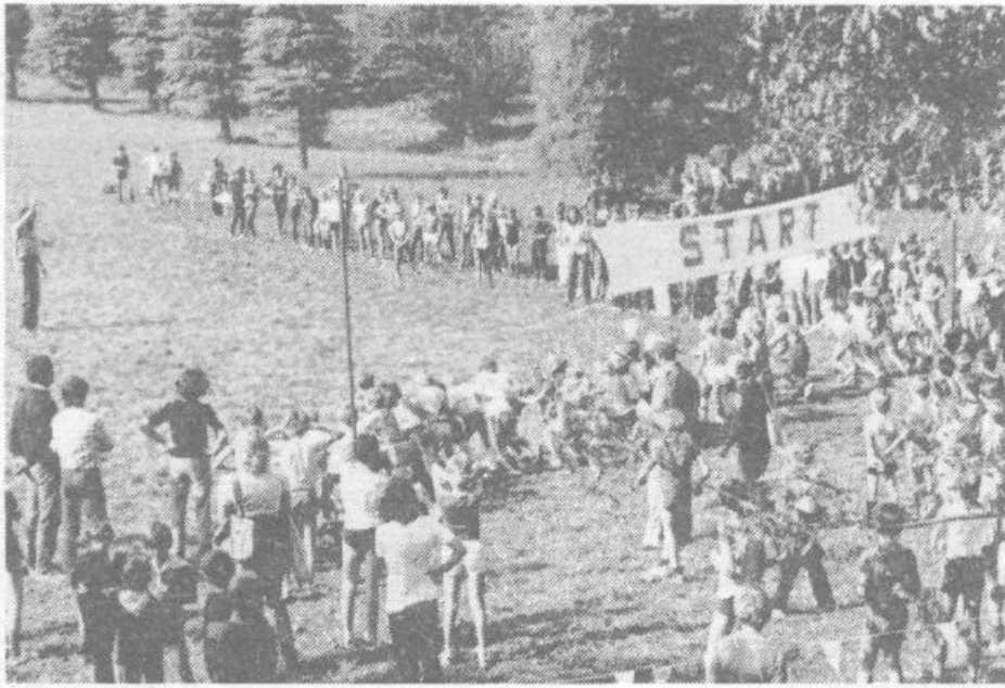
Z oktobrskega krosa