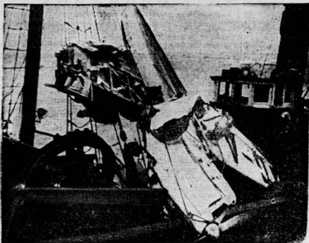
Dva mlada gojenca angleške letalske šole v Southamptonu sta te dni podvzela pokusni polet čez La Manche in sta, ker jima je na vožnji zmanjkalo bencina, padla v morje. Imela sta srečo, da sta opazila ladjo, ki ju je rešila.