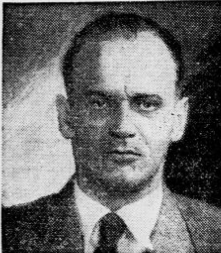
Hajal Nemčiji. Podoba je, da se bo iz teh aretacij izcimila nova velika vohunska afera