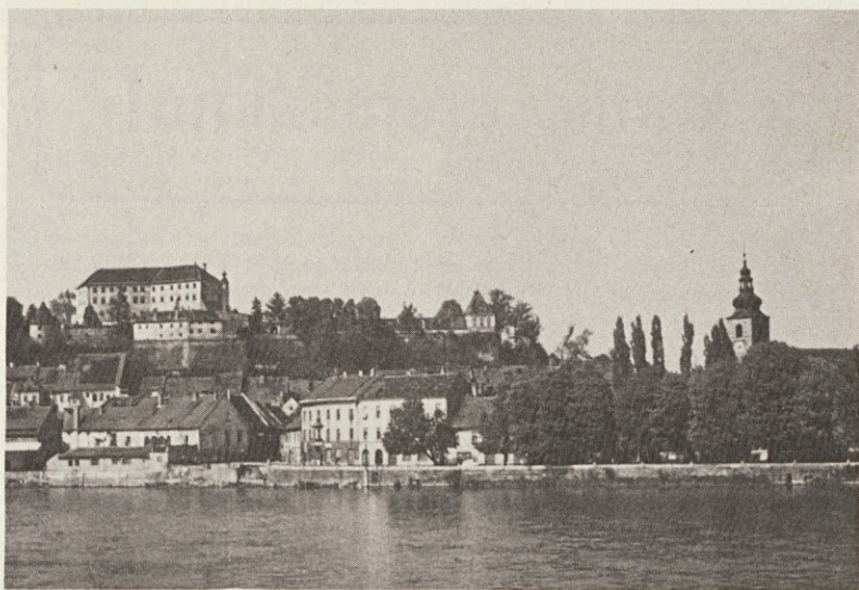
PTUJ, vrata v Panonijo

BREŽICE — Krajevna radijska postaja v Brežicah je dosedaj delovala kot enota Zavoda za kulturo. Zaradi