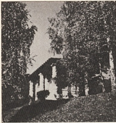
BEGUNJE na Gorenjskem — Plečnikova kapela