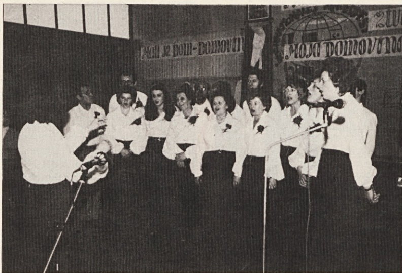
Pevski zbor »Slovenski cvet« iz Moersa, ki nam je pel ob »Dnevu žena« v Krefeldu.

Slovensko društvo »Slovenski zvon Krefeld«