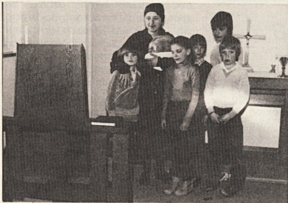
Prizor ob recitaciji Cankarjeve črtice »Sveto obhajilo« v Köpingu.

co zapeli. Zapeli so tudi, kaj vse dela skrbna mamica: »srajčke šiva, hlačke celi...« Ob pesmici »Ti, domača hiša« pa smo se vsi z mislimi in srcem za kratek čas preselili domov in si rekli: Res, ne bom te pozabil, ljubi očetov dom!