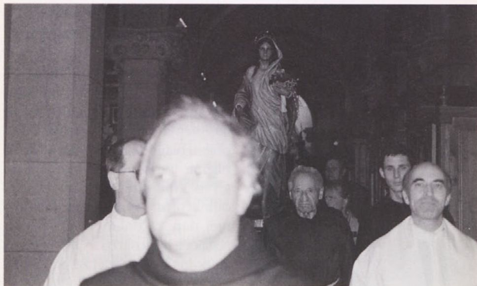
Prihod Marije iz Nazareta