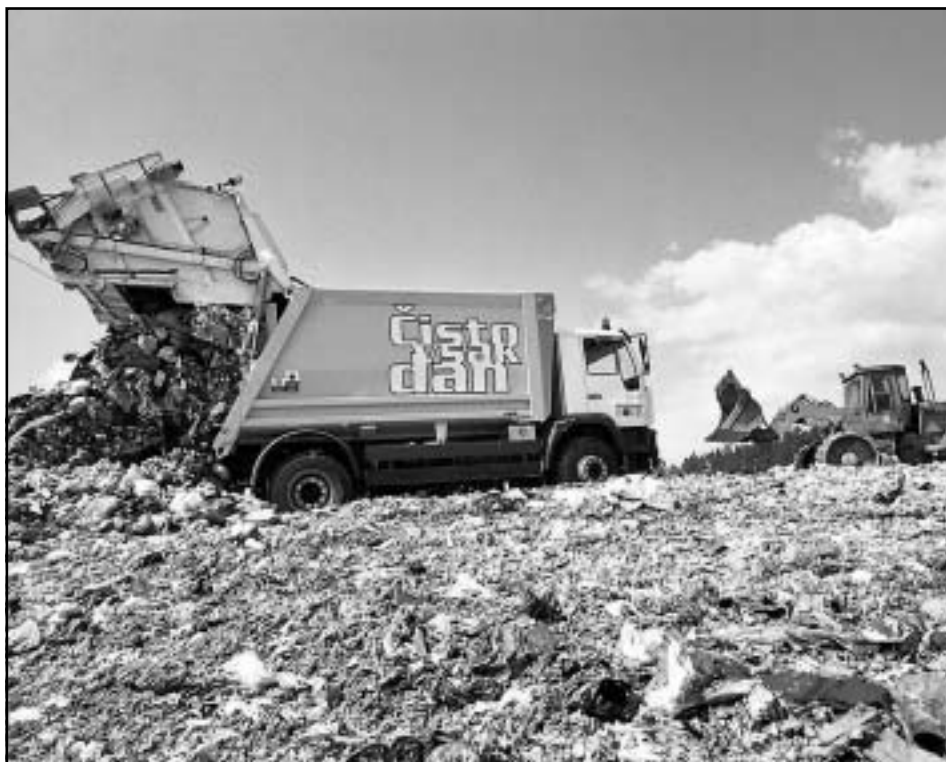
Pogled na posodobljeno odlagališče odpadkov Dob

komunalnih odpadkov. Podjetje Prodnik omenjene odpadke v letošnjem letu že odvaža iz 103 ekoloških otokov na prenovljeno deponijo v Dobu, kjer so konec lanskega leta opravili temeljite posege in deponijo prilagodili naj sodobnejšim standardom; asfaltirali so dostopno cesto in ob vhodu v odlagališče namestili 30-tonsko mostno tehtnico, ki omogoča količinsko kontrolo materiala; z žično ograjo so ogradili celotno območje deponije in uredili brežine v naklonih (z njihovo zatratitvijo so preprečili erozijo tal in omogočili boljše odtekanje površinske vode) ter na posameznih odsekih zasadili več kot sto hitrorastočih topolov, ki bodo v nekaj letih zakrili pogled na odlagališče. Z gradbenimi deli in namestitvijo 1200 kvadratnih metrov folije prek robov odlagalnih polj, ki preprečuje pronicanje deževnice v odlagališče in njeno iztekanje v koritnice, namenjene čisti vodi, so ločili meteorne in izcedne vode (te zdaj odvajajo v čistilno napravo), z ureditvijo sortirnega platoja pa pridobili prostor za novih petnajst zabojnikov za zbiranje koristnih odpadkov ter zabojnik, opremljen za zbiranje in odvoz nevarnih snovi. Odlagališče odpadkov Dob, na katerem so samo v lanskem letu zbrali več kot 300 ton najrazličnejših odpadkov, postaja tako ena najbolj urejenih deponij v Sloveniji, komunalno podjetje Prodnik pa eno tistih, ki jim skrbi za okolje – in z njo tudi za prihajajoče generacije – pomeni prvenstveno nalogo in odgovornost.