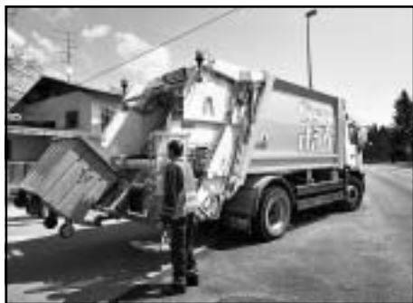
Eno od petih prenovljenih vozil za odvoz odpadkov JKP Prodnik

DOMŽALE - Domžalsko komunalno podjetje Prodnik d.o.o., ki odvaža odpadke iz občin Domžale, Trzin, Mengeš, Lukovica in Moravče, je z naložbami, izpeljanimi konec lanskega leta, saniralo odlagališče odpadkov na Dobu, z nedavno prenavo vizualne podobe voznega parka podjetja in vpeljavo slogana Čisto vsak dan pa skušalo občanom približati del dejavnosti pri širjenju zavesti o pomenu skrbi za okolje.