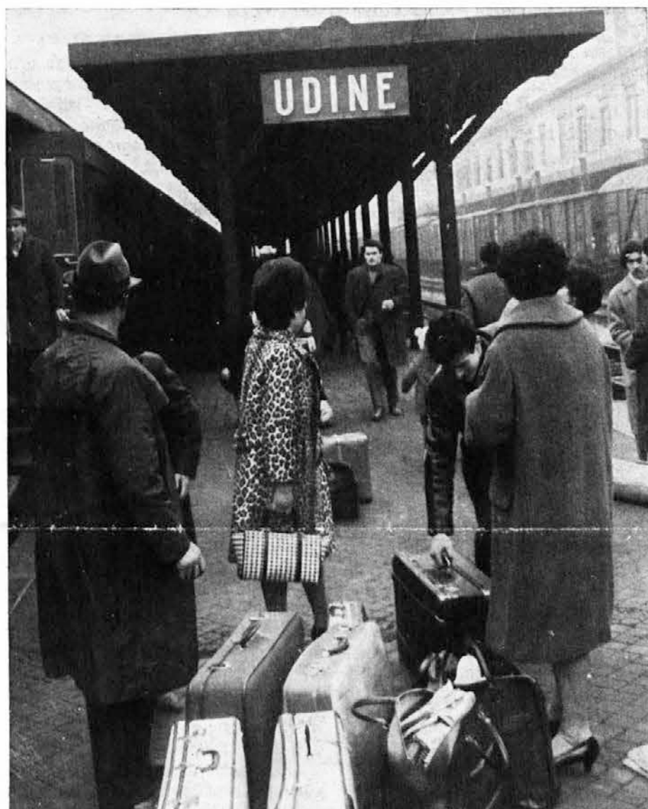
Zopet jih čaka vlak, da jih odpelje v tujino s trebuhom za kruhom

a decidere solo nel caso che, scoppiato un eventuale conflitto, gli USA decidessero di montare su aerei italiani le ogive nucleari. Ma quelle squadriglie aeree italiane sono già oggi addestrate per quella eventualità, il governo italiano ha già pronto il «piano di intervento», il governo ha stretto patti militari in questo senso alle spalle del Parlamento. Chi ha autorizzato il governo? Moro aveva detto che «non esiste un problema di legittimità costituzionale nell'agire per garantire la sicurezza del Paese», ma l'on. Alicata gli ha risposto: «No, onorevole Moro, la Costituzione non le dà diritto di prendere impegni di questa natura senza averli sottoposti prima all'approvazione del Parlamento. L'on. Moro riunirà il Parlamento, per decidere, al momento dello allarme? No, il Parlamento deve decidere prima e a questo proposito noi prenderemo opportune iniziative».