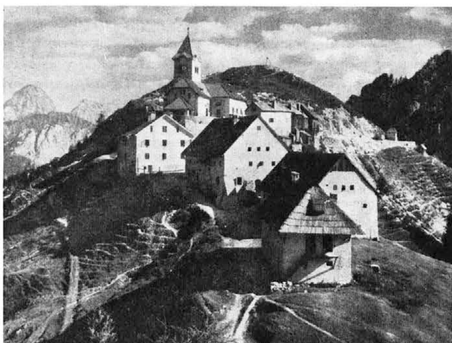
Znano svetišče na Visarjeh, kamor radi hodijo romarji iz vseh treh dežel: Furlanije, Slovenije in Koroške. Na vrh je speljana žičnica.