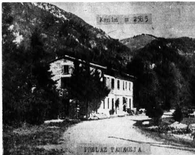
Passo Tanamea: sullo sfondo il massiccio del Canin

vuta alla natura calcarea-dolomitica del suolo e alla siccità estiva. Più precisamente le malghe pascolative (e si potrebbe benissimo dar vita ad altre attraverso organi cooperativi e consorziati stante la frazionalità delle proprietà) occupano 1266 ha. di terreno ove monticano nella stagione estiva all'incirca 500 bovini, 300