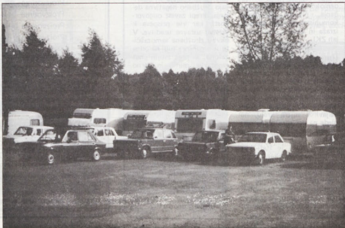
Vmesna postaja: malo počitka za voznike in „hlajenje“ za ogrete kovinske konjičke.

Podobno težnjo kažejo tudi podatki o posvojitvah otrok. Število teh je v dveh že navedenih obdobjih upadlo od 112 na 89. Avgusta letos sta bila posvojena v Sloveniji le dva otroka.