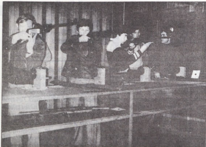
Če kje, je popolna zbravnost potrebna strelcem – naši na sliki so se dodobra živeli v nelahko nalogo.