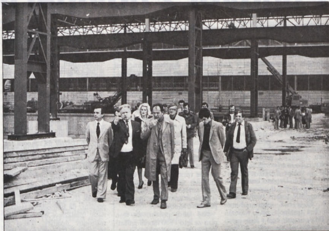
Železobetonska obzorja niso namen samim sebi. Uresničitev tekoče investicije daje solidno podlago za nadaljnji razvoj proizvodnje.

IMV KURIR izdaja delovna organizacija Industrija motornih vozil Novo mesto – Izhaja vsakih 14 dni v 6750 izvodih – Ureja uredniški odbor, glavni in odgovorni urednik Simo Gogič – Uredništvo in uprava: Novo mesto, Zagrebška cesta 18/20 – Grafična priprava: DITC Novo mesto, TOZD Dolenjski list, tisk TOZD Tiskarna Novo mesto.