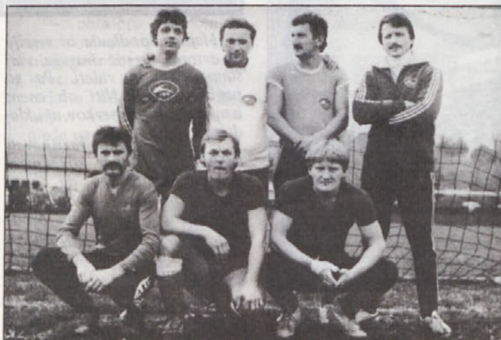
Nogometaši tovarne prikolic iz Novega mesta – tretjeplasirana ekipa v malem nogometu.