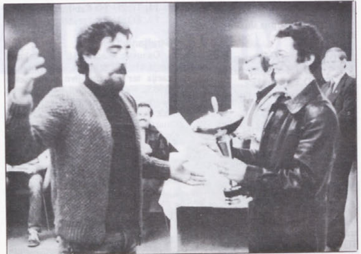
Veselje ob predaji prehodnega pokala.

Dejansko se je potrebno temeljito zmisлити, predvsem pa ukrepati tako, kot se med komunisti spodobi: tovariško, odkrito, samokritično in brez- kompromisno. Samo še eno vprašanje: