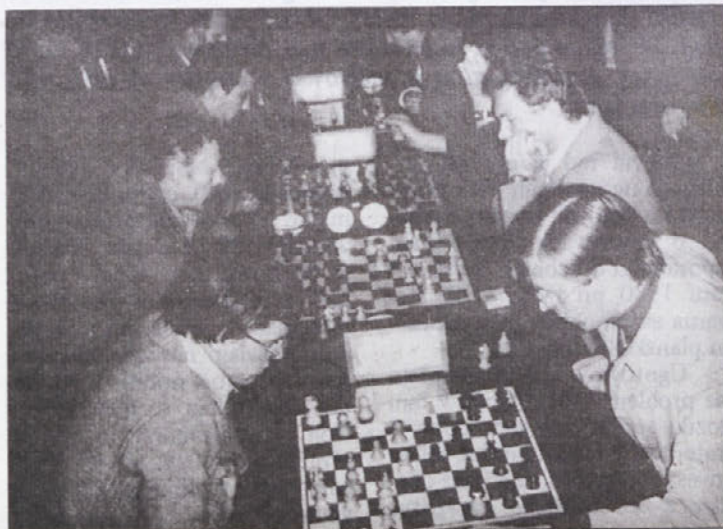
Zamišljeni šahisti – tudi ta priljubljena in ugledna „kraljevska igra“ ima v IMV precej prijateljev.

Razprave delegata tov in sprejeti sklepi izkazujejo močno stabilizacijsko o naravnost vseh samoupravnih in upravnih dejavnikov v tozdu, zlasti pa je prisotna pripravljenost za konkretno akcijsko razreševanje problemov v kolektivu, kar vzbuja zaupanje v njegovo sposobnost za uresničitev planskih obvez.