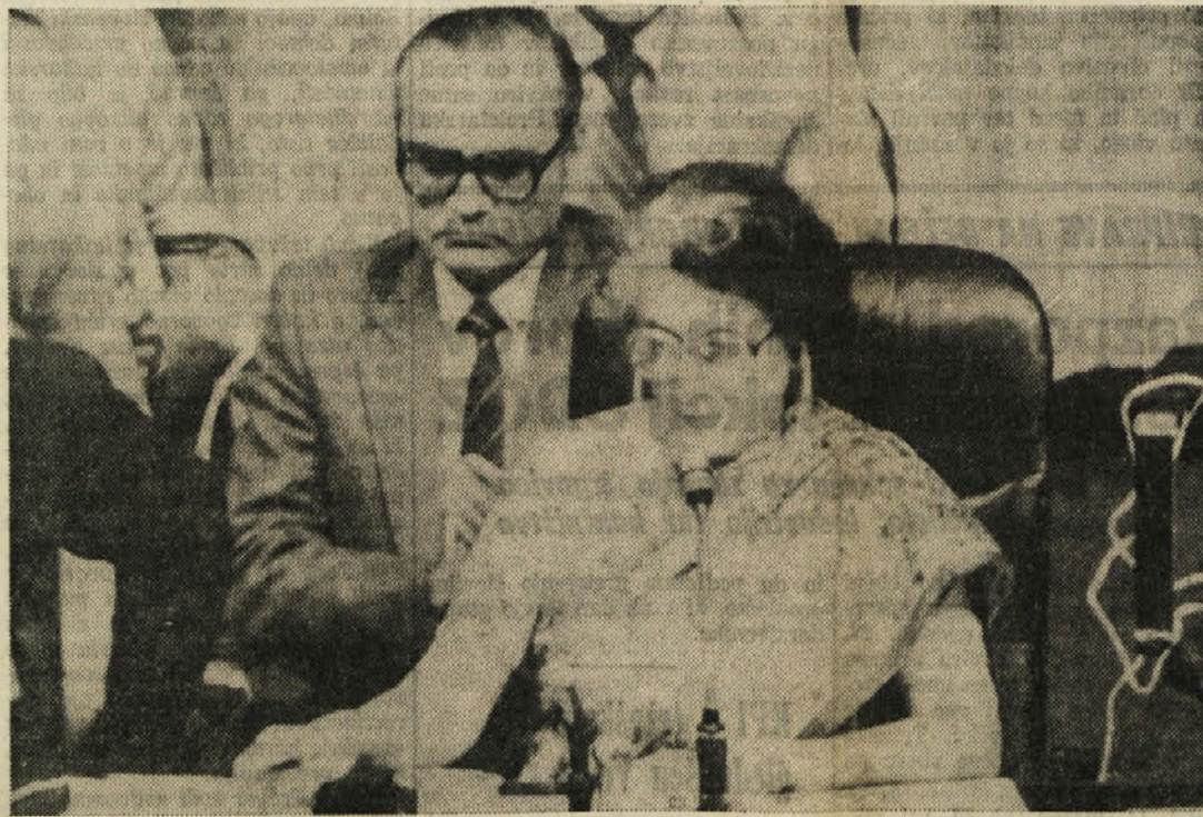
Indira Gandhi zaključuje s sklepnim govorom sedmo konferenco na vrhu neuvrščene države

NEW DELHI — S sprejetjem sklepnih listin se je včeraj dopoldne v indijski prestolnici zaključila šestdnevna konferenca najvišjih voditeljev 99 držav članic neuvrščene gibanja. V Palači modrosti se je med srečanjem vrstilo več kot devadeset govornikov, ki so kljub nekaterim razlikam v stališčih do posameznih vprašanih mednarodnega sožitja, vsekakor potrjevali tisto, kar neuvrščene države in moralno zavezuje k skupni akciji: želja po miru in pravičnejših odnosih med državami in narodi, tako na političnem kot na gospodarskem področju. Na zaključnem plenarnem zasedanju so navzoči poslušali poročilo o delu političnega in gospodarskega odbora in se dogovorili za sestavo posebnega telesa, ki bo skrbel za uresničevanje sklepov sedmega vrha neuvrščene države. Nato so z dolgotrajnim aplavzom soglasno sprejeli politično in gospodarsko resolucijo ter celovito poročilo o delu konference. Indijska voditeljica Indira Gandhi, ki bo do naslednjega vrha predsedovala gibanju, se je v velikem auditoriju obrnila z besedami zaupanja v prihodnost neuvrščene države: »Nekateri so želeli, da bi gibanje zamrlo, poskušali so ga razbiti, toda tukaj v Delhiju smo jih razočarali. Čeprav se pri nekaterih vprašanih razhajamo, celo skregamo, smo odločno soglasni za enotnost, pripravljeni