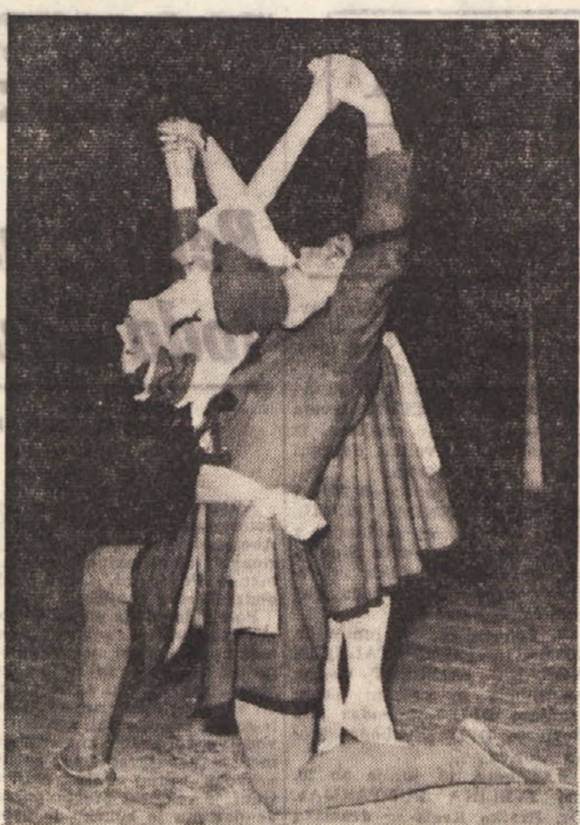
Prizor iz baleta 'Povodni mož'