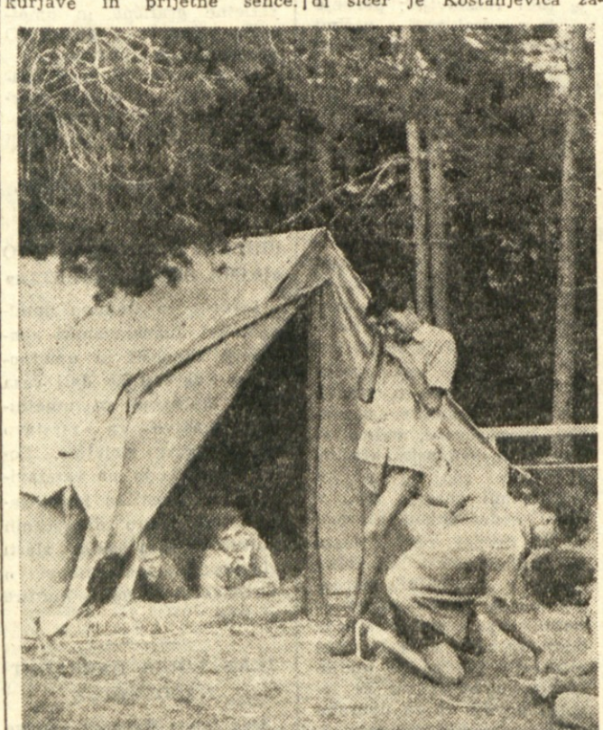
Tržaški mladinci na taborjenju v Kranjski gori

Tudi taki so, ki imajo radi Primorsko. Njim priporočamo taborni prostor v Idriji pri Bači. Prostor leži na desnem bregu Idrije za vasio Idrija pri Bači, okoli 3 km od Mosta na Soči v smeri proti Idriji. Na drugem bregu Idrije je pitna voda v zaidanem studenčku, Idrija pa je primerna za kopanje. V bližini so gozdovi in ni težav s kurjavo.