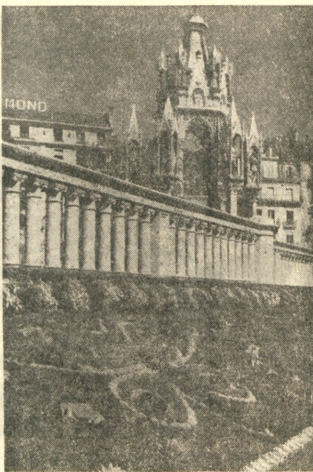
Motiv iz Zeneve

«Ljaja in sicer v drugačno vrsto svetlobnih valov, kakor so bili prvotni; in ti svetlobni valovi greda v avtomatičen pisalni stroj, ki piše neverjetno hitro. Tu se spremene svetlobni impulzi v čitljivo pisavo, smeraj v sveznjih po sto strani. Sveznji papirja leta iz stroja ko prazne pšenične vreče iz avtomatičnega mlina. Vidite torej, kar stroj prebere, se v polnem obsegu in trajni obliki konservira. Potem je treba strani samo še sešiti — toda za to delo zadostuje spreten pisarniški fant.» «Ali pa bi lahko vse prebrali?» je vtrgal profesor amfibiologije pri svojem. «Zakaj pa ne — seveda bi lahko prebrali, če bi nas peselilo, je dejal profesor Entuhist-le. «Vad fakultetnim klubom spremene v svetlobne tres-