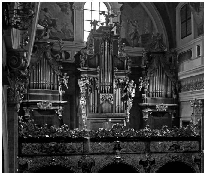
Stolnica v Ljubljani leta 2008. Omare z lepimi baročnimi okraski na balustradi in baročnim okrasjem danes gostijo Milavčeve orgle. (jd)

delati lepše in prijetnejše. — Ne rečemo, pa, da bi morale biti orgle majhne, da služijo le za spremljevanje glasov. Sveta cerkev ima v svojem letu prekrasen venec veličastnih praznikov, ki nas spominjajo veselih, pa tudi tužnih dogodkov dela našega odrešenja; temu primerno naj tudi orgle vsasih pojo mogočneje in veselejše in izražajo notranja čutila v polnih akordih. Zarad akustike in ljudskega petja se postavljajo orgle na zahodno stran. Paziti je pri novih orglah, da se jim da lična zunanja oblika, a vendar ne prebogata, da bi se za orgle, katerim obračamo hrbet, potrošilo več, kakor za oltar; pa tudi preveč preproste ne smejo biti, zakaj, vsa cerkvena oprava naj bo lična in svetosti kraja primerna. — Kjer stoje orgle na zahodu, je paziti na to, da ne zakrivajo lepega srednjega okna na pročelju, da cerkev ne postane pretemna. Tedaj naj se dele orgle v dva dela, kar zna dandanes narediti vsak orglar; gledati je tudi na to, da ne kaze druge arhitekture.