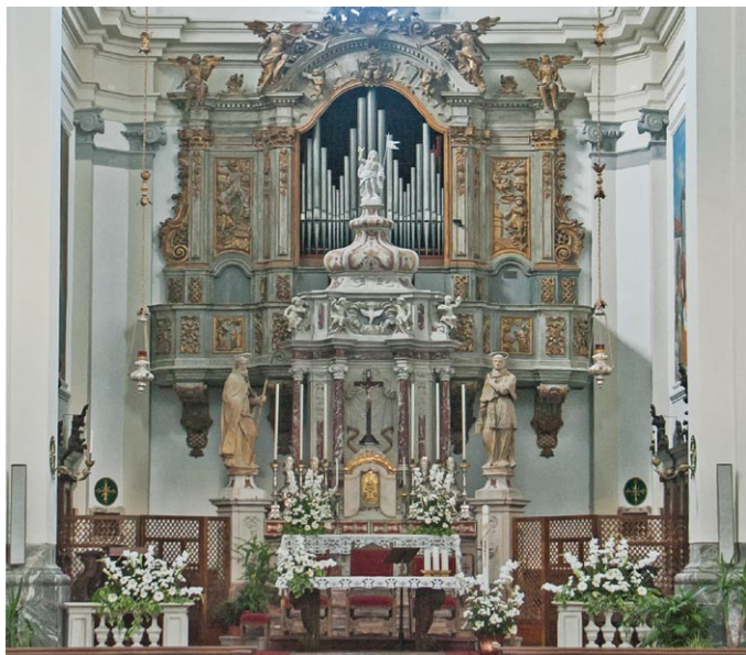
Sl. 3. Domnevno Nakićeve orgle v samostanski cerkvi v Mužacu / Moggio. (jd)