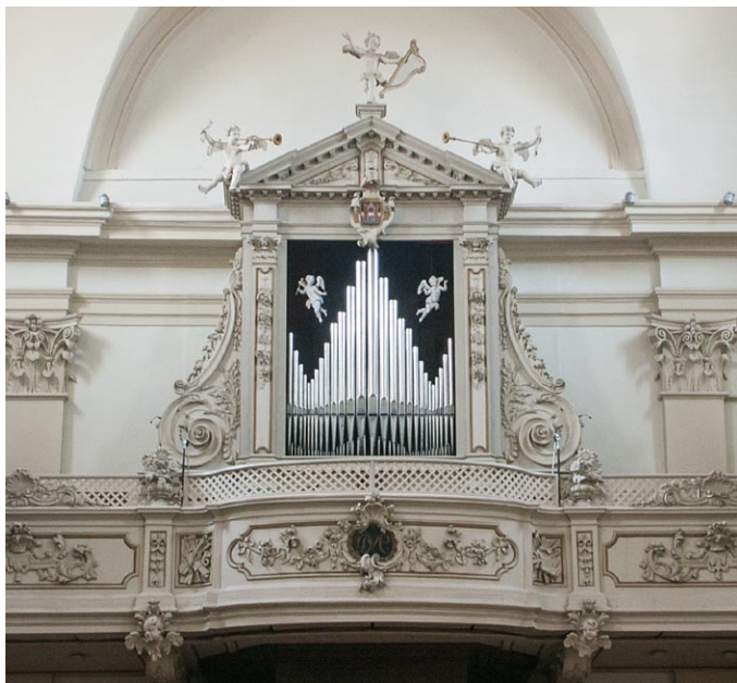
Sl. 2. Nakičeve orgle v konkatedrali sv. Marka v Pordenone. (jd)