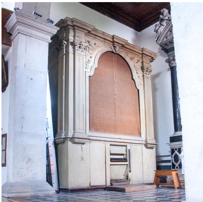
Sl. 4. Nakićeve orgle pri frančiskanah v Šibeniku. (jd)