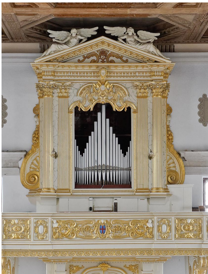
Sl. 1. Nakićeve orgle v cerkvi sv. Jurija v Piranu.