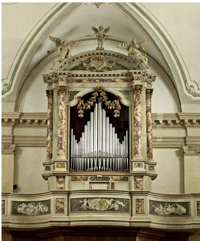
Sl. 6. Nakičeve orgle v cerkvi sv. Marka v Caerano. (jd)