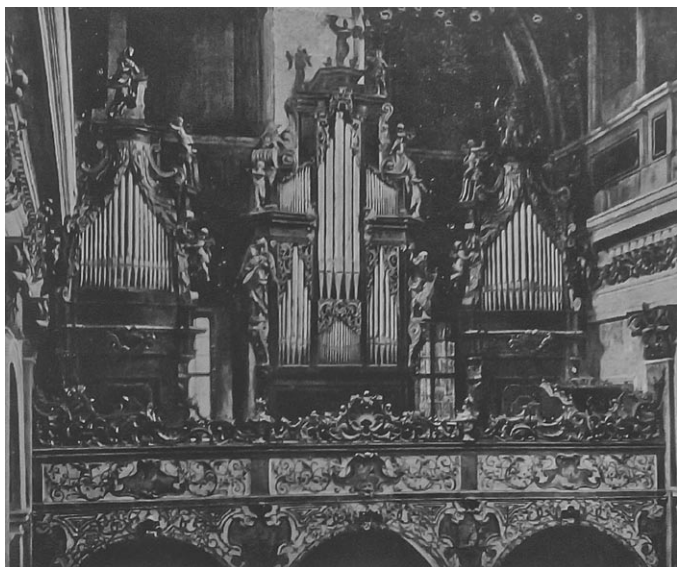
Stolnica v Ljubljani leta 1908. Omare z lepimi baročnimi okraski na balustradi in baročnim okrasjem so takrat še gostile Kunathove orgle. (Iz Flisove knjige)

Pri napravljanju novih orgel je gledati na velikost in na zunanjo obliko. Pravi namen orgel je, da spremljajo petje, bodi si liturgično ali ljudsko, ga dopolnjujejo, delajo krepkejše in živahnejše. Glavno pri cerkveni glasbi je petje, orgle ga torej ne smejo nadvladati, ampak pevskim glasom le služiti, jih