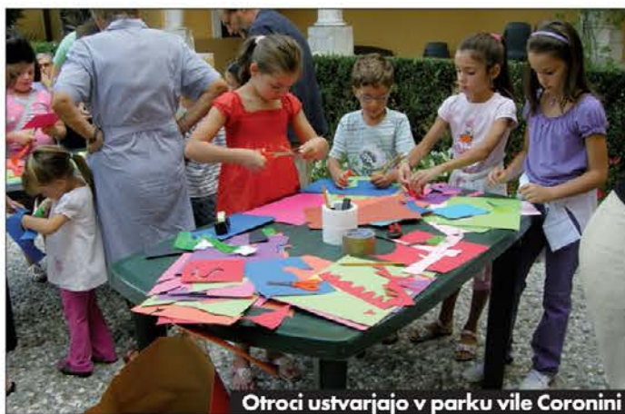
Otroci ustvarjajo v parku vile Coronini

jkali prav tisti lutkarji, ki s postavitvenimi izkušnjami in spretnostjo v vodenju malih odrskih protagonistov znajo najbolj prepričljivo pričarati in oživiti lutkovne junake. Z grenkobo smo tudi opazili, da ni bilo na sporedu nobene slovenske lutkovne predstave, kar je prava škoda, saj je lutkovna produkcija na Slovenskem zelo cvetoča, pa še bližnji