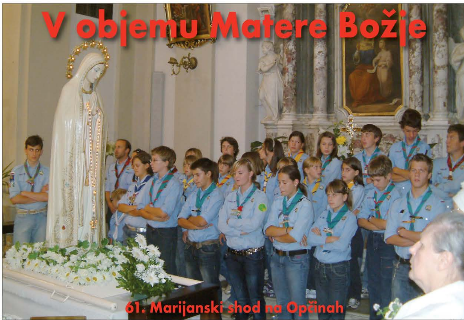
61. Marijanski shod na Opčinah