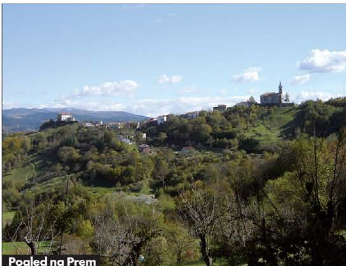
Pogled na Prem

maševali pa so še trije duhovniki. Izredno veliko ljudi, še zlasti znancev in prijateljev, je napolnilo prostrano premsko cerkev.