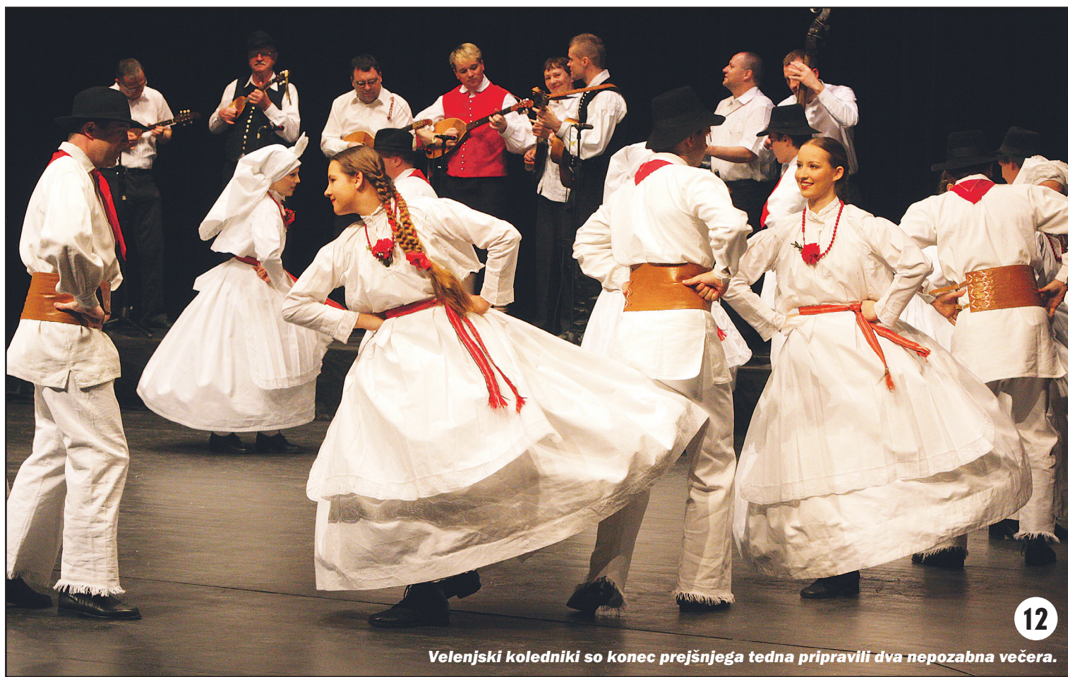
Velenjski koledniki so konec prejšnjega tedna pripravili dva nepozabna večera.