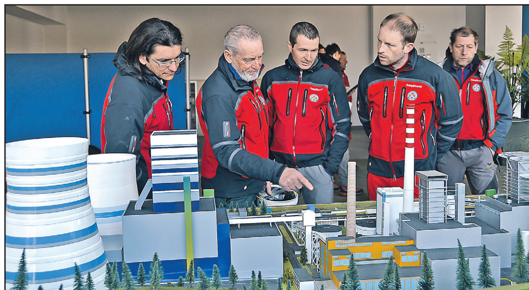
Najprej so si področje TE Šoštanj in gradbišča ogledali na maketi