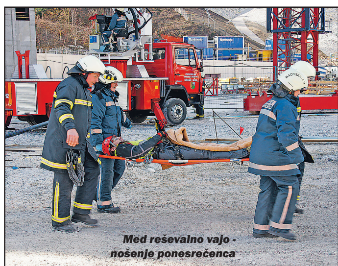
Med reševalno vajo - nošenje ponesrečenca