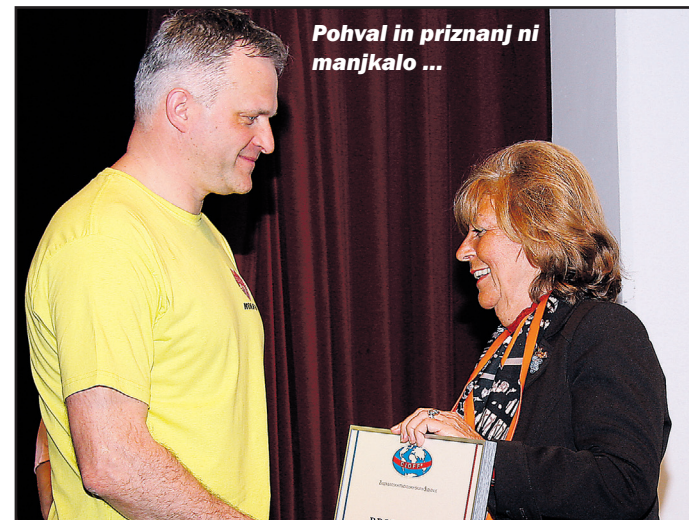
Pohval in priznanj ni manjkalo ...