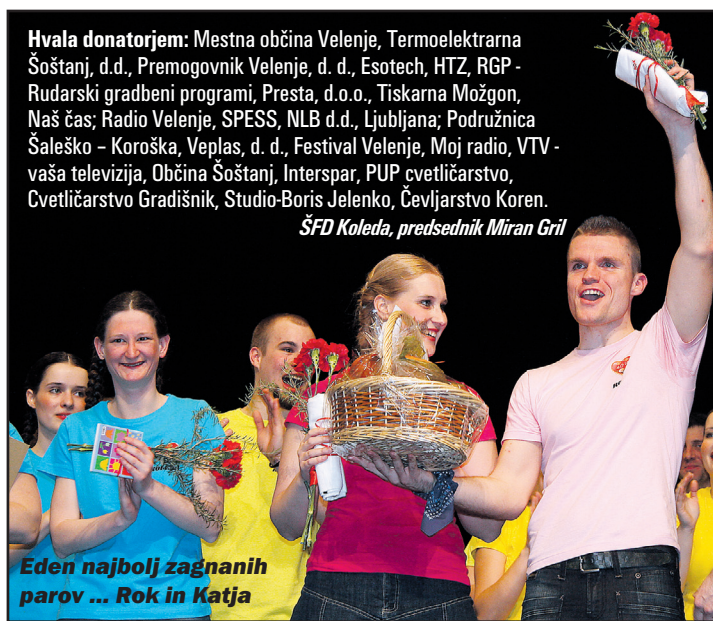
Hvala donatorjem: Mestna občina Velenje, Termoelektrarna Šoštanj, d.d., Premogovnik Velenje, d. d., Esotech, HTZ, RGP - Rudarski gradbeni programi, Presta, d.o.o., Tiskarna Možgon, Naš čas; Radio Velenje, SPESS, NLB d.d., Ljubljana; Podružnica Šaleško - Koroška, Vepas, d. d., Festival Velenje, Moj radio, VTV - vaša televizija, Občina Šoštanj, Interspar, PUP cvetličarstvo, Cvetličarstvo Gradišnik, Studio-Boris Jelenko, Čevljarstvo Koren. SFD Koleda, predsednik Miran Gril