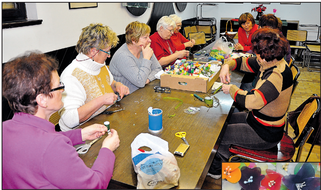
Dolge zimske večere smo si popestrile z izdelavo rož

prinesle s sabo svoja ročna dela. To so bile pletenine, nakit in voščilnice, kvačkani prti, naučile smo se izdelovati cvetje ... In prav to cvetje, ki je nastajalo izpod naših spretnih rok, je navdušilo tudi vodstvo krajevne