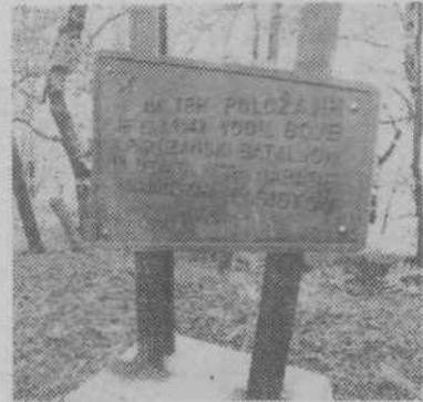
Obeležje na Pugledu

Ob cesti, ki pelje v Šentpavel, je tudi cesta v Brezje in Repče, vasi, ki spadata v KS Lipoglav. Cesta je zelo slaba in v zimskem času neprevozna, zato raje uporabljajo tisto, ki pelje skozi Panško