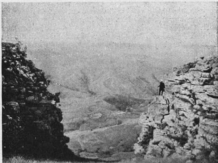
Lepa pokrajina misijona Natal.

bomo morali opustiti mnogo zunanjih šol, in to baš sedaj, ko nas nek vaški poglavar lepo prosi, da naj v njegovi okolici odpremo dve novi šoli, ker njegovi ljudje bi radi postali kristjani. Ako pa mu ne bomo ustregli — pravi — potem nas bodo prehiteli nekatoliški učitelji.