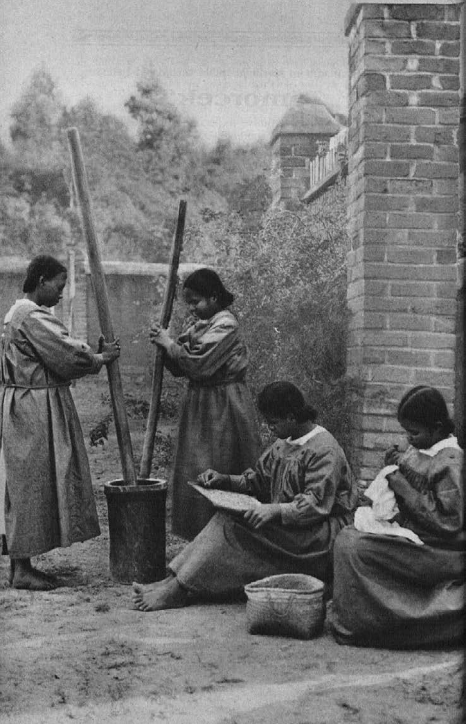
Misijonske kandidatkinje tolčejo žito, ker nimajo mline.