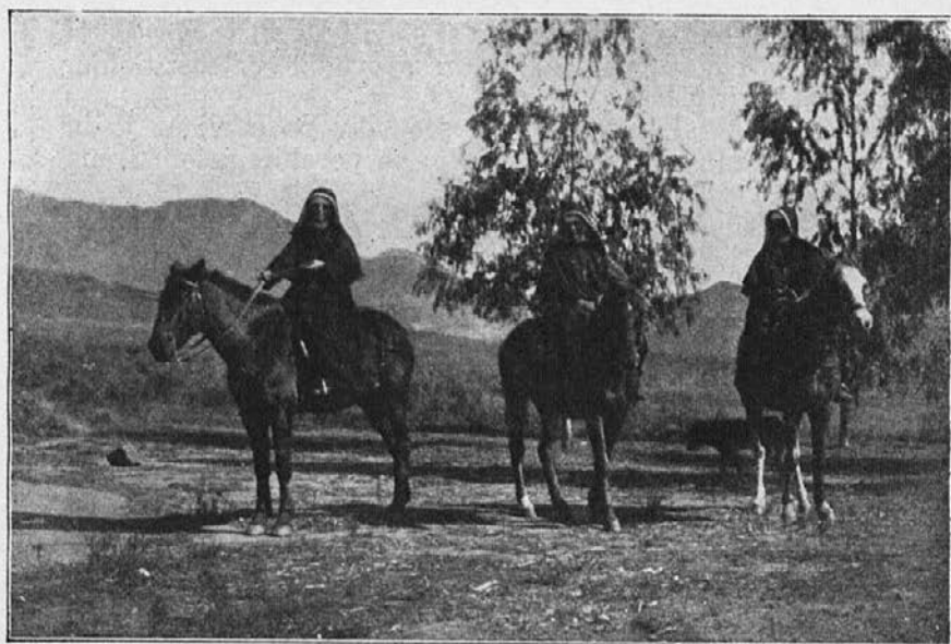
Misijonarke se odpravijo na konjih na daljna misijonska potovanja.

na to reče, tedaj je sklenila roke in hvaležno pogledala proti nebu in rekla besede, ki jih nikdar ne bom pozabila: »O Bog, zahvaljen bodi, da si se ozrl na mojega otroka. Vzemi ga. Z veseljem ti ga dajem!« In oče? Tudi on je bil srečen in je obljubil, da bo branil svojo hčerko proti sorodnikom, ki že zdaj komaj čakajo, kedaj bodo prišli do »poročnega daru«. Tako sta oče in mati tudi storila.