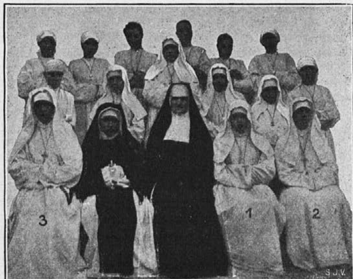
Cvet naših zamorskih sester. V sredi predstojnica.