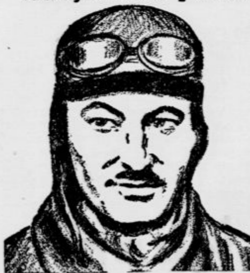
Znani francoski letalec Paillard je postavil s svojim spremljevalcem Mermozom nov svetovni rekord. Letalca sta bila 54 ur v zraku in sta preletela 9000 km.