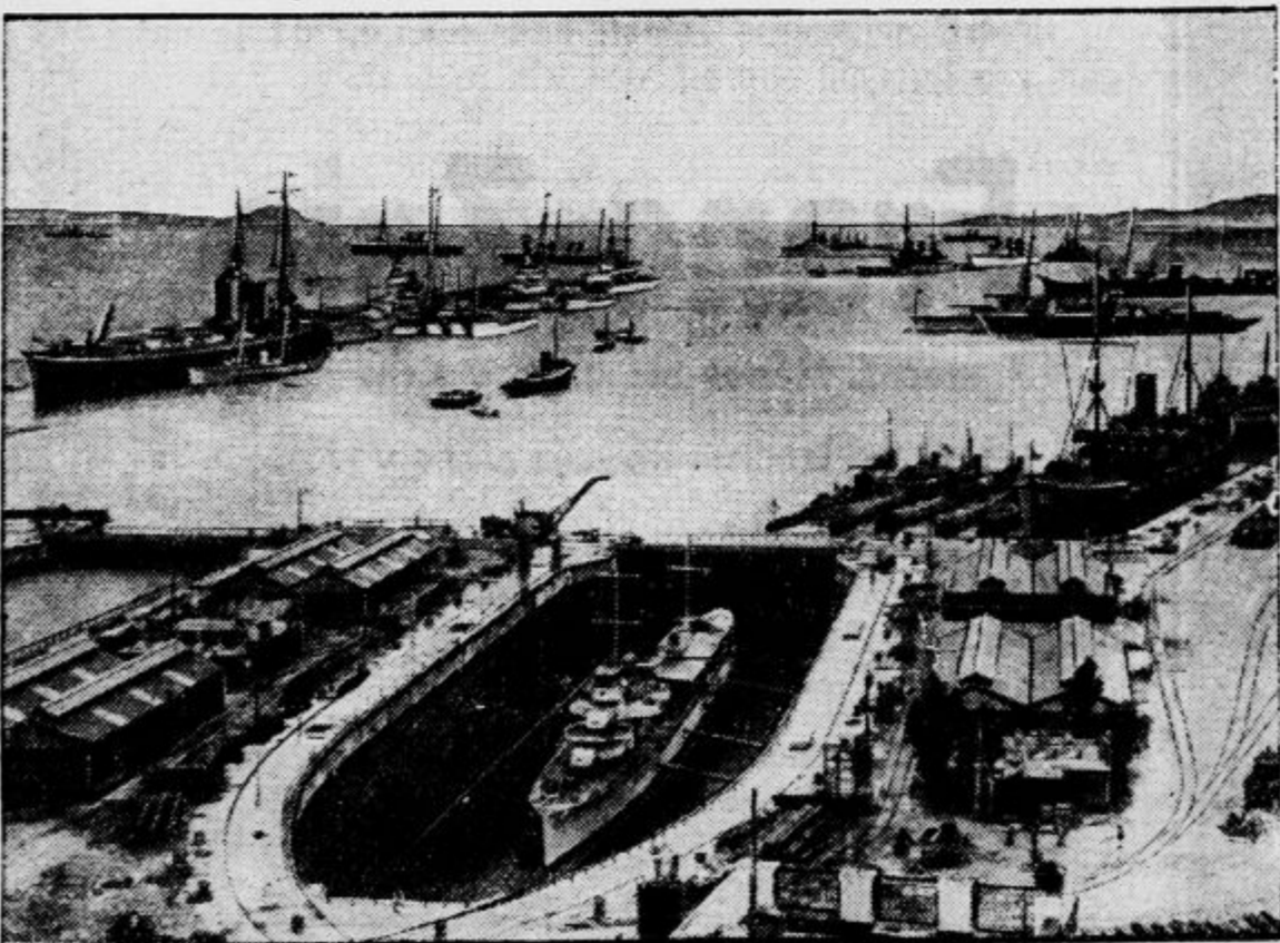
Slika kaže gibraltarsko luko, kjer se je zbrala angleška atlantska in sredozemska vojna mornarica k skupnim pomladanskim vežbam.