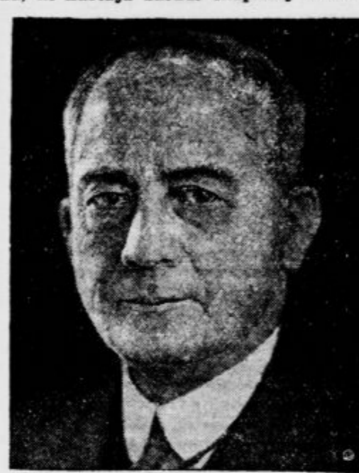
Moncada, predsednik republike Nicaragua

Aeropiloti, ki so iz Zedinjenih držav odleteli na pomoč ponesrečenem ter jim neslišno zdravilo in živež, slikajo opustošeno ozemlje kot pravcato pekel ognja in dima.