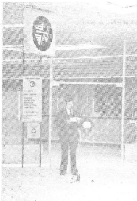
Nova pošta ima osem sprejemnih mest za šalterji in 18 dostavljajcev. V njej so tri notranje telefonske govornice. Opremo za nove prostore so izdelali v Poštnem tozdu Ptt servis.

Nagrade so res simbolične in naša raziskovalna skupnost nima dovolj denarja, da bi bile lahko višje, kljub temu pa so na slovesnosti ob podelitvi priznanj – v prostorih Inštituta Jožef Stefan izrazili upanje, da bo v prihodnjih letih odziv organizacij in združenega dela bolj množičen. Prav gotovo je raziskovalnega in inovacijskega dela v občini precej več kot bi lahko sodili po številu letošnjih nagrad. Vsaka, čeprav skromna spodbuda, namreč zagotovo pripomore k še večji prizadevanosti pri delu na tem pomembnem področju dela naše občine.