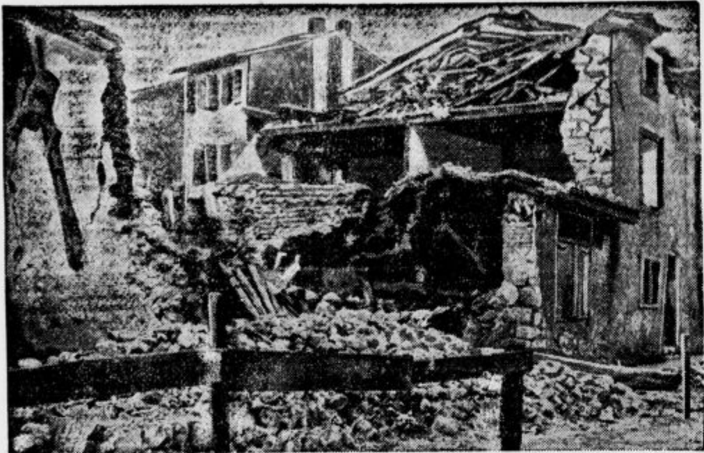
Hud potres v Benečiji. Pogled na podrte hiše v Cardignanu, kjer morajo bivati zdaj ljudje v vojaških šotarih.