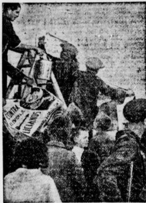
Madrid išče vojakov. V Madridu in okolici, kjer še rdeči gospodarijo, mrzlično pozivajo ljudstvo, da se udeleži obrambe in da se priglasi za iztrebljenje vohunov.

Štirideset tovornih avtomobilov je v Oviedu pripeljalo krompirja, kruha, mesa in municije in prebivalstvo pretaka solze veselja in odrešenja.