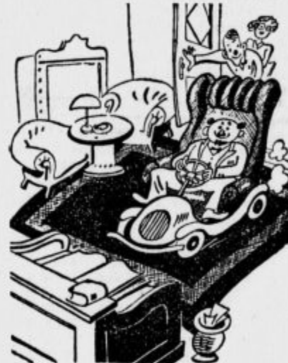
Duhovita iznajdba gospoda generalnega ravnatelja banke.

Dežela, ki je pred 400 leti tako razočarala Almagra, ne spada sicer k gospodarskim velesilam sveta, vendar jo moremo v Južni Ameriki prištevati k državam prve vrste. Zunanja trgovina je prav na višku, saj je samo lani šlo v inozemstvo za 20 milijonov funtov blaga — Leta 1849 je imela čilska država eno samo železniško progo; zdaj obsegajo vse proge 9000 km. Državna blagajna je imela za 900.000 funtov prebitka.