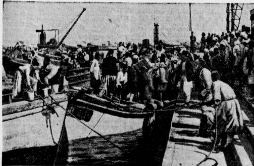
Šest mesecev so trajali nemiri v Palestini, ki so zdaj končani. Spet se je začelo delo v pristaniščih, spet so odprte trgovine. Slika je posneta z Jale, kjer je vse živo delavcev in potnikov.