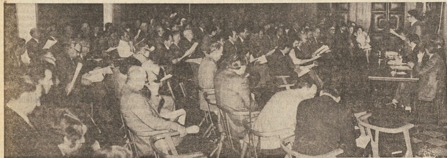
Pogled na malo dvorano v Kulturnem domu ob občnem zboru KZ

Gospodarska kriza postavlja v ospredje problem pozitivne kmetijstva - Zavzetost KZ za reševanje perečih vprašanj na Tržaškem: prosta cona pri Bazovici, vprašanje vode, nedeljskega izletništva in socialnega skrbstva - Zaupanje v bodočnost