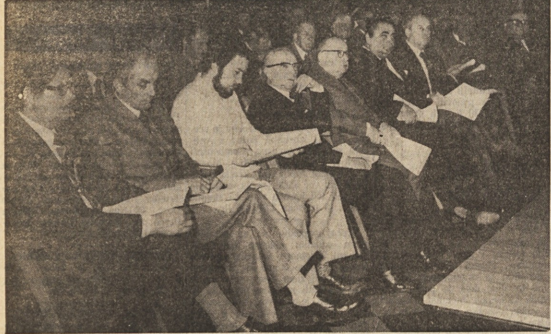
Gostje na zboru