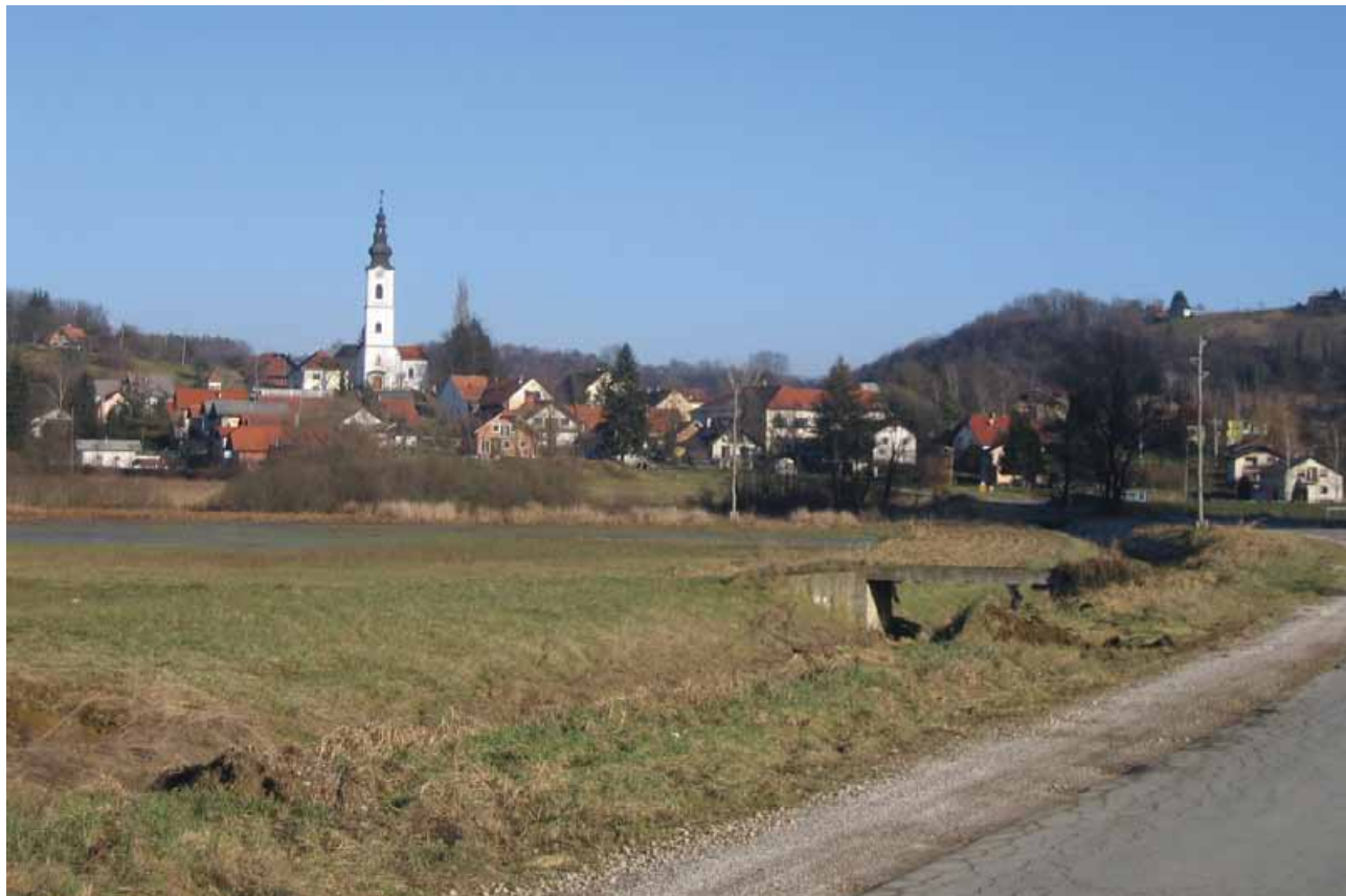
Slika 6: Dna dolin so mokrotna in izpostavljena poplavam.

K Srednjim Halozam štejemo nekoliko višji svet med Peklačo, osrednjim porečjem Rogatnice in zgornjim porečjem Psičine. So nekoliko višje in strmeješe od Vzhodnih Haloz, s krajšimi uravnjavami ter ožjimi in krajšimi dolinami. Podobno kot drugod v Halozah se tudi tukaj njive in vinogradi krčijo. Vinogradov je danes le še 13,2 % kmetijskih zemljišč, povečujeta se deleža gozdov in travnikov. Večje strmine so opuščene ali slabo izkoriščane.