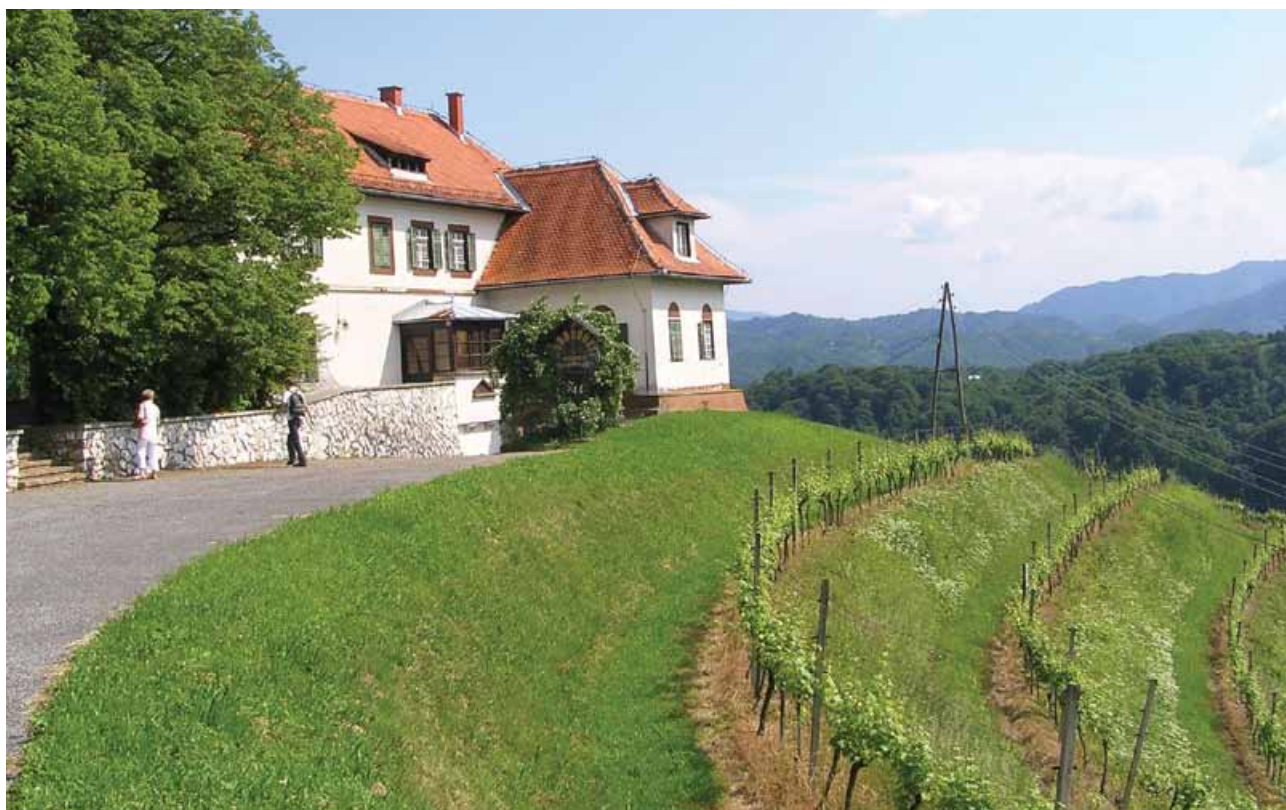
Slika 4: Gorca pri Podlehniku bi bila lahko s svojo slikovito lokacijo eden od najprivlačnejših ponudnikov turističnih storitev v Halozah.

V Vzhodnih Halozah je relief najmočnejše oblikovalo dokaj gosto vodno omrežje. Vodotoki Rogatnica, Škrabca, Jesenica, Peklača, Psičina, Bela in Turški potok so ustvarili širše doline, v katerih so tudi tri občinska središča (Goričak – Občina Zavrč, Cirkulane, Podlehnik), zato so izpostavljena močnejši urbanizaciji (1). Za pokrajino med dolino Peklače in Jelovškim potokom na zahodu so značilna bolj strma pobočja, priostreni vrhovi, manjša slemena, ozke doline ter višje absolutne in relativne višine (2). Naravne razmere sicer omogočajo kmetijsko dejavnost, vendar le specializacija s tržno usmeritvijo v vinogradništvo, saj tudi tradicionalno sadjarstvo že dolga desetletja nima pomembnega tržnega deleža (7). Zaradi naklonov, ki so v Vzhodnih Halozah od 6 do 20° in v Zahodnih