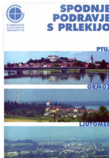
Slika 8: Naslovnica zbornika Spodnje Podravje s Prlekijo (9).

Kar 30 let je minilo do naslednjega temeljitejšega geografskega proučevanja Haloz, ko je pred zborovanjem slovenskih geografov na Ptuju leta 1996 kar 40 raziskovalcev izvajalo doslej največji geografski raziskovalni projekt "Možnosti regionalnega in prostorskega razvoja Spodnjega Podravja s Prlekijo". V zborniku Spodnje Podravje s Prlekijo (9) objavljeni rezultati so bili dobro sprejeti tako v strokovnih krogih kot v praksi, bili pa so tudi podlaga praktičnim odločitvam in posegom.