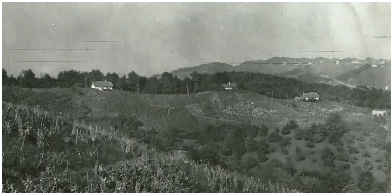
Slika 2: Haloze v šestdesetih letih 20. stoletja. Že takrat je bilo opazno zaraščanje kmetijskih zemljišč.

se Haloze soočajo z ekstremnimi razvojnimi problemi (7). V razvitih delih Evrope je takšna oddaljenost od zaposlitvenih središč območje najbolj intenzivne dnevne migracije delovne sile. Kombinacija za kmetijstvo neugodnih naravnih in lastniškoposestnih razmer, odsotnost delovnih mest v pokrajini in na njenem obrobju, izredno neugodna kvalifikacijska sestava prebivalstva, pomanjkljiva komunalna in prometna infrastruktura ter nizka socialna raven prebivalstva na eni strani ter ustrezna delovna mesta, predvsem za nekvalificirano delovno silo v hitro se razvijajoči mariborski industriji in v novi Tovarni glinice in aluminija v Kidričevem na drugi, so že v petdesetih letih prejšnjega stoletja pospeševali depopulacijo.