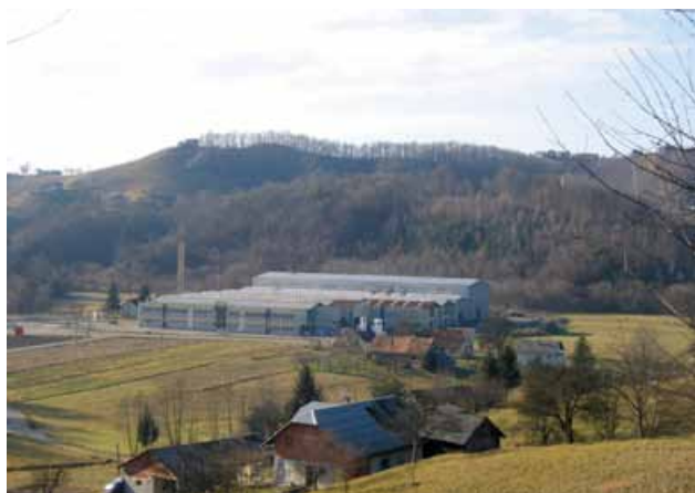
Slika 3: Največji zaposlovalec na območju Haloz je podjetje ADK v Dolanah.

se Haloze soočajo z ekstremnimi razvojnimi problemi (7). V razvitih delih Evrope je takšna oddaljenost od zaposlitvenih središč območje najbolj intenzivne dnevne migracije delovne sile. Kombinacija za kmetijstvo neugodnih naravnih in lastniškoposestnih razmer, odsotnost delovnih mest v pokrajini in na njenem obrobju, izredno neugodna kvalifikacijska sestava prebivalstva, pomanjkljiva komunalna in prometna infrastruktura ter nizka socialna raven prebivalstva na eni strani ter ustrezna delovna mesta, predvsem za nekvalificirano delovno silo v hitro se razvijajoči mariborski industriji in v novi Tovarni glinice in aluminija v Kidričevem na drugi, so že v petdesetih letih prejšnjega stoletja pospeševali depopulacijo.