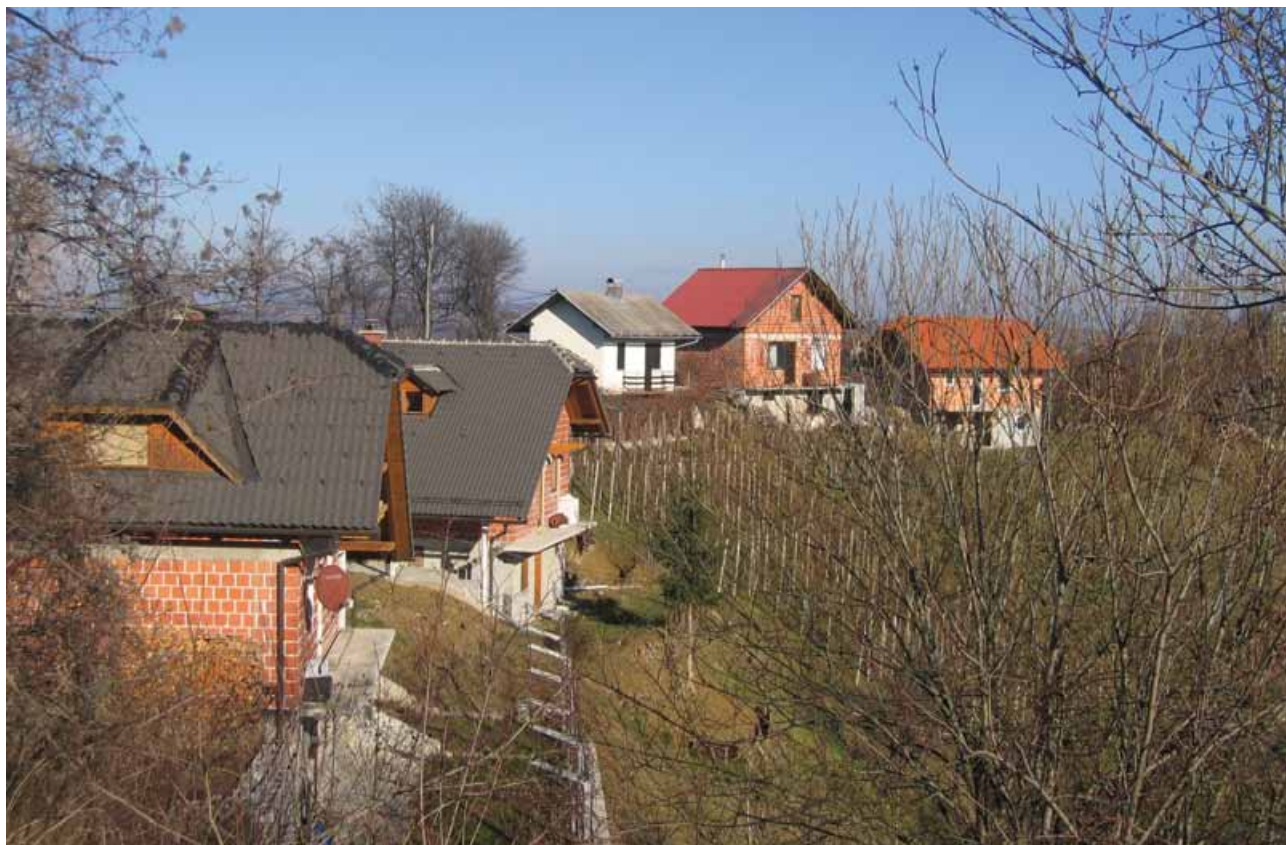
Slika 5: Urbanizacija ni zajela samo občinskih središč in najbolj dostopnih naselij, ampak tudi slemena v njihovi okolici. Na njih pogosto prevladujejo počitniška bivališča, ki se postopoma preobražajo v stalna bivališča.

Vzhodne Haloze imajo najboljše vinogradniške lege na vzhodu in jugu pokrajine na nižjih in daljših slemenih, razpotegnjenih v smeri vzhod-zahod. Leta 2008 so tukaj vinogradi pokrivali še 9,6 % vseh oziroma 15,7 % kmetijskih zemljišč.