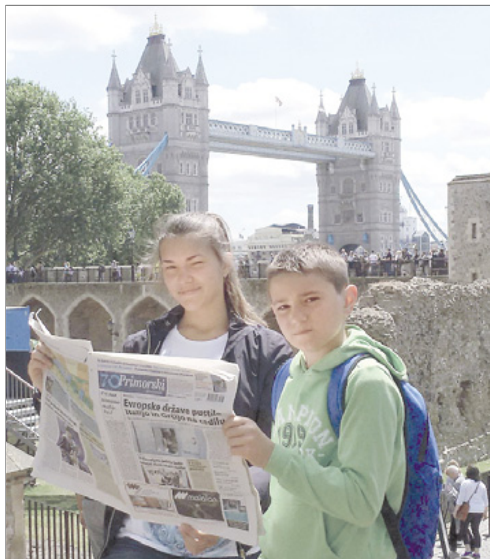
S Primorskim dnevnikom v Londonu