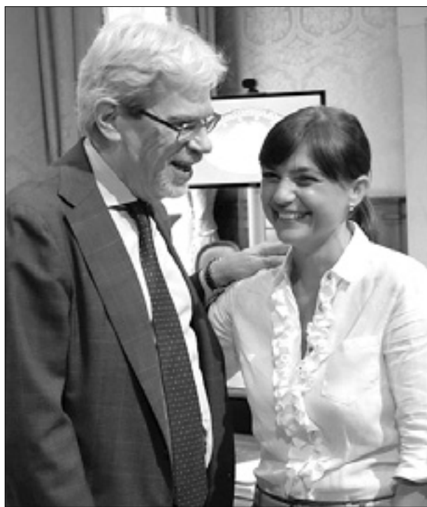
Levo nasmejana Debora Serracchiani in vladni podtajnik Claudio De Vincenti po včerajšnjem podpisu dogovora; desno železarna, ki še vedno onesnažuje Škedenj in okolico

Včeraj sklenjeni programski dogovor predstavlja zadnjo etapo v zapletenem sanacijskem postopku, ki se je pričel lanskega januarja. Okvirni dogovor so sklenile krajevne uprave, vlada in pristaniška oblast, k sanacijskemu po-