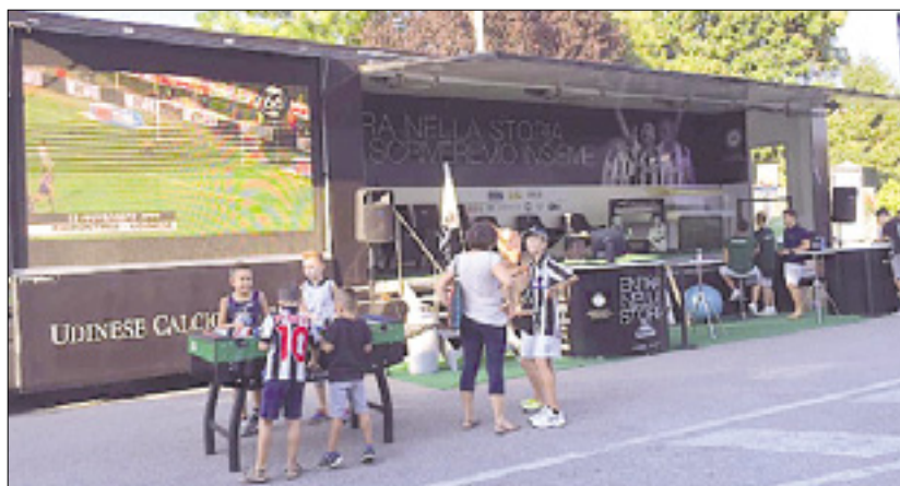
Udinesejev avtobus na Korzu (pod naslovom) in tovornjak v Podturnu

trenutno mudijo v španskem mestu Granada, kjer jih danes ob 20.30 čaka prijateljska tekma s tamkajšnjo nogometno ekipo. Kasneje se je na Korzo pripeljal še izredno tehnološki avtobus novogoriške družbo Avrigo, ki bo nogometna Udineseja prevažal po celem italijanskem polotoku. Nekoliko bolj zabavno je bilo v Ulici Veniero v