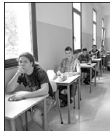
Matura na zavodu Stefan

Vlada FJK se je tako odločila na osnovi sklepa deželnega sveta in pozitivnega mnenja deželne posvetovalne komisije za slovensko manjšino. Deželni sklad za slovensko manjšino je uvedla Illyjeva uprava, nato so sklad uzakonili v deželnem zaščitnem zakonu za slovensko manjšino iz leta 2007. V času desnosredinske uprave predsednika Renza Tonda je ome-