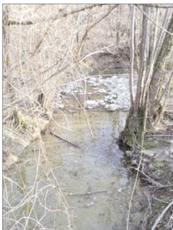
Potok pred začetkom regulacijskega posega (levo); mladice soških postrvi so v njem dobile dober življenjski prostor, tako da so v enem letu zrastle od treh do dvaintridesetih centimetrov dolžine (desno)