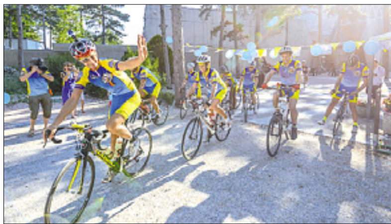
Skupina kolesarjev med startom na Vejni

Poleg kolesarjev iz Verone so na pot proti Bosni krenili še trije tržaški kolesarji, med temi Laura