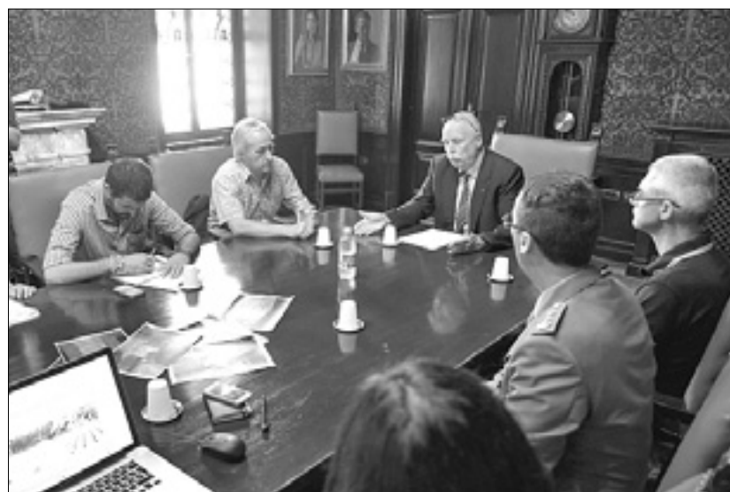
Projekt so včeraj predstavili na tiskovni konferenci, desno grobovi na avstro-ogrskem pokopališču v Nabrežini