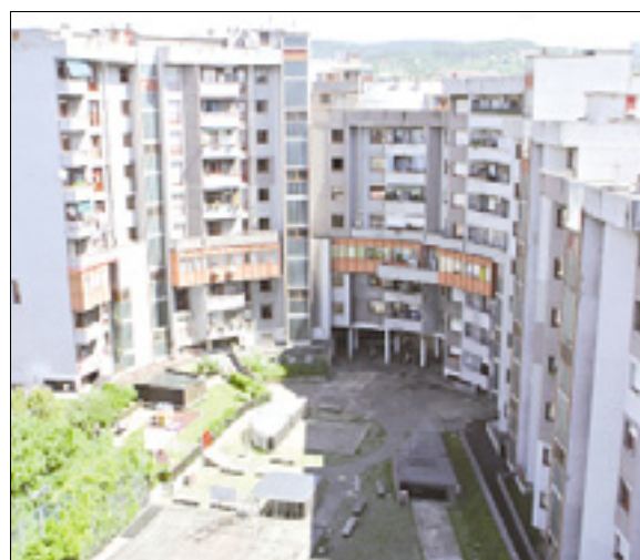
Podjetje Ater ima v Trstu številna stanovanja

Omenjene občine in podjetja ATER imajo za vložitev prošnje čas do 7. septembra, dežela pa mora ustrezni seznam dostaviti ministrstvu za infrastrukturo do 18. septembra.