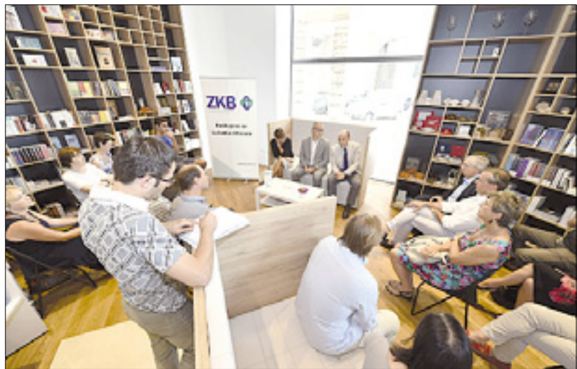
Pobudo so predstavili v Tržaškem knjižnem središču

Spodbujanje branja zlasti slovenskih avtorjev - Kupon unovčljiv v TKS