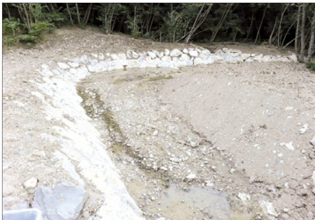
Regulirani del pritoka Grojnice

Kdor si hoče ogledati regulirano strugo potoka, se mora peš odpraviti iz doline Grojnice proti Oslavju. Po šesto metrih hoje po gozdu bo zagledal regulirani del potoka in se verjetno vprašal, zakaj so strugo utrdili s tako velikimi kamni, saj nikogar ne ogroža. Potok teče pod pobočjem, na katerem rastejo večinoma samo akacije; v bližini ni hiš, le nekaj vinogradov je na nasprotnem pobočju. (dr)