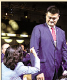
Yao Ming

TOKIO - Kitajska, kjer je košarka po zaslugi zvezdnika Yaa Minga postala v zadnjih letih zelo priljubljena, je teden dni po zmagi na izboru za organizatorja zimskih OI 2022, dočakala tudi prvo največje tekmovanje v tem športu. Mednarodna košarkarska zveza (Fiba) je včeraj odločila, da bo svetovno prvenstvo za košarkarje leta 2019 na Kitajskem. Kitajska je imela za izvedbo tega SP, na katerem bo prvič nastopilo 32 reprezentanc, enega protikandidata, Filipine, a so Kitajci na zasedanju Fibe v Tokiu dobili več glasov. Na koncu je bilo glasovanje dokaj prepričljivo v prid Kitajske, ki je zmagala s 14 glasovi proti sedmim. Kitajci bodo prvo SP pripravili v osmih mestih: v Pekingu, Nanjingu, Suzhouju, Wuhanu, Guangzhouju, Shenzhenu, Foshanu in Dongguanu.